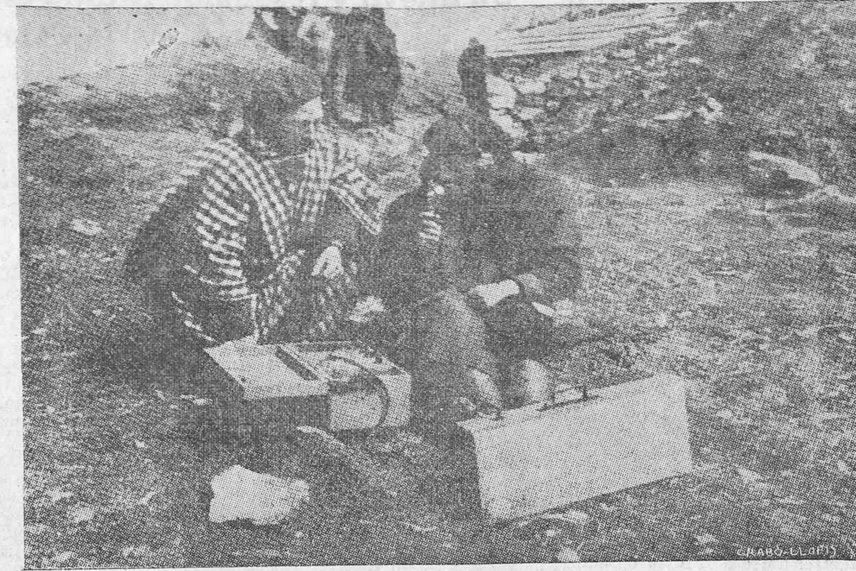
Del diario italiano "Corriere della Sera" reproducimos esta fotografía tomada en el frente de Vizcaya y en la que aparece una de las estaciones portátiles de nuestra Radio Requeté, cuyos servicios inapreciables han sido oficialmente reconocidos y van a ser premiados con la Medalla Militar.