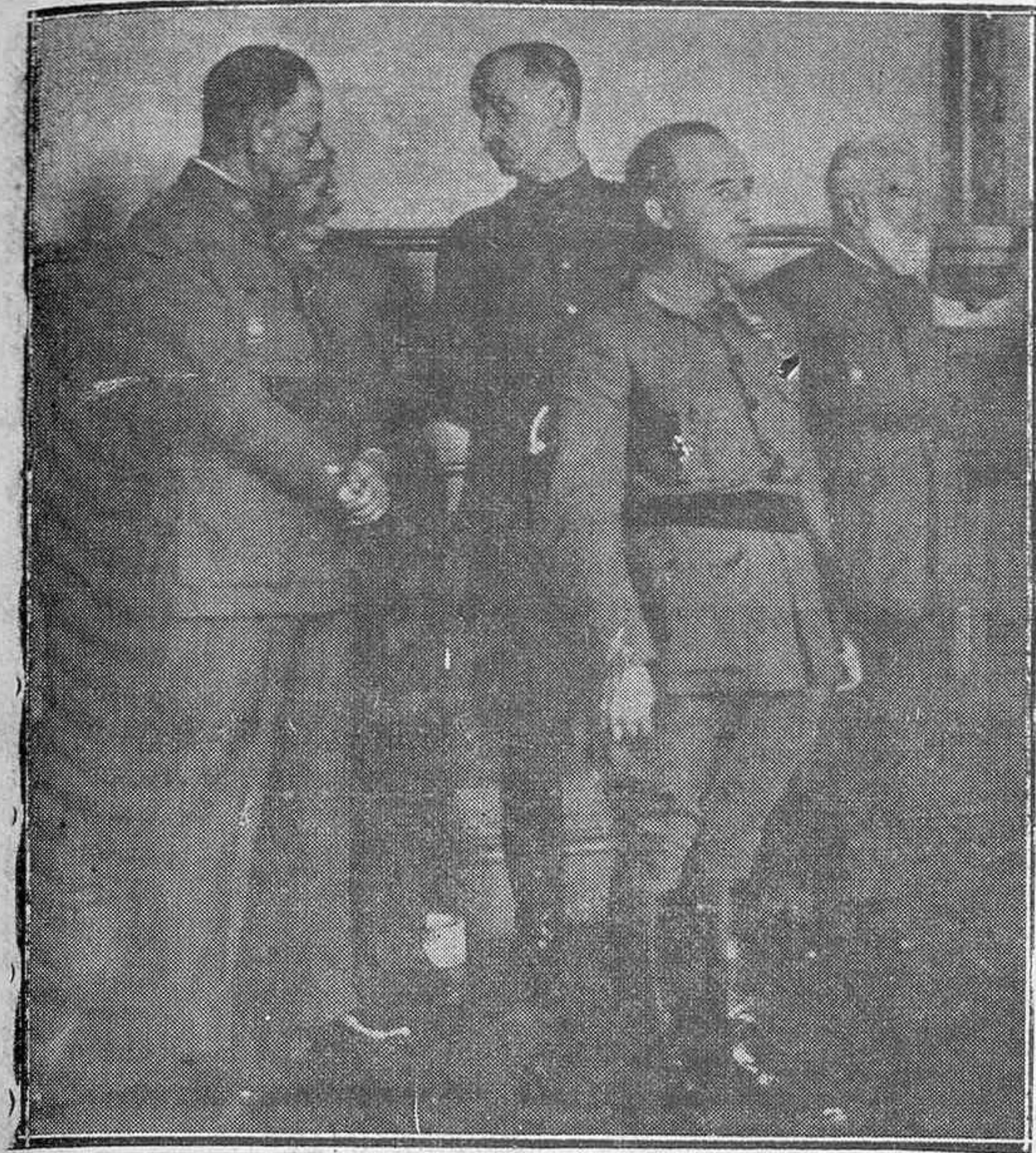
El Generalísimo Franco, con los generales Mola, Queipo de Llano y Cabanellas.

El secreto que se guarda celosamente alrededor de estos descubrimientos muestra que se trata de secretos de defensa nacional y que encontrarán aplicación en la técnica militar.