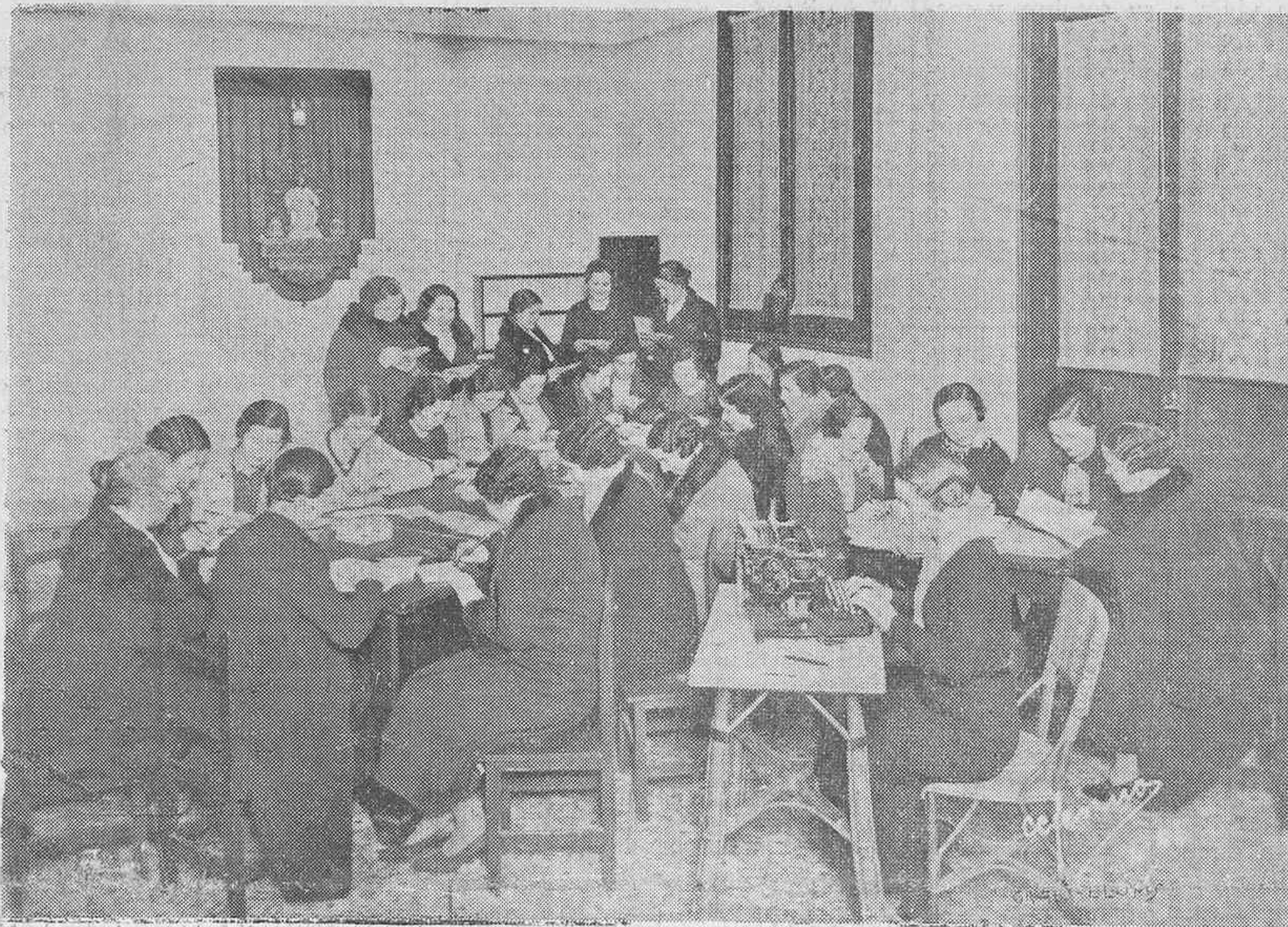
Una de las oficinas de la Sección Femenina de Hermandad Alavesa, en plena labor.

Veinticuatro mil cartas en un día. Millares y millares de impresos Cuidadosa organización de delegados e interventores