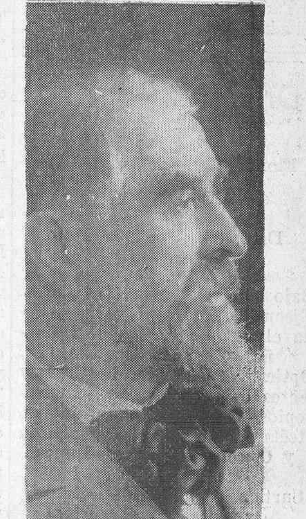
Don Miguel Blay, el ilustre escultor que ha fallecido.

(Señor Alcalá Zamora, en su discurso parlamentario de 27 de octubre de 1931.)