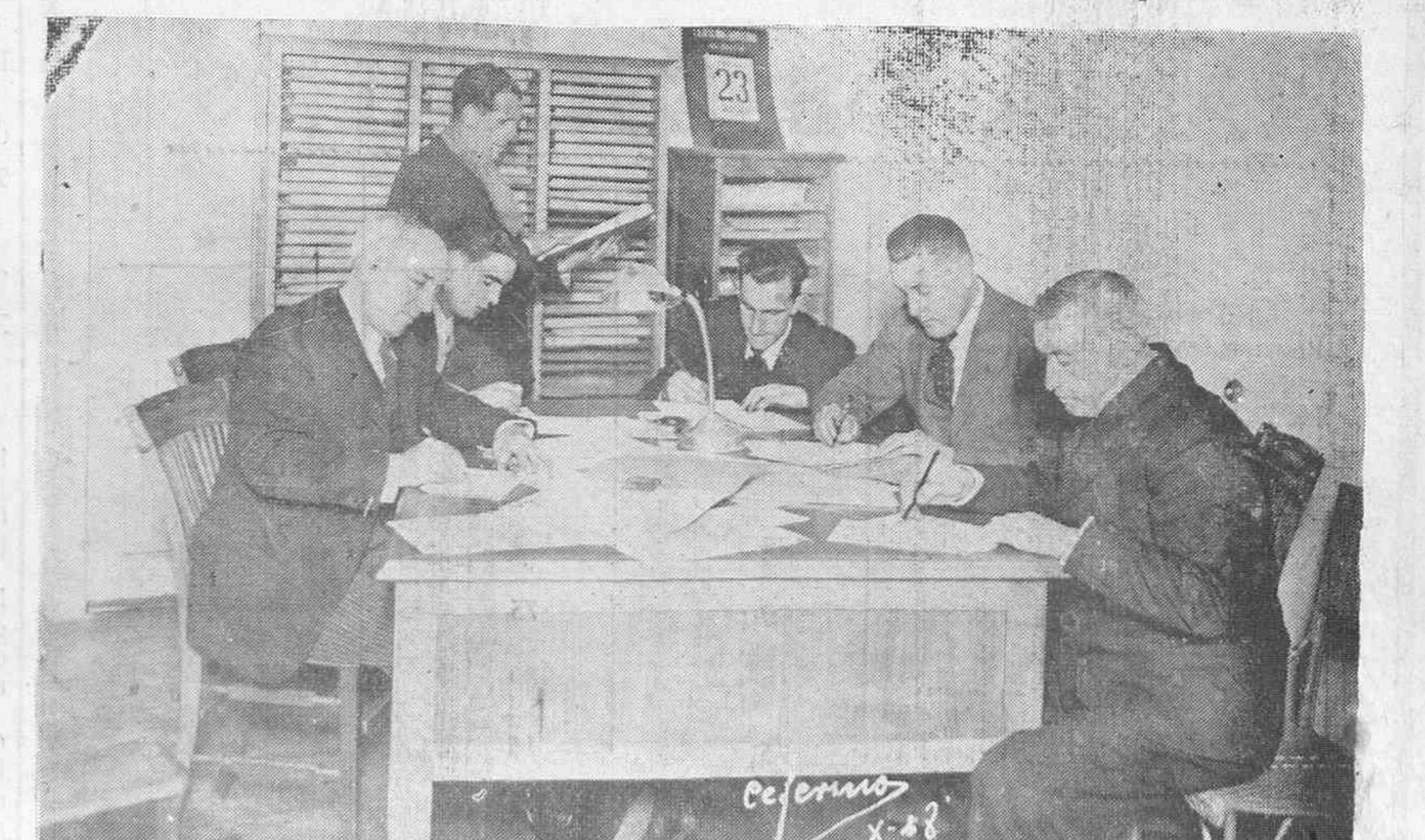
Sección de Archivos, en la que colaboran entusiastas miembros de Hermandad Alavesa.