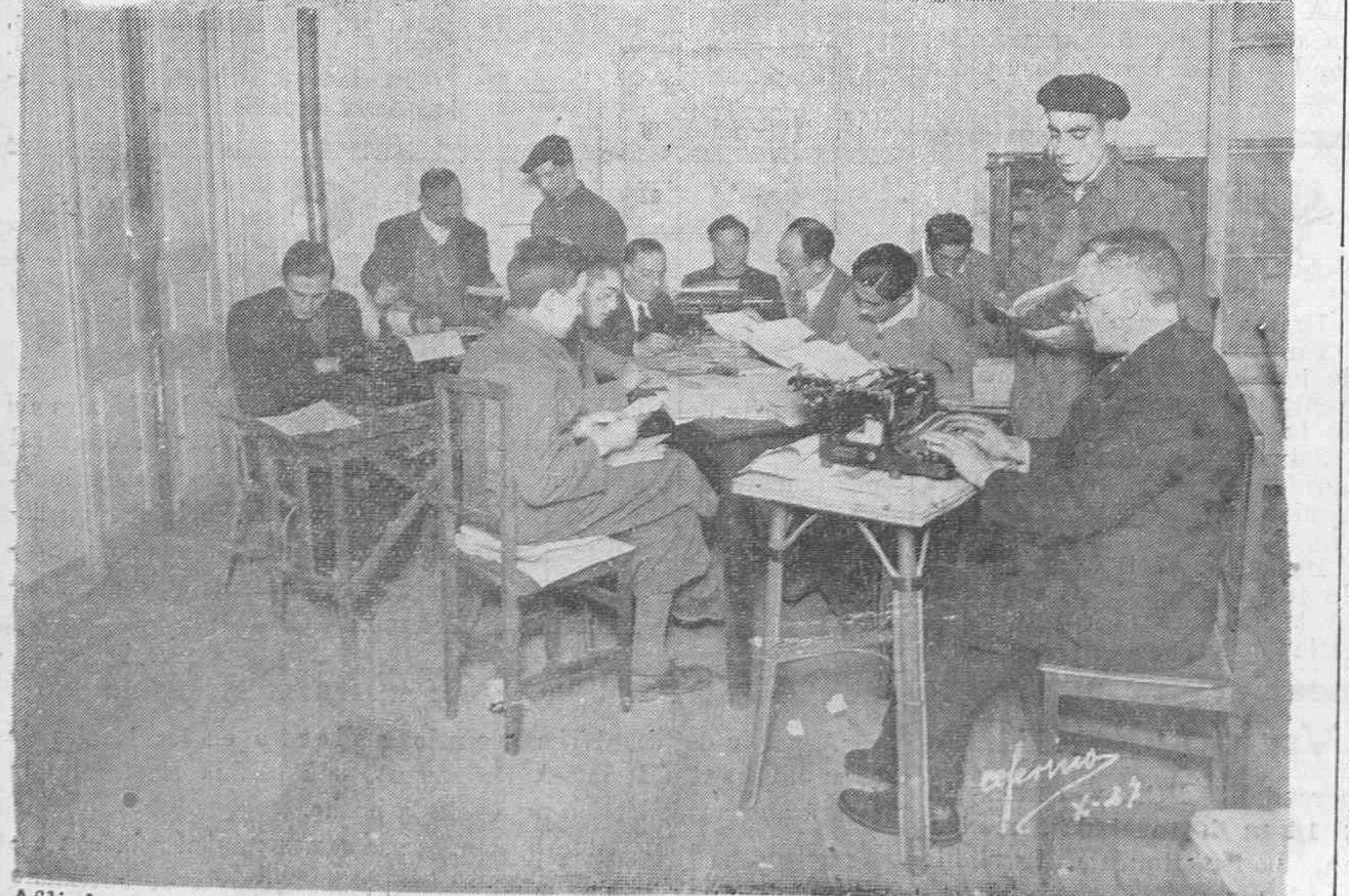
Afiliados a la Juventud Tradicionalista, trabajando en la campaña electoral.