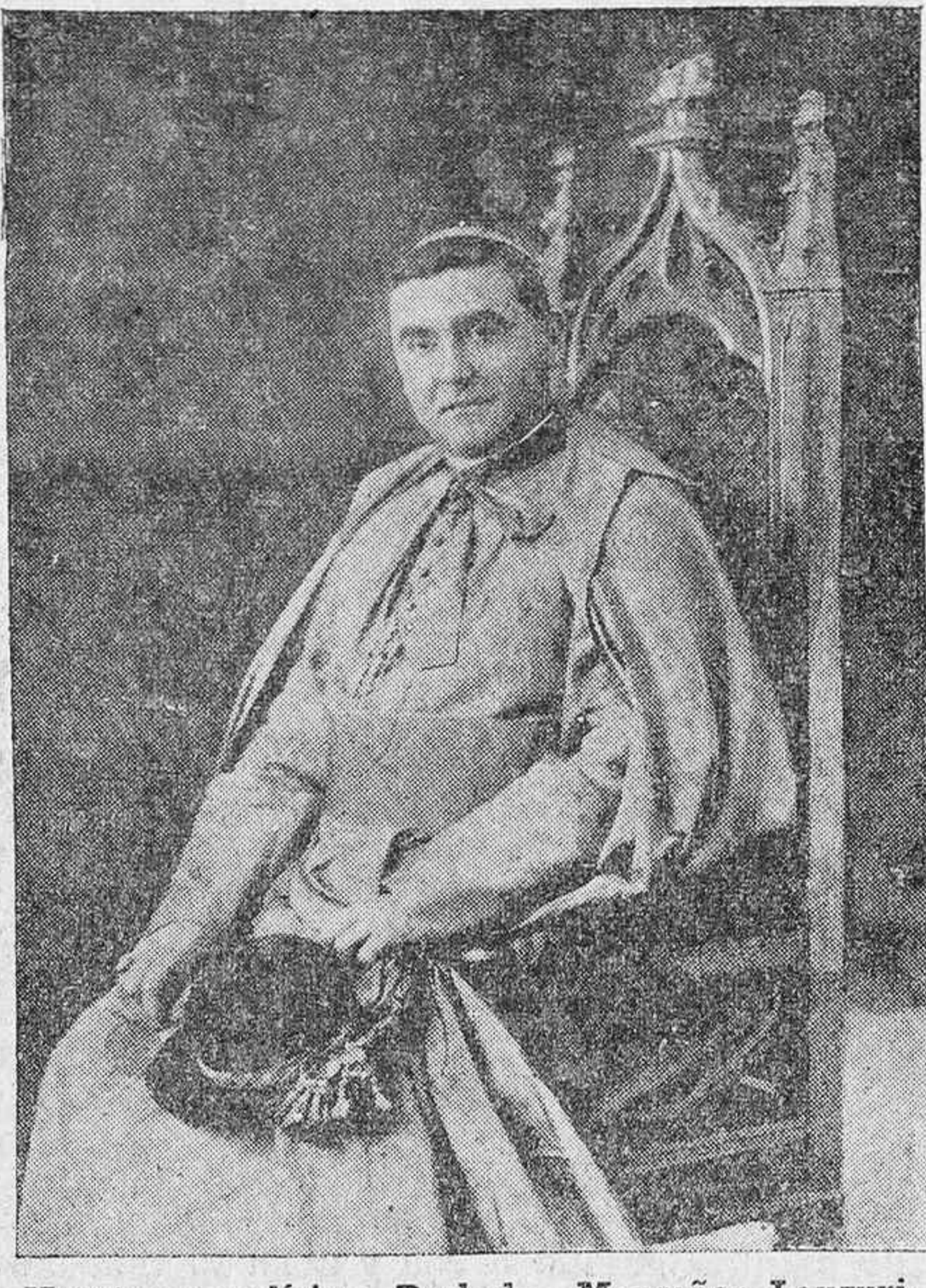
Nuestro amadísimo Prelado, Monseñor Lauzurica, cuya mayor solicitud se encierra a la formación religiosa y patriótica del Clero de nuestra Diócesis, que ha organizado el tradicional Día pro Seminario.

El Boletín Oficial del Obispado publica hoy la siguiente carta de nuestro amadísimo Prelado: Una vez más nos dirigimos a Nuestros amadísimos hijos de la Diócesis de Vitoria para confesar con ellos Nuestros cuidados y esperanzas sobre la obra sublime del Seminario y de la formación de los seminaristas. Y lo hacemos en primer lugar para recordarles que la celebración del primer día del Seminario, que tuvo lugar el pasado curso, sirvió para demostrar cuán cerca está la masa de los fieles de los vitales problemas que tiene hoy planteados la Iglesia. Nuestros seminaristas fueron recibidos con gozo en todos los pueblos y parroquias donde postularon y volvieron con el amplísimo fruto de la caridad diocesana, que aseguraba por aquel año el sostenimiento de su formación esmerada y de su frugal manutención. En nombre de los seminaristas necesitados a quienes pudimos acoger en Nuestro Seminario gracias a la caridad de los fieles, en nombre de la Diócesis entera, que ve de esta manera asegurada la sucesión ininterrompida de sus sacerdotes, en nombre del Papa a quien llegaron las no-