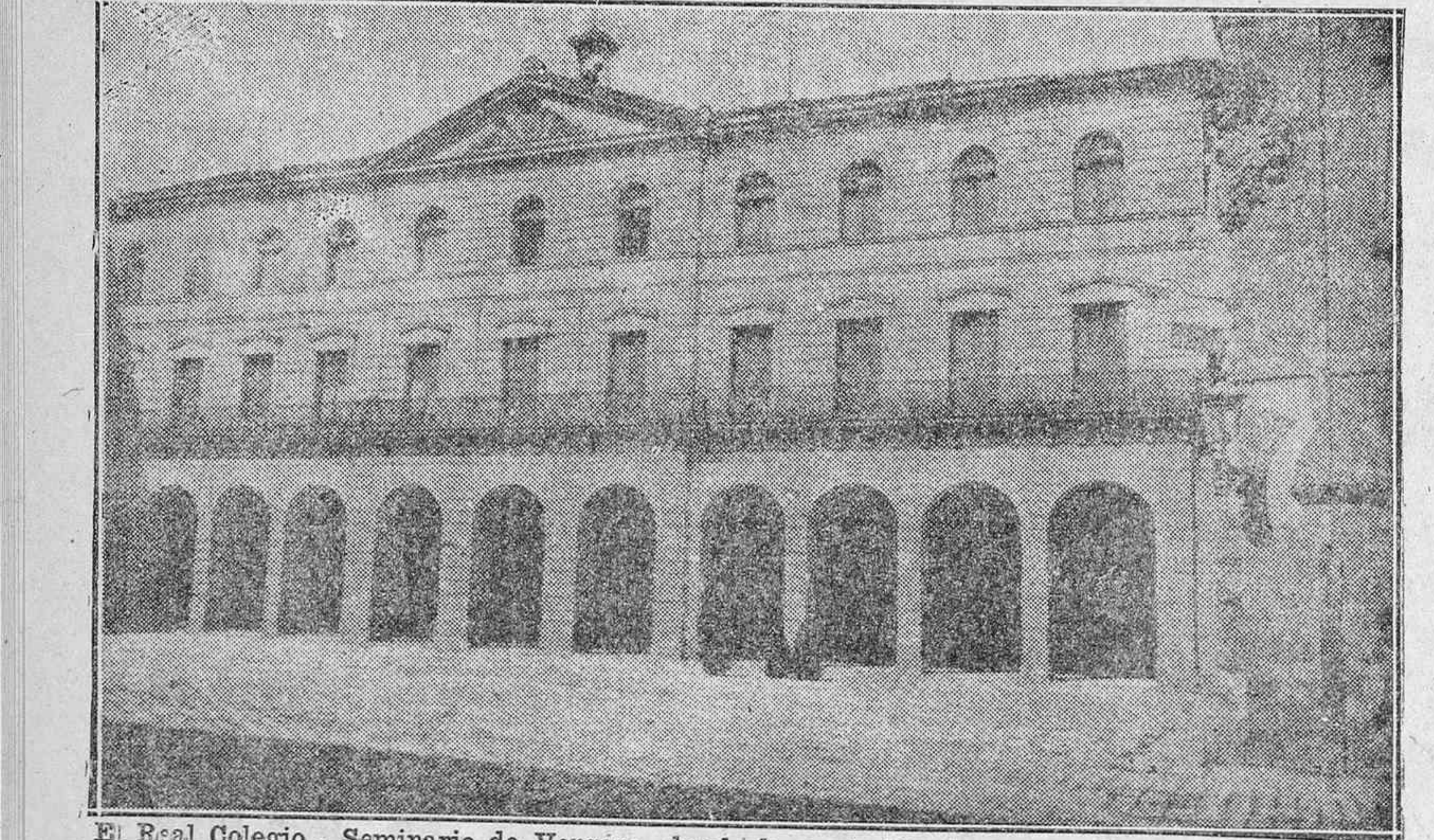
El Real Colegio - Seminario de Vergara, donde hoy estudian los cursos los seminaristas de toda la Diócesis, y que el día de la Inmaculada harán un Colecta en los templos de las tres provincias

que se propone a toda la Iglesia no podrá realizarse sin la primaria cooperación del sacerdote; porque es el sacerdote por vocación y mandato divino el apóstol y defensor infatigable de la educación de la cristiana juventud (Carta-Encicl. "Divini illius Magistri"); él, en nombre y con autoridad de Dios, bendice el matrimonio cristiano y defiende su perpetuidad y santidad contra los errores y embustes de la sensualidad y concupiscencia (Enc. "Vitoriana de Espectáculos S. A." abre un concurso para el arriendo del Salón-Bar instalado en el Nuevo Teatro, ajustándose al pliego de condiciones que se halla a disposición del que lo desea en la Contaduría del mismo. Horas de once a una y de cuatro a seis.