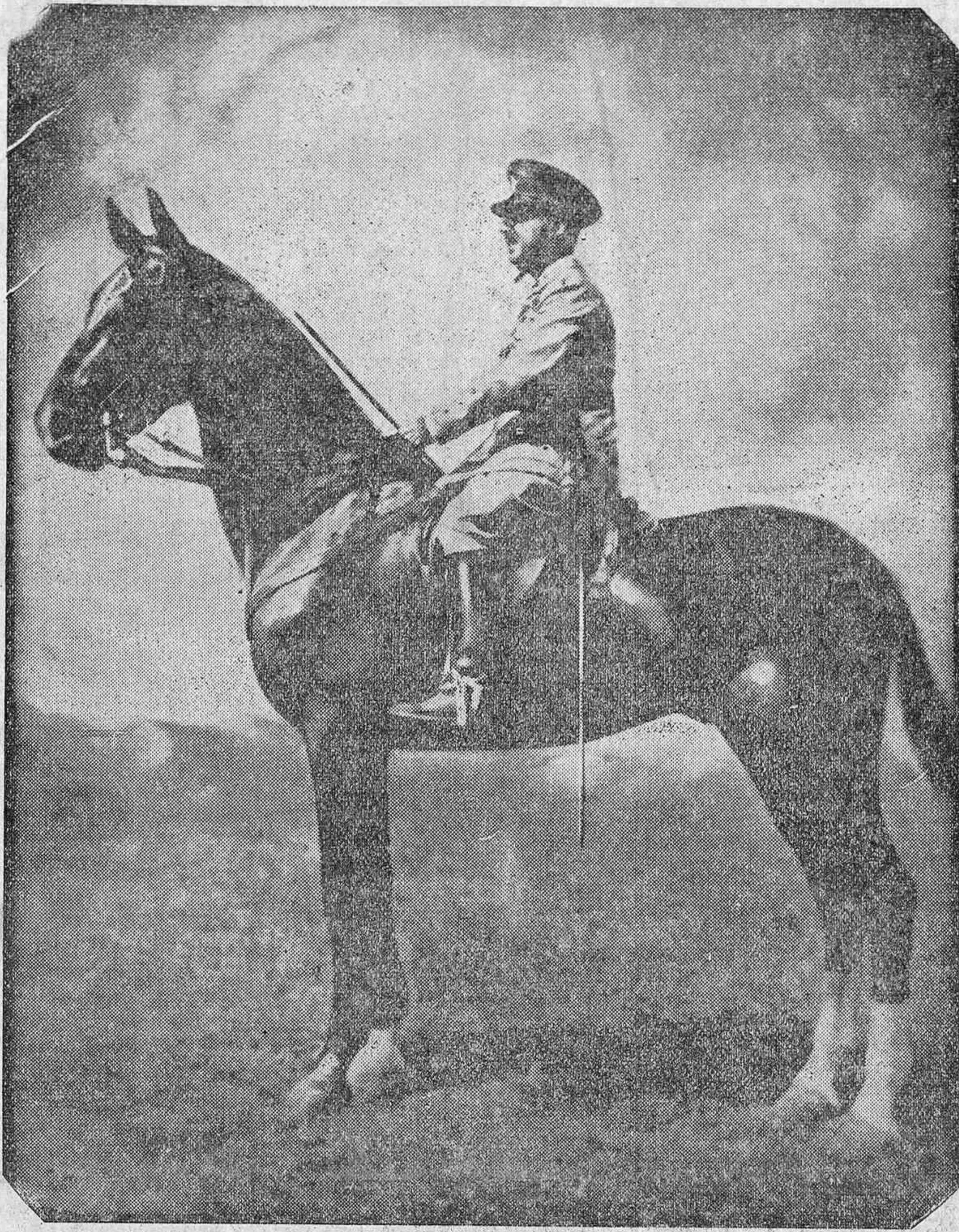
Por los Ministerios

Franco, Franco, Franco. ¡Viva España! ¡Viva Cristo Rey!