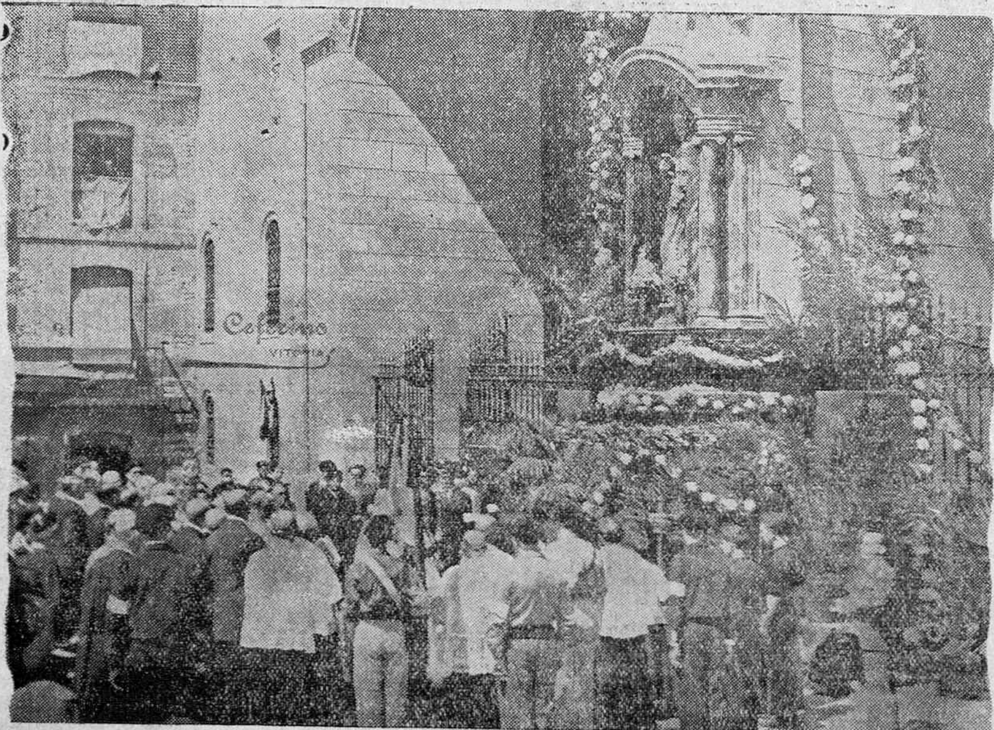
Al partir, nuestros combatientes pasan todos, en julio del 36, ante la hornacina de la Patrona, multiplicándose las escenas patrióticas.