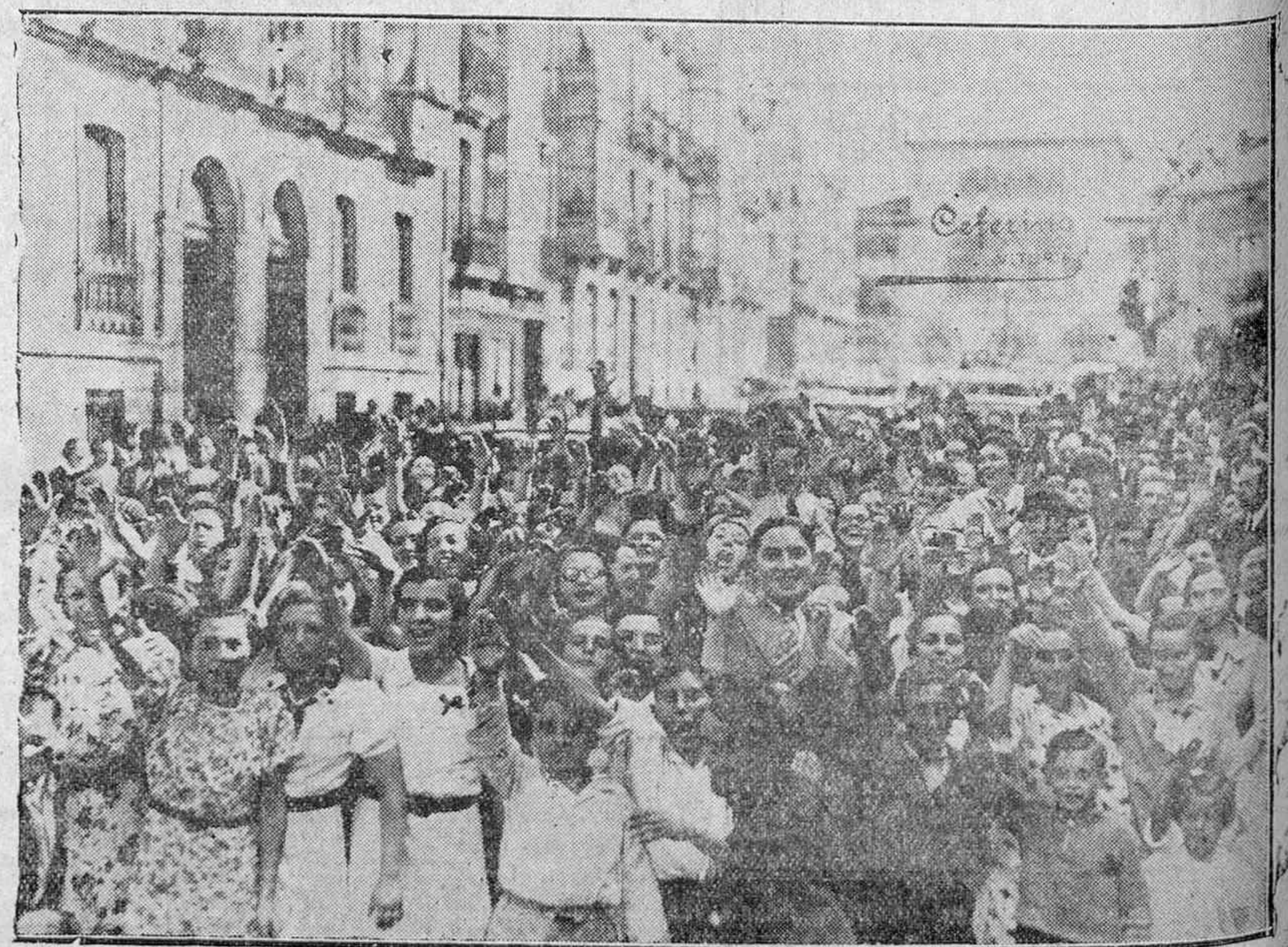
Y el pueblo los despide con desbordamiento de entusiasmo y júbilo patriótico, acompañándoles a la estación con vibrantes himnos.