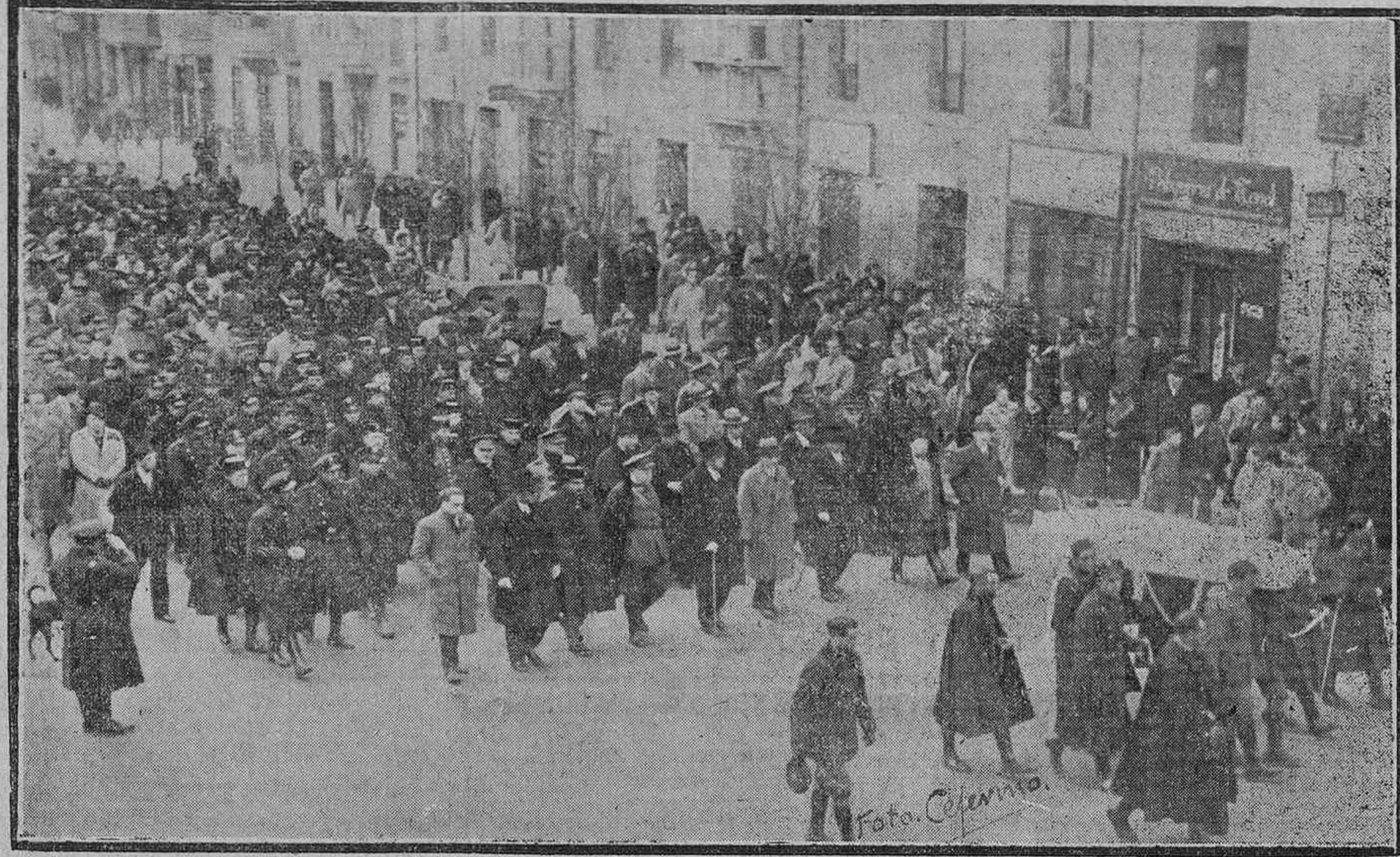
El entierro del Guardia civil muerto por los revolucionarios en Labastida.—El feretro llevado a hombros por la fuerza pública, y la presidencia del duelo