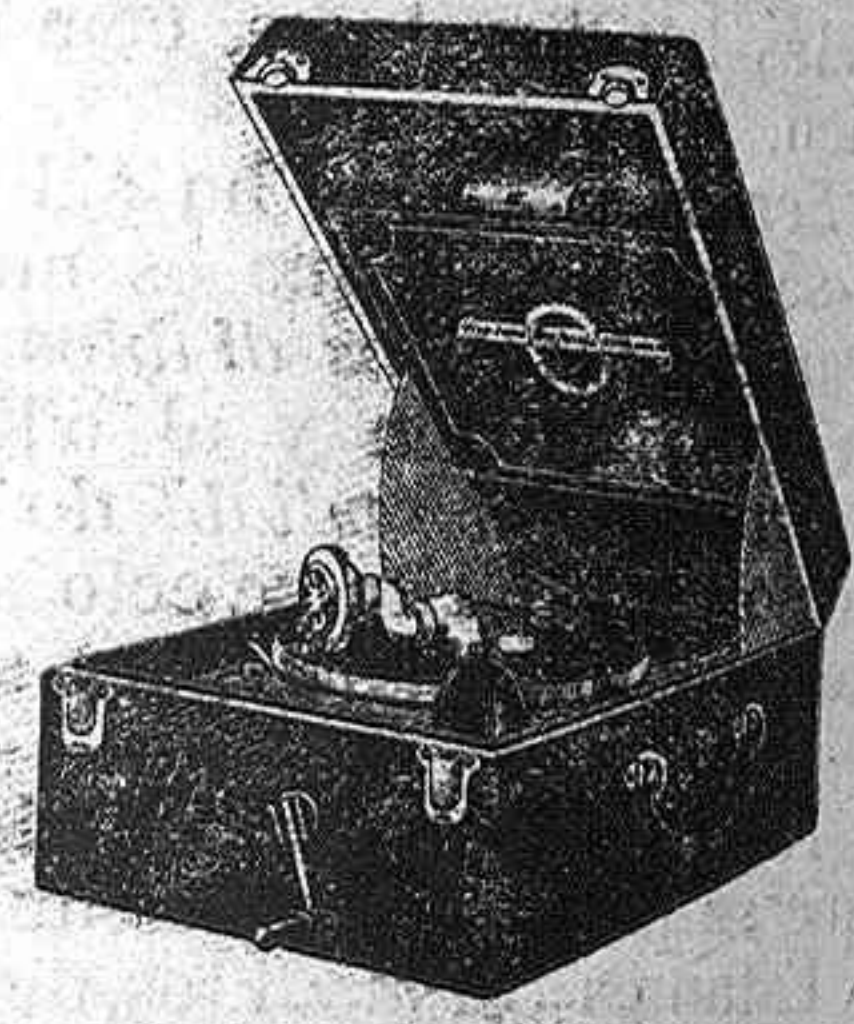
Portables VIVA-TONAL es el ideal para sus excursiones, y los discos dobles