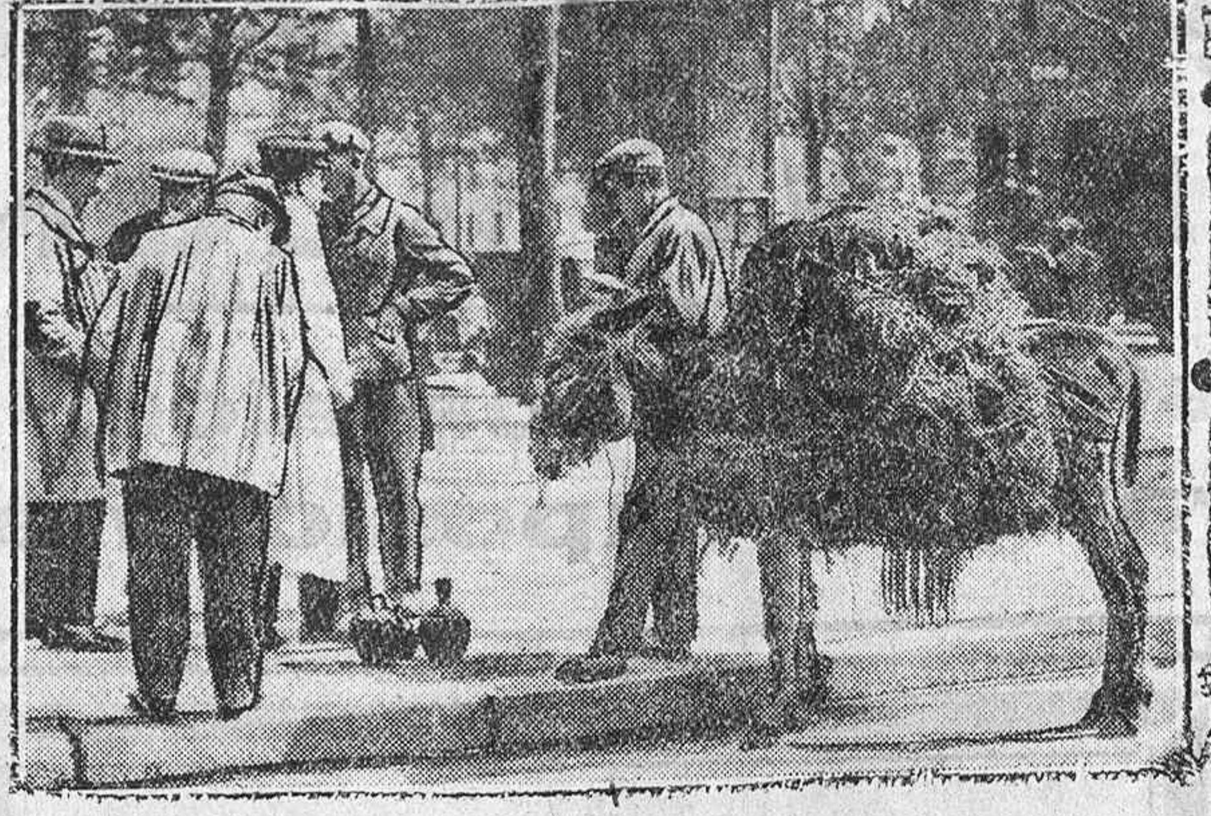
Por primera vez ha destilado por las calles de París el farero sevillano con su borriquito. Poco a poco, sin apresurarse, llegaron los dos desde la tierra del sol a la de los cielos grises.

Pídalo en ultramarinos y droguerías, solamente vale veinticinco céntimos el sobre. Concesionarios: ARTECHE Y LEBRERD Apartado, 5.—Bilbao Agente para Alava: JUAN BURCH Francia, 39.—Vitoria