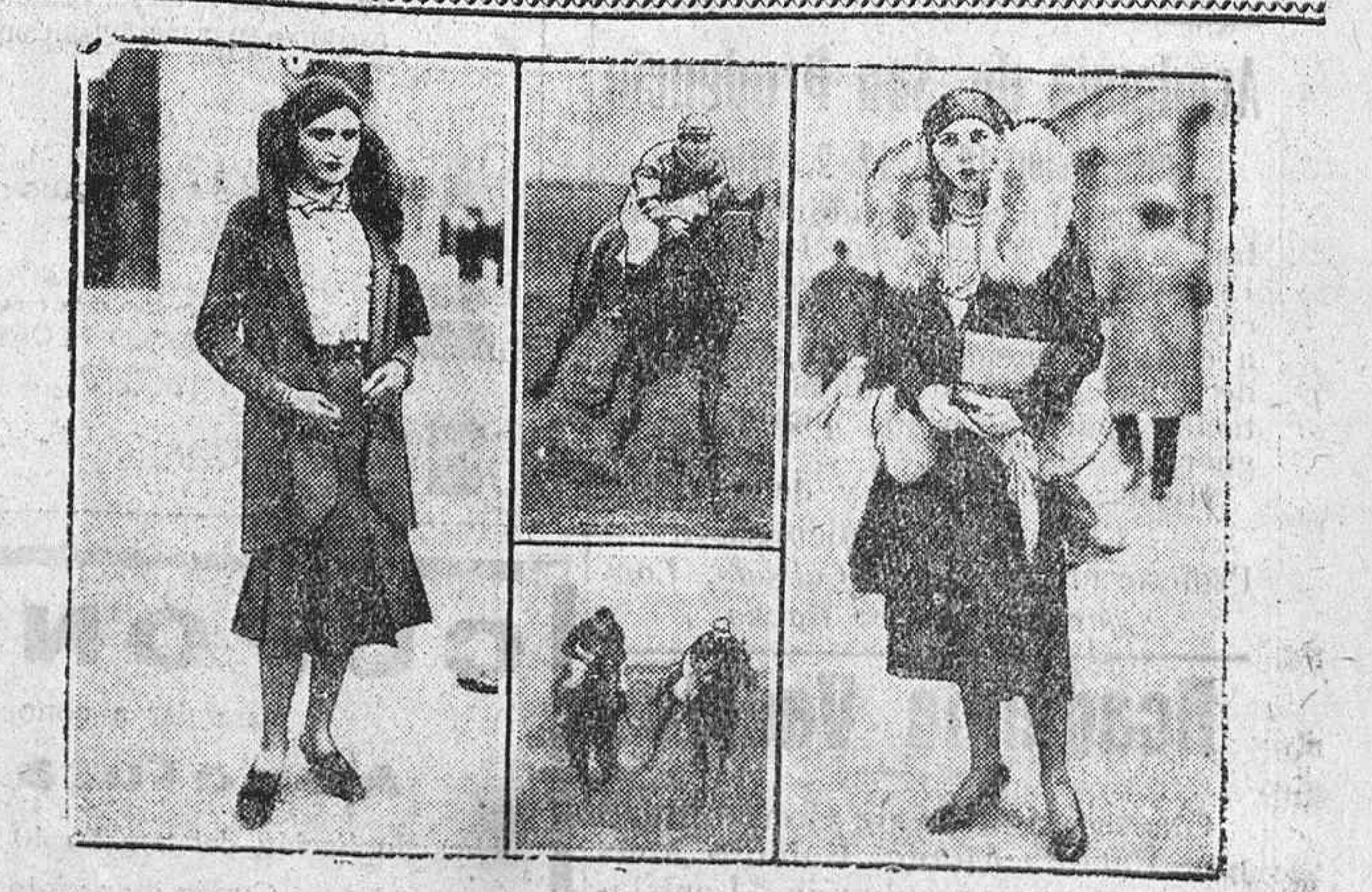
La última reunión en el hipódromo de Autenil, ha sido brillantísima. La tarde espléndida de sol, llevó allí gran número de elegantes parisinas luciendo vistosas toaletas, dos de las cuales se recogen en nuestro grabado.

La moda en las carreras La última reunión en el hipódromo de Autenil, ha sido brillantísima. La tarde espléndida de sol, llevó allí gran número de elegantes parisinas luciendo vistosas toaletas, dos de las cuales se recogen en nuestro grabado.