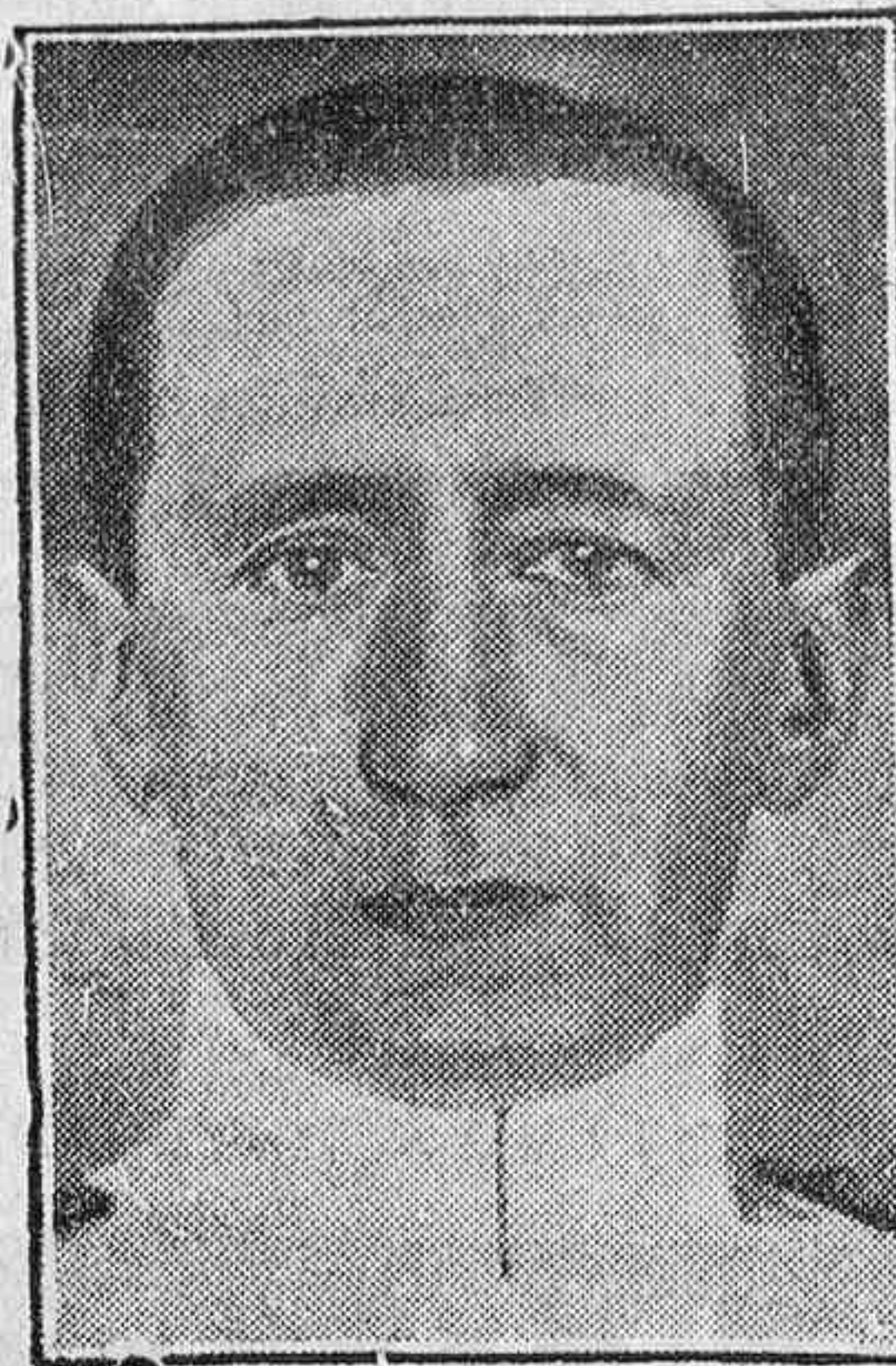
El inventor Marconi, que de ayer se encuentra en Sevilla.