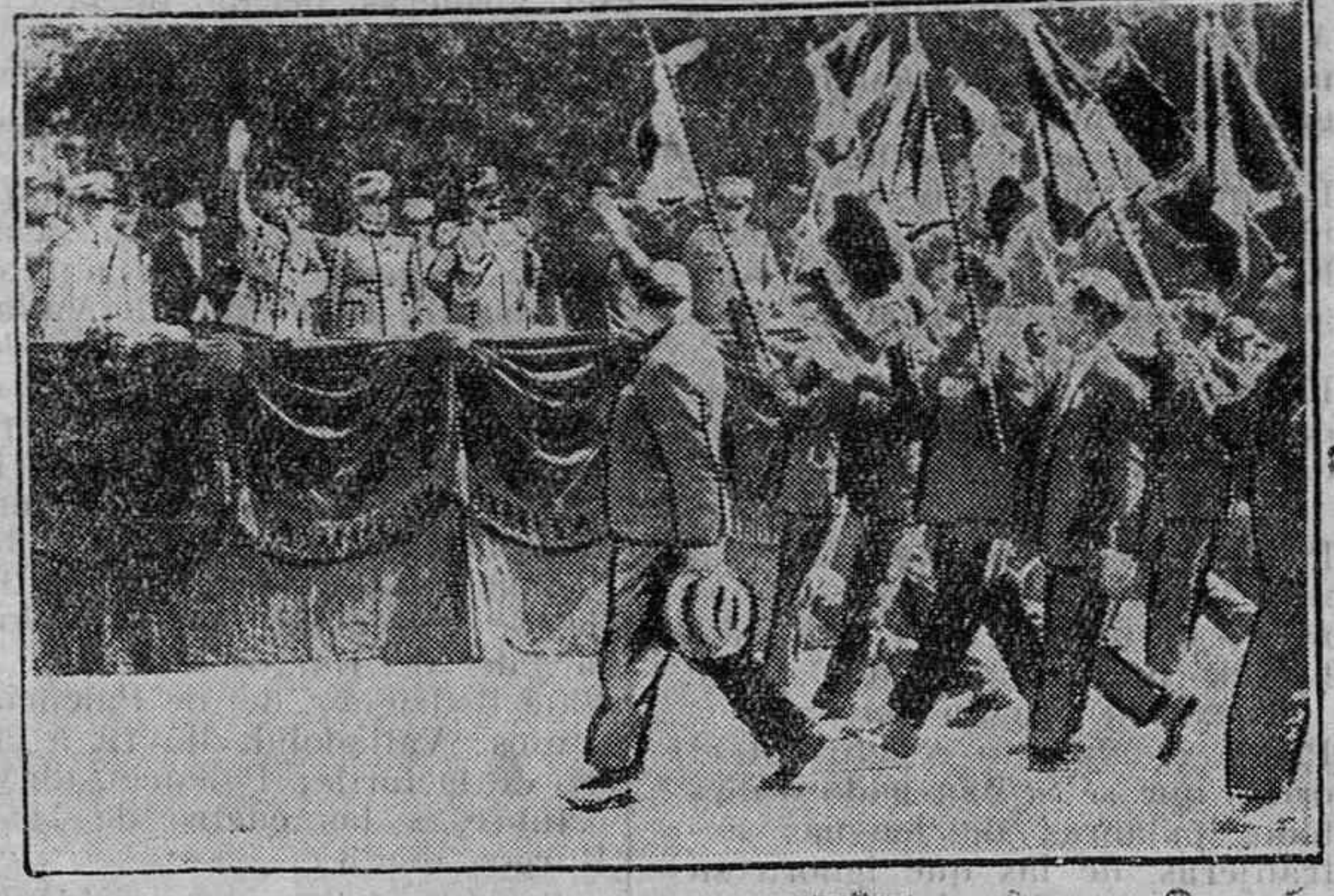
Cuarenta mil antiguos combatientes italianos han ido a Roma de todas partes de la península, para jurar fidelidad al régimen fascista.—He aquí el desfile delante de Mussolini.