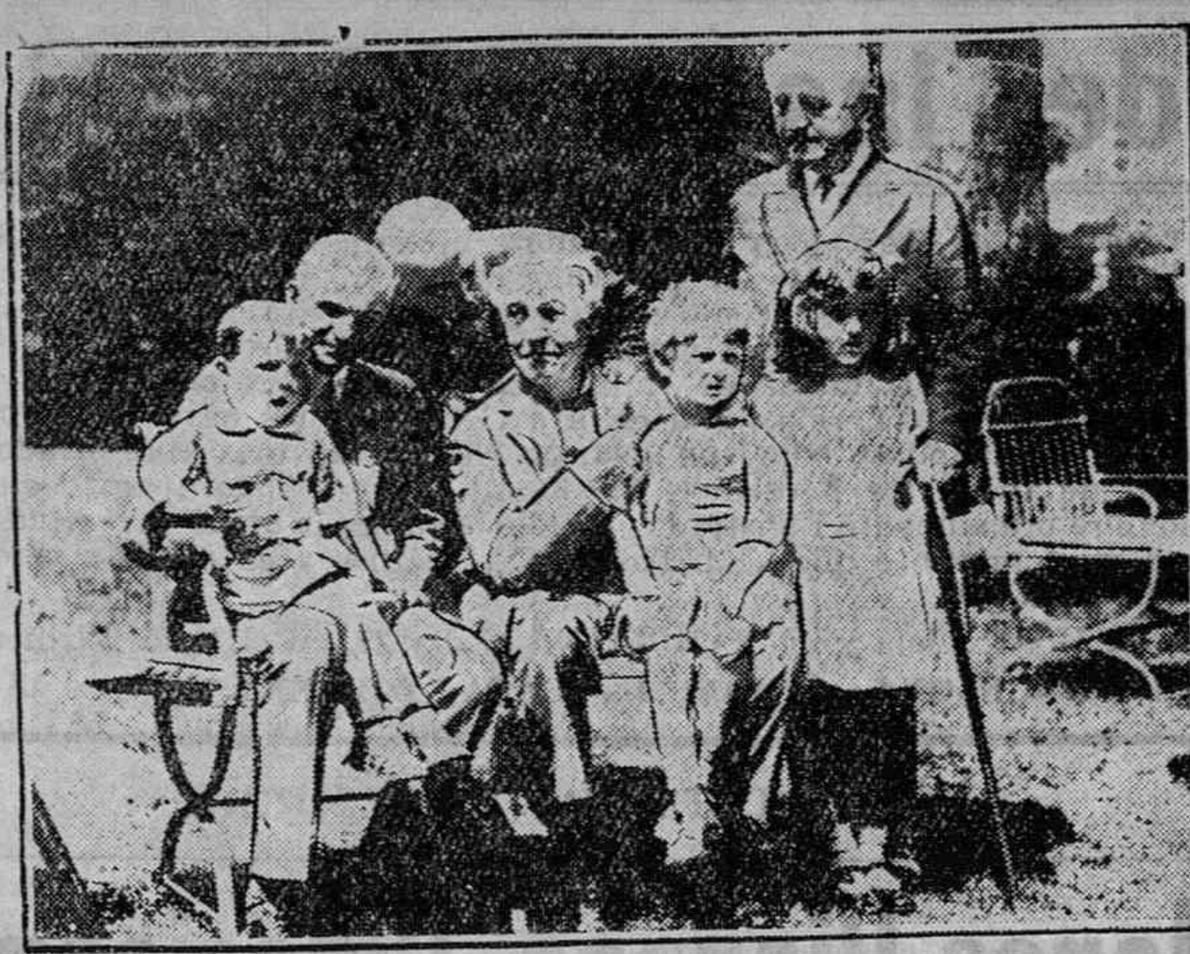
Henry Ford y Thomas Edison fotografiados con sus nietos en la propiedad que tiene este último en Chautauqua (Estado de Nueva York).

Los motores son de seis cilindros con válvulas en culata.