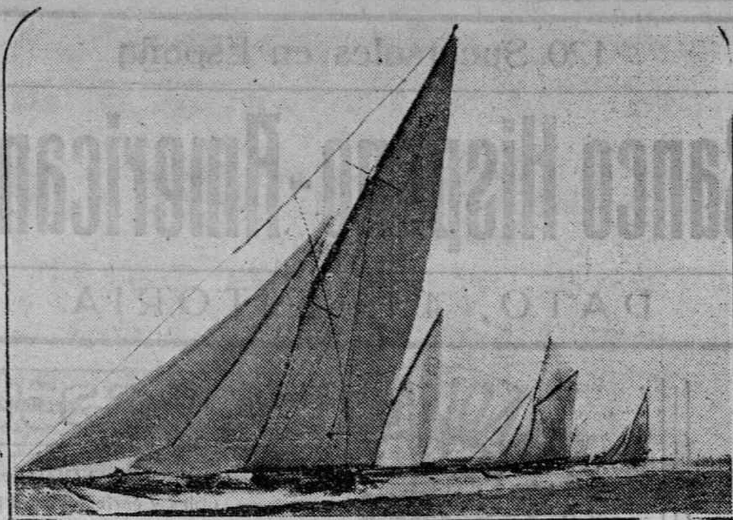
Los balandros de la regata de Phymouth, en plena marcha.

En el sorteo de ayer salieron agraciados los números siguientes: 18.505 — 21.519 — 21.572 — 29.775 29.834 — 32.617 — 28.590 — 33.350 23.384 y 4.839.—Total 10 premios.