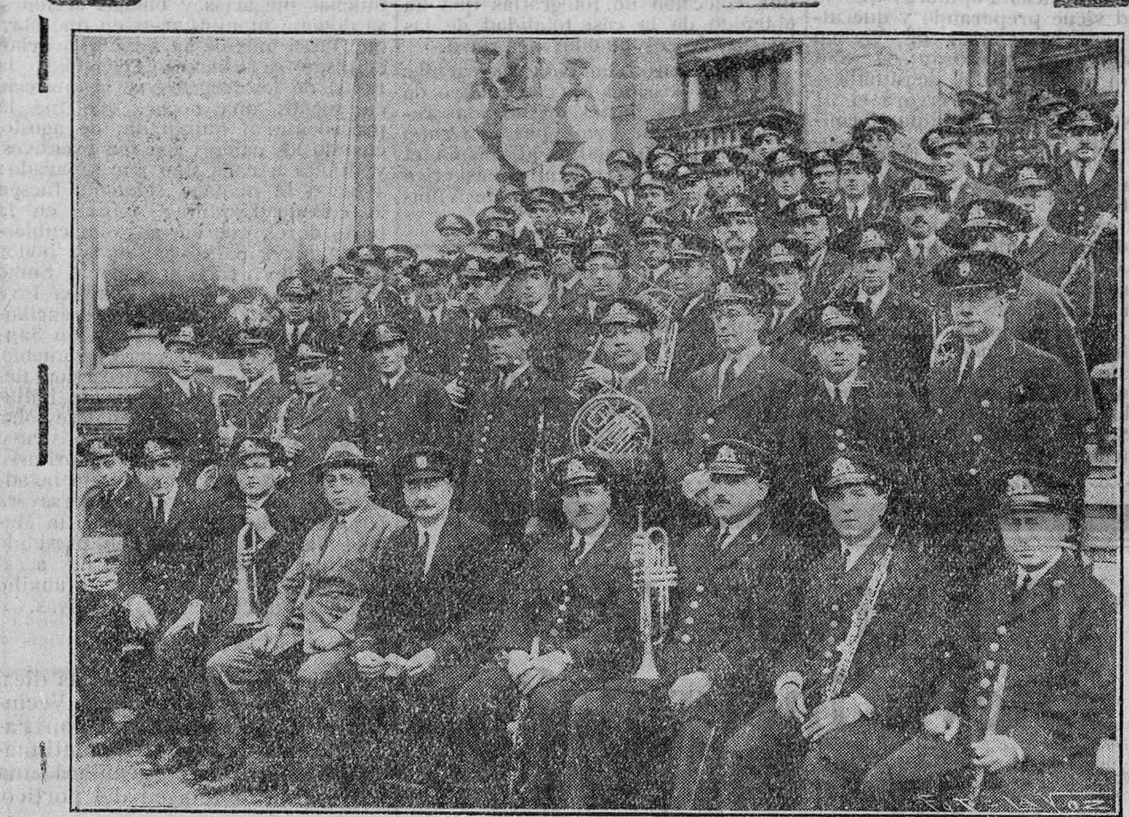
He aquí a la notable agrupación que mañana, martes, a las ONCE, dará un concierto en el Teatro Príncipe.

Cuarto grupo de piezas.—Sobre tres palos distanciados arderán tres bonitas piezas a movimiento rotatorio ver-