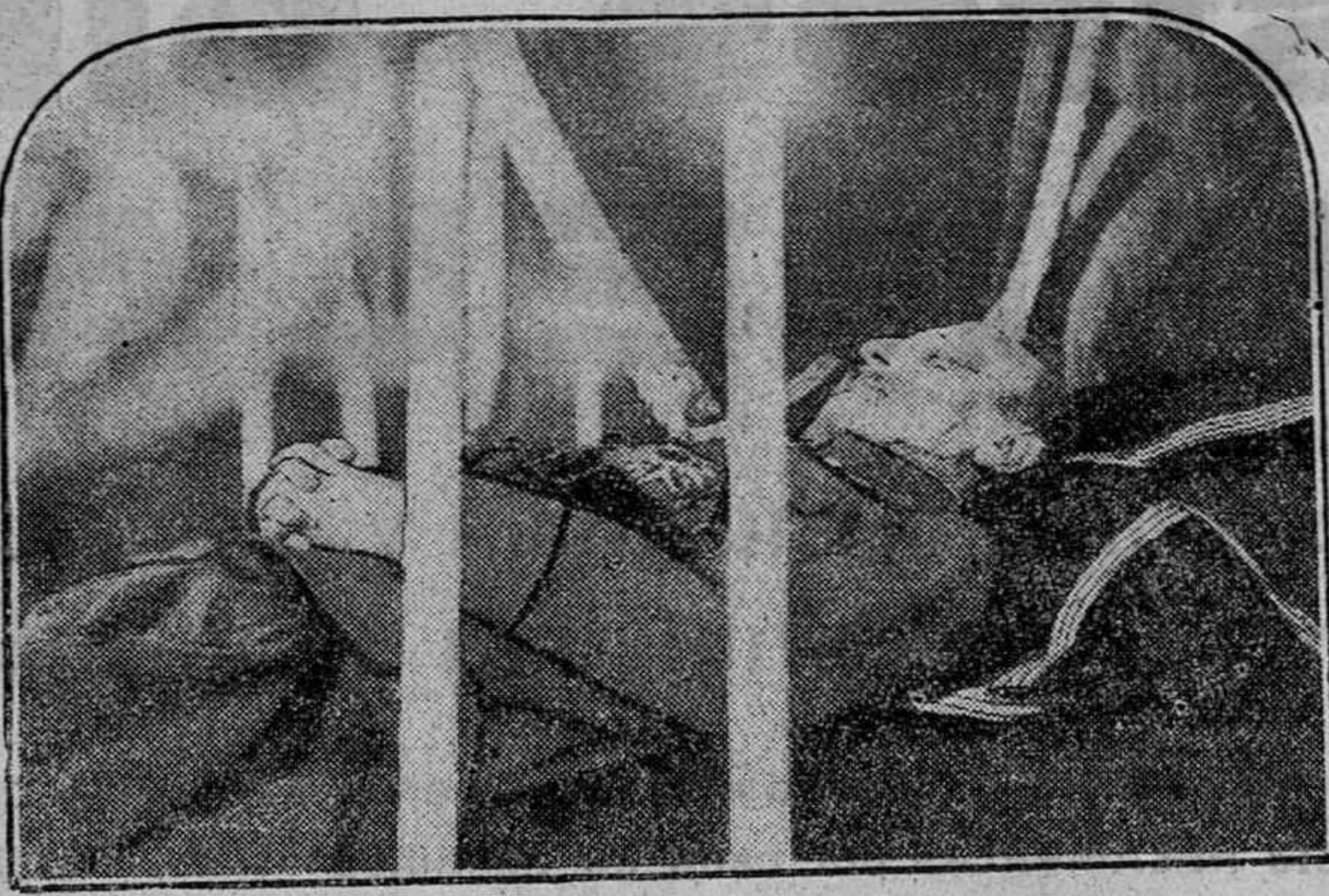
EL CADAVER DEL MARISCAL FOCH EN SU LECHO MORTUORIO EL CADAVER DE FOCH, EN NOTRE DAME

PARIS.—A las once de la noche de ayer, en medio de un cordón de fuerzas de Infantería y de Caballería que se colocaron a lo largo de la Avenida de los Campos Eliseos, portadores de antorchas, pasó el cortejo con dirección a la iglesia de Notre Dame, ante cuyo atrio e inmediaciones se habían congregado miles de personas.