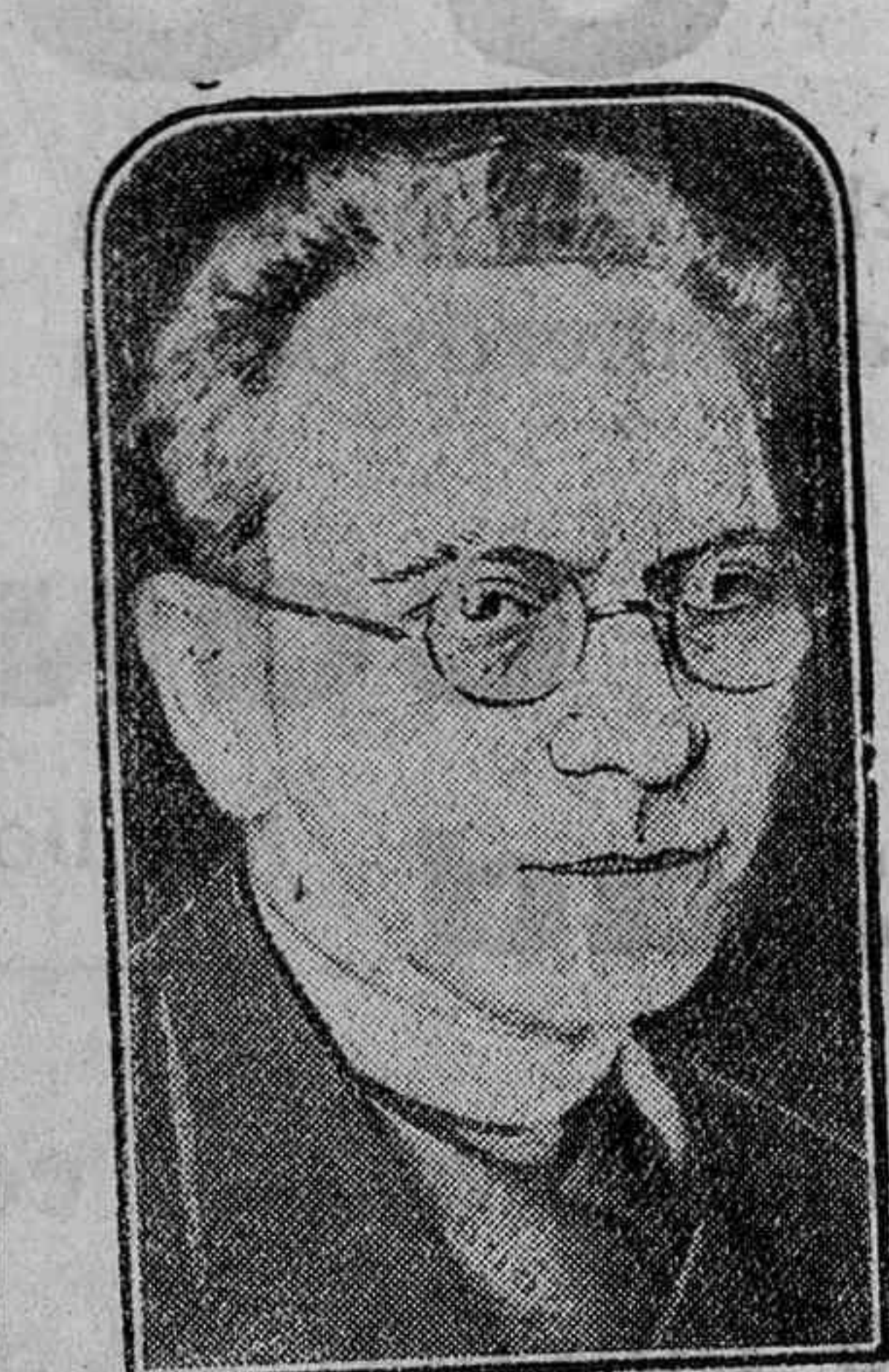
El jefe del partido del Centro alemán M. Kaas que ha sido consultado por el canciller alemán Herman Muller para formar un Gabinete de unión con los otros partidos.

cuando ellas lo demanden o las circunstancias lo aconsejen.