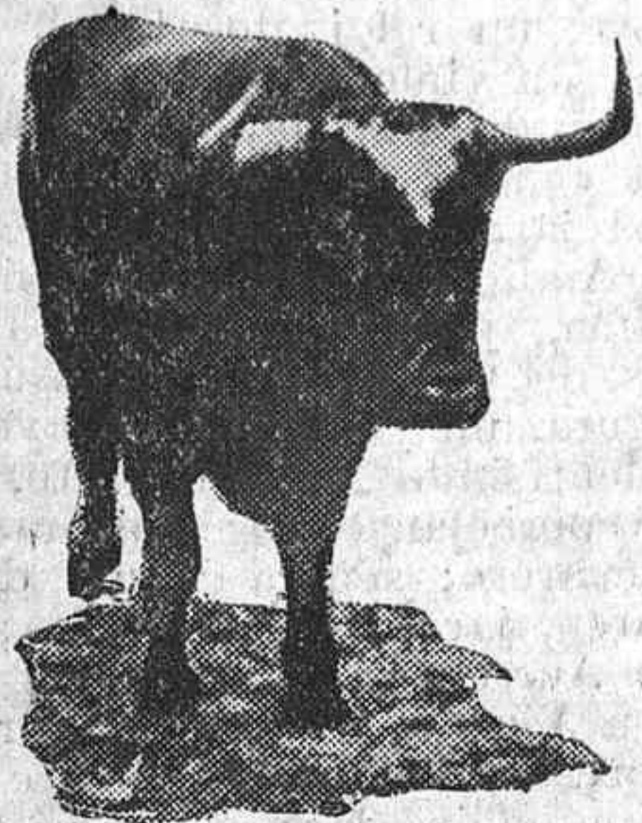
TORO DE VILLAR