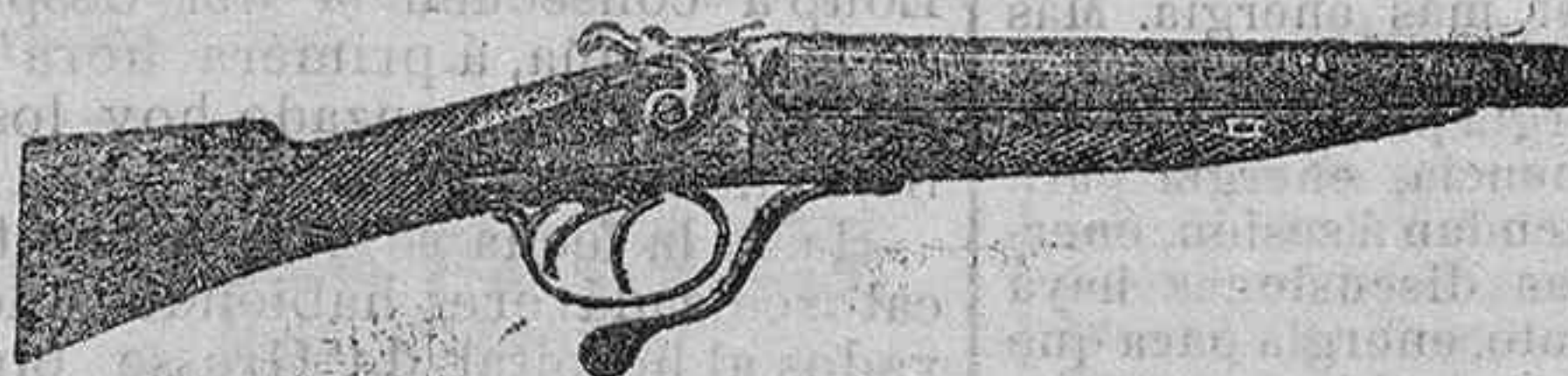
Modelo de escopeta de fuego central dos cañones á pesetas 45 y 50

Gran surtido en armas de todas clases Accesorios para cazar