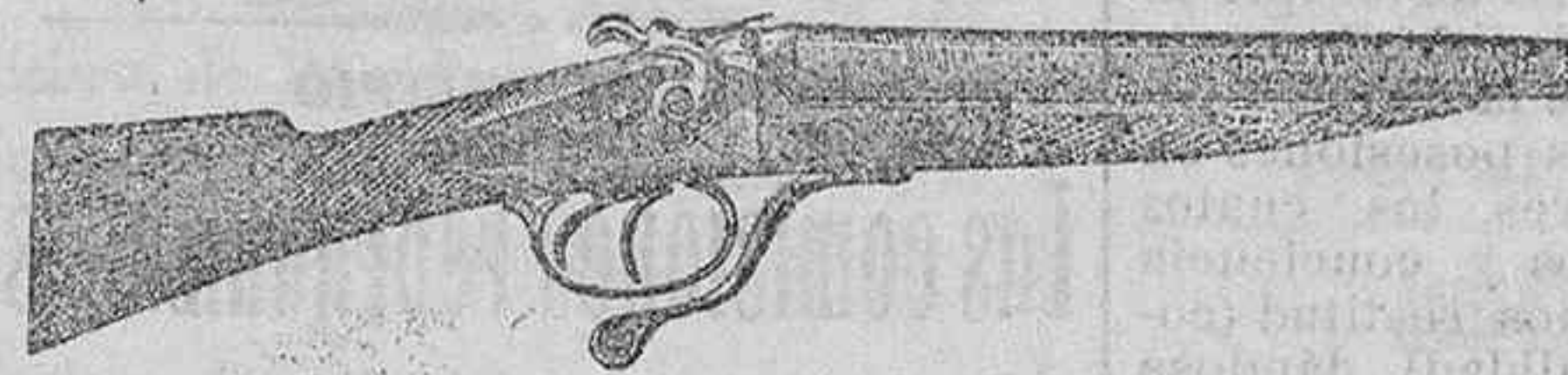
Modelo de escopeta de fuego central dos cañones á pesetas 45 y 50