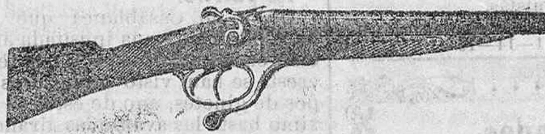
Modelo de escopeta de fuego central dos cañones á pesetas 45 y 50

Gran surtido en armas de todas clases Accesorios para cazar