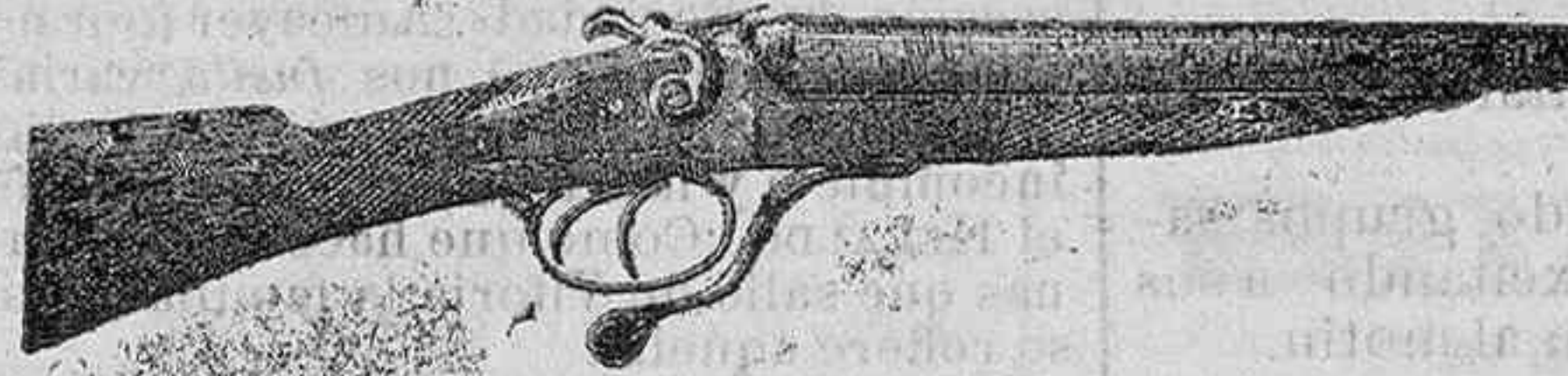
Modelo de escopeta de fuego central dos cañones, á pesetas 45 y 50