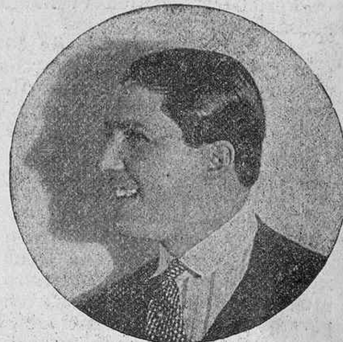
Notable cantador del tango argentino, que debuta hoy en el Teatro Príncipe.