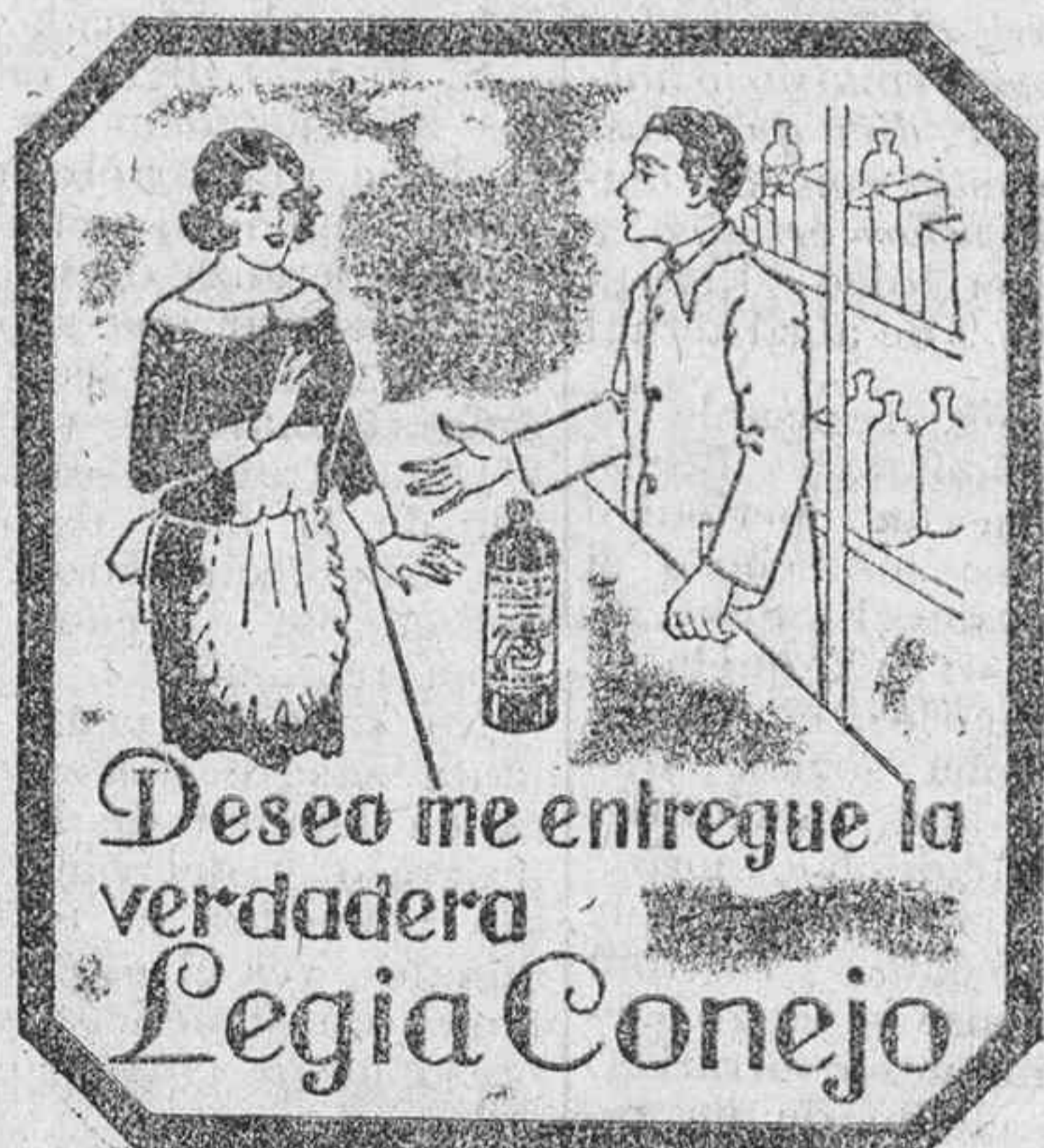
Deseo me entregue la verdadera Legia Conejo