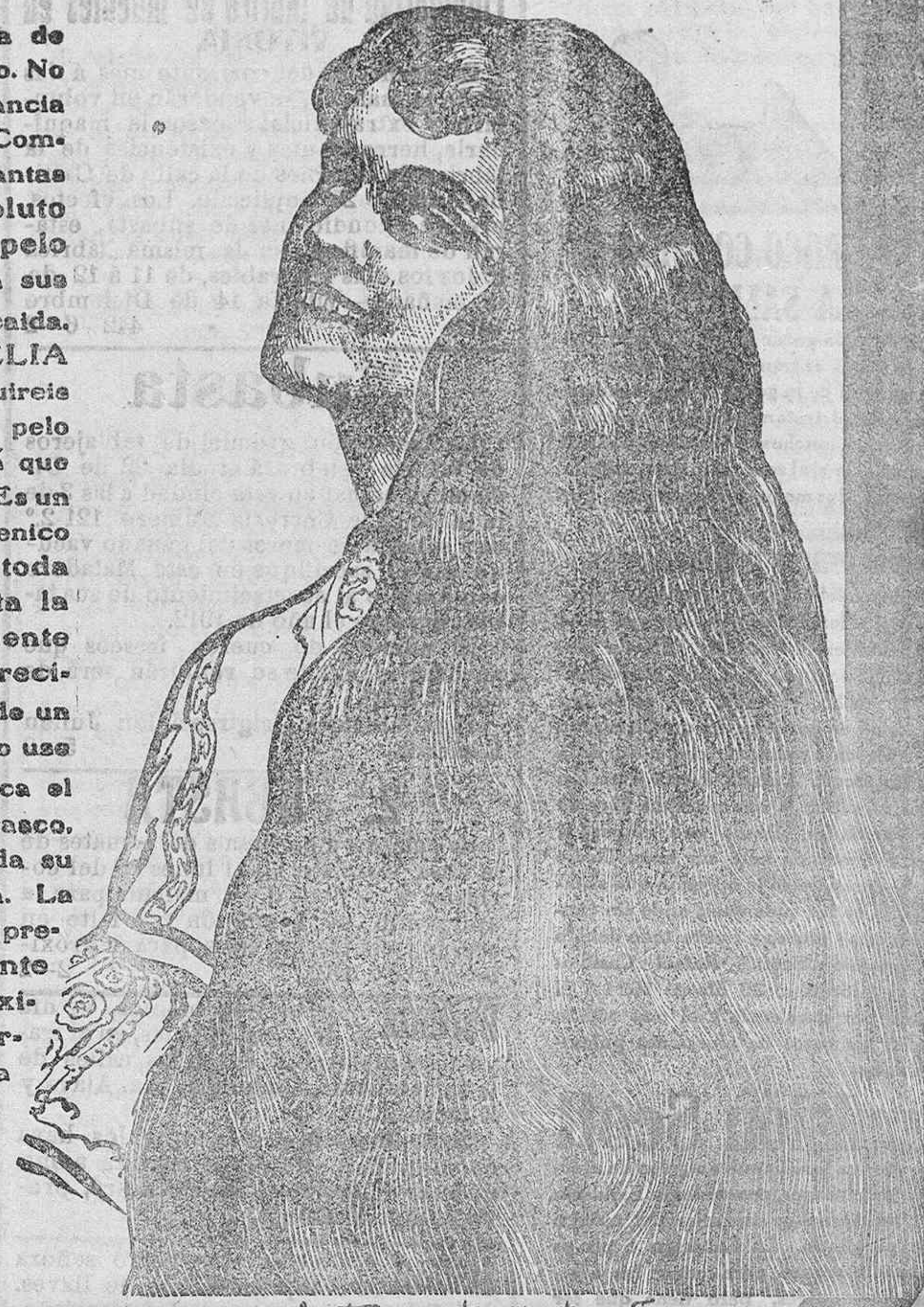
Ch. F. Paquet, Montevideo, France

Es la preparación más sana de Tocador para fortalecer el pelo. No contiene ningún tóxico ni sustancia química que pueda dañar. Compuesta exclusivamente de plantas aromáticas, impide en absoluto que el germen ataque al pelo y por lo tanto que destruya sus raíces, causa principal de la caída. Si usas la LOCION VITTELIA a diario no solamente conseguirás una cabeza limpia, sino de pelo rico y abundante, sin temor a que jamás se debilite ni se caiga. Es un tónico tan excelente e higiénico que preserva el pelo de toda clase de impurezas, quita la caspa y vigoriza fuertemente las raíces, promueve su crecimiento y puede asegurarse de un modo terminante que quien lo usa a diario en la forma que indica el prospecto que acompaña al frasco, conseguirá tener durante toda su vida una radiante cabellera. La LOCION VITTELIA, es preparación de tocador puramente vegetal e inofensiva, de efectos maravillosos, de perfume delicado, que nunca debe faltar en las familias y en la Toilete diaria. La LOCION VITTELIA, es para el pelo lo que el sol para las plantas.