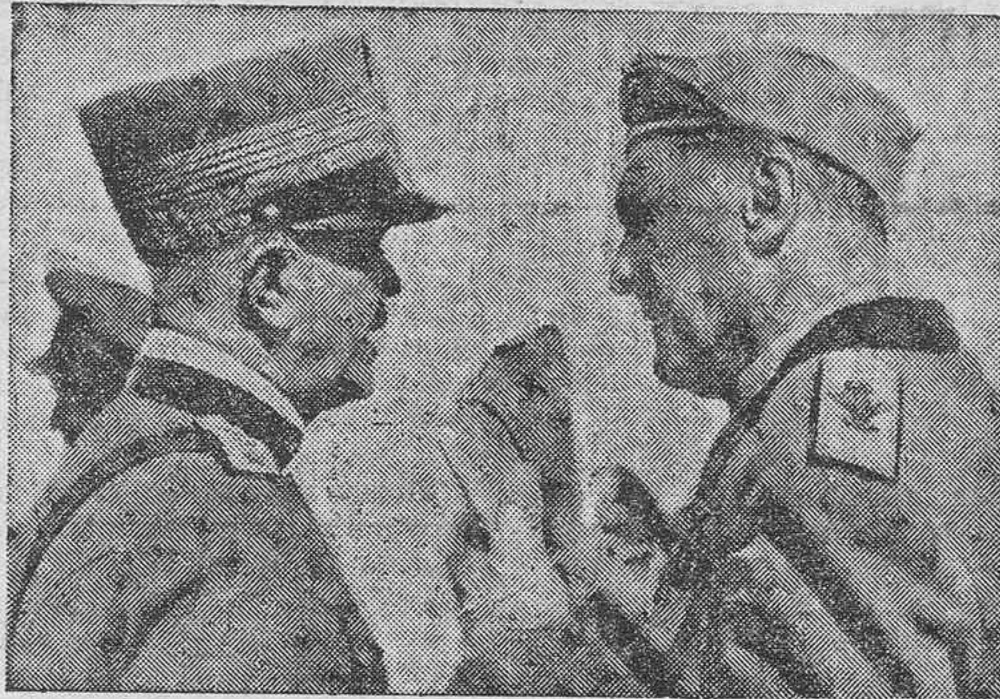
LOS GENERALES GRAZIANI Y BADOGLIO

Según han anunciado estos días los telegramas, el general Graziani se ha encargado de la regencia de Etiopía, en sustitución del mariscal Badoglio, que ha marchado a Italia a bordo del buque hospital "Arborea". En los centros bien informados de Roma se cree que el mariscal Badoglio no volverá a Etiopía, probablemente, porque Mussolini estima que su presencia en Italia es importantísima, en vista de la situación europea. Según el "Giornale d'Italia", el viaje de Badoglio a Roma obedece únicamente al deseo de disfrutar una licencia para descansar algún tiempo.