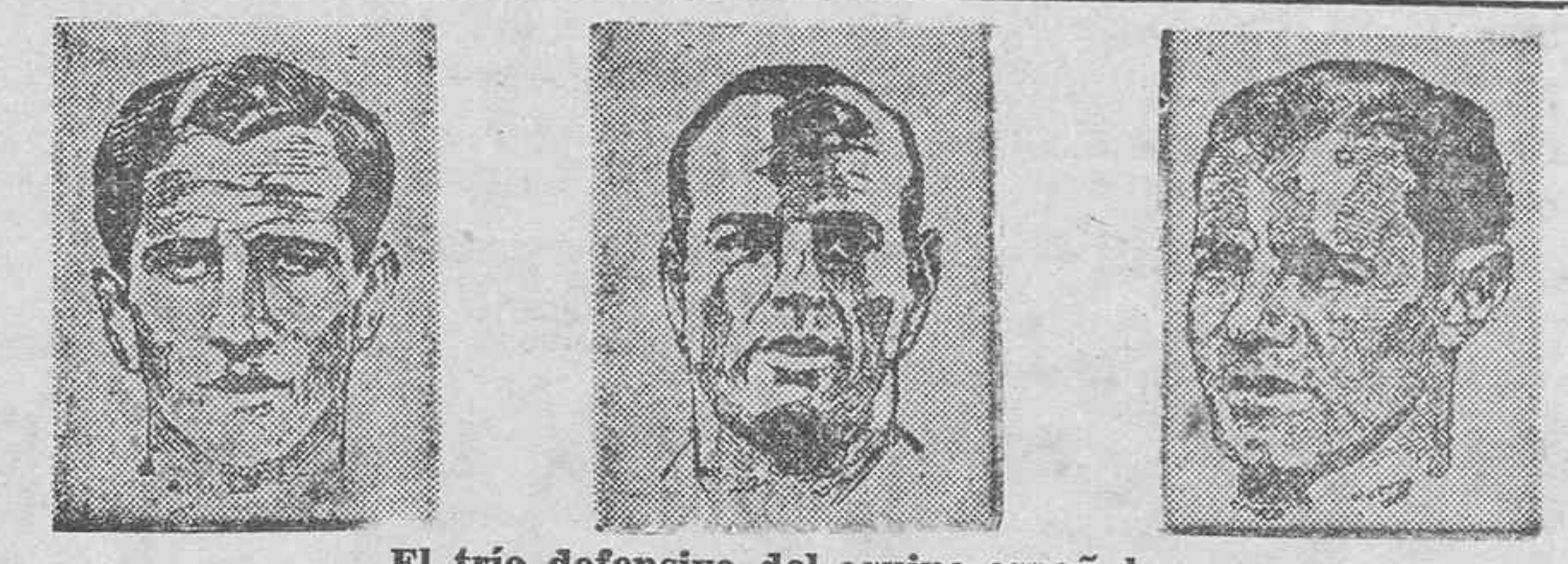
El trío defensivo del equipo español.

BARCELONA, 22.—Varios periodistas deportivos estuvieron ayer en Bellaterra, pueblo cercano a Barcelona