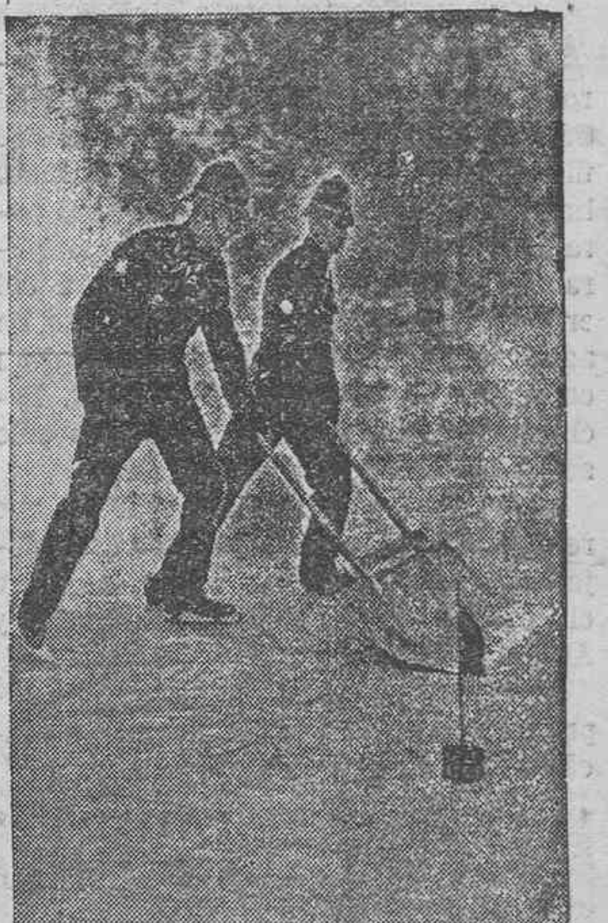
Dos agentes de Policía inglesa, provistos de patines, quitando la nieve de la pista donde se verifican las grandes competiciones internacionales de patinaje.