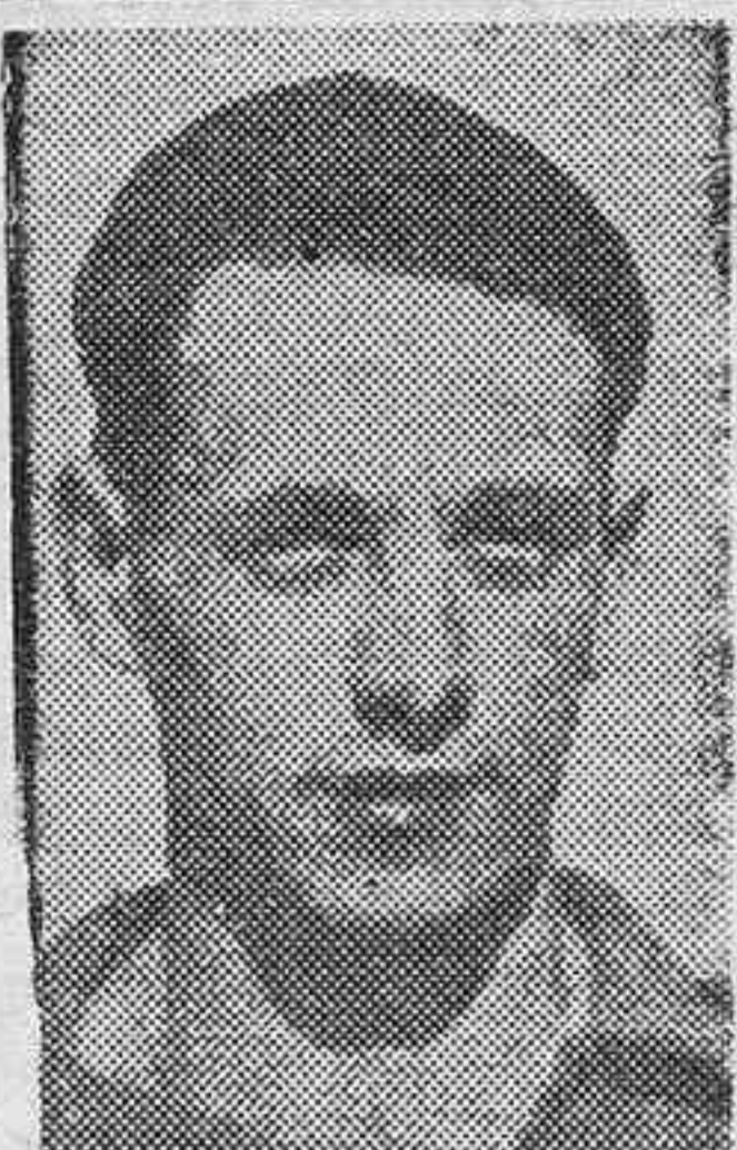
Beltorini, el notable medio derecho del equipo nacional de Italia.

Como anunciamos en nuestra edición de ayer, la Federación de Las Palmas ha solicitado de la de Tenerife que el partido de selecciones que se debía jugar el domingo en el Stadium sea aplazado. La Federación Tinerfeña ha accedido."