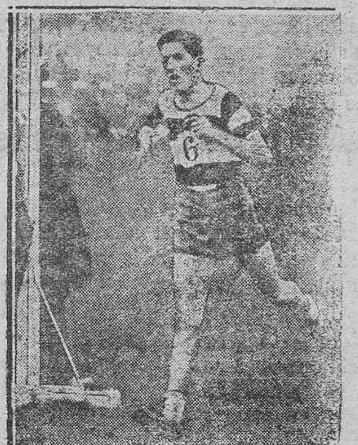
Dolgués, el famoso campeón de Europa, que ha obtenido el primer premio en el egrand cross-country national