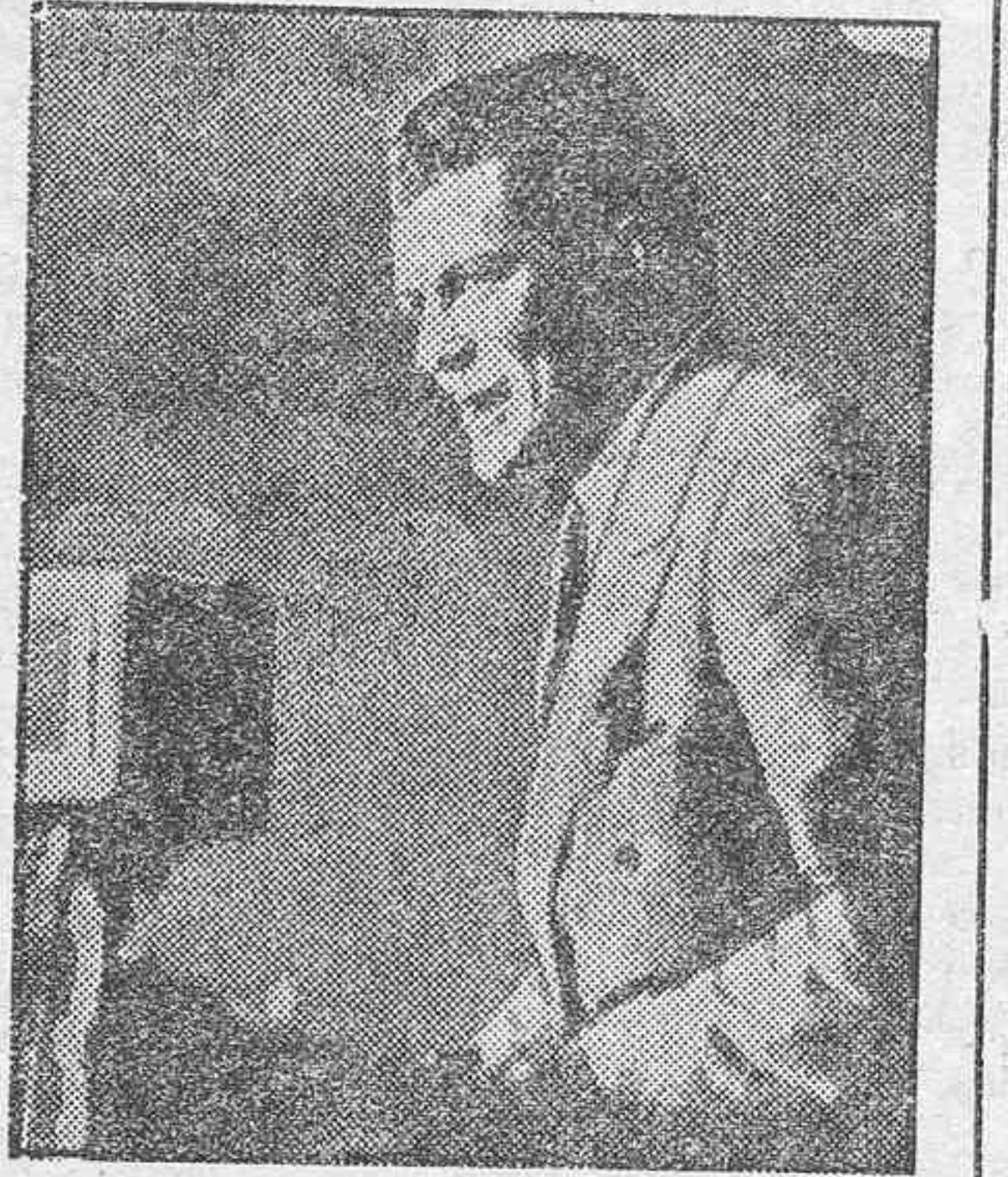
Gene Tunney, el ex-campeón mundial de boxeo, que ahora se ha dedicado por entero a la política. Forma parte del Senado norteamericano, en las filas de Roosevelt.

Este es el principio de una intensa campaña que se proponen hacer nuestros pugiles para desenterrar dormidas aficiones. De boxeo, naturalmente. Que el éxito les acompañe.