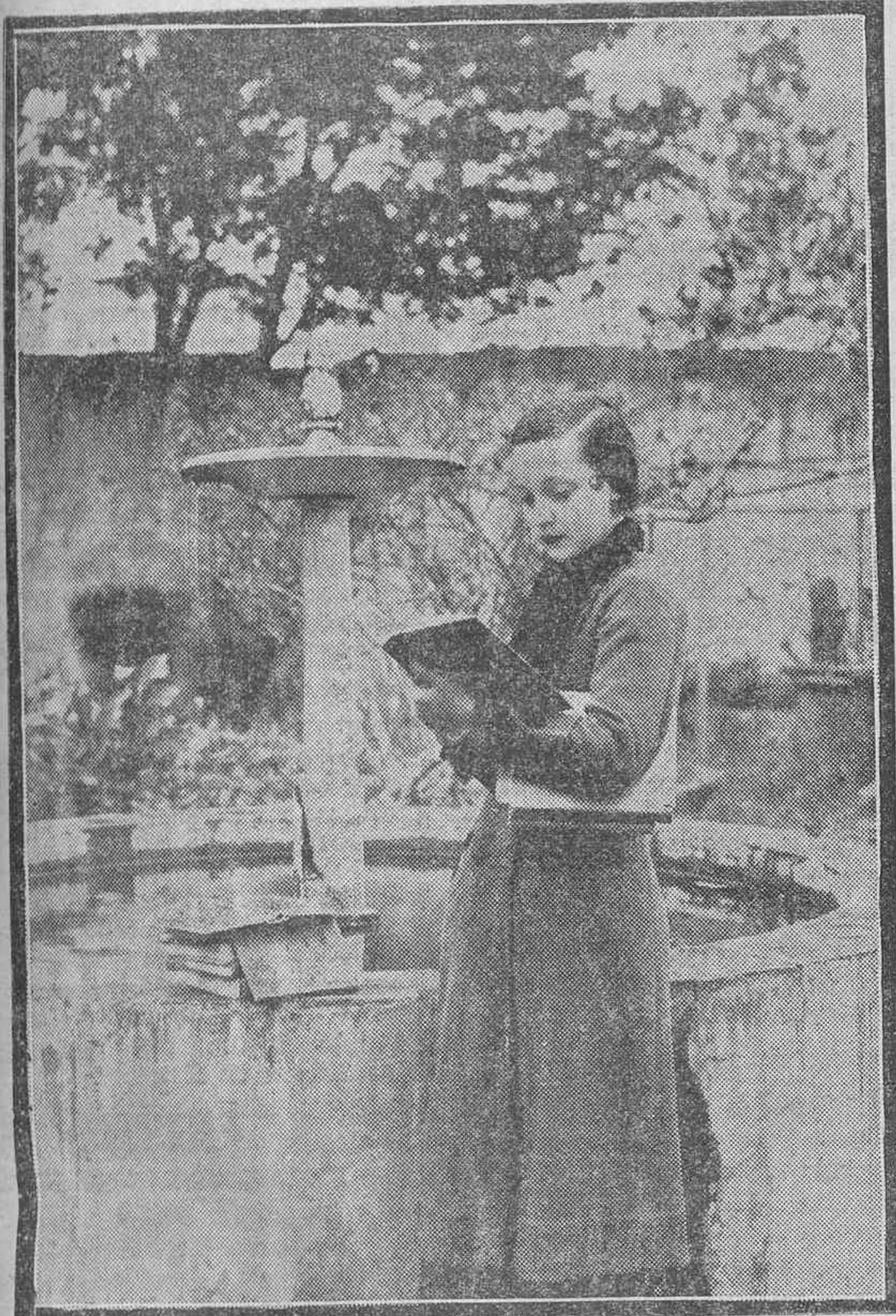
Va a empezar la clase. Y esta futura maestra aprovecha los últimos minutos para dar el último repaso a la lección....

Un poco de historia.—La matrícula.—La obra docente fuera de las aulas.—Defectos del viejo sistema.—El aspecto isleño.—Las predilecciones de los alumnos.—La cifra terrible de los suspensos.—Las necesidades de la Escuela Normal.—El emplazamiento.—La vida precaria.—Ideas para mejorar el desenvolvimiento escolar.—Nota final: Visión de conjunto del problema.