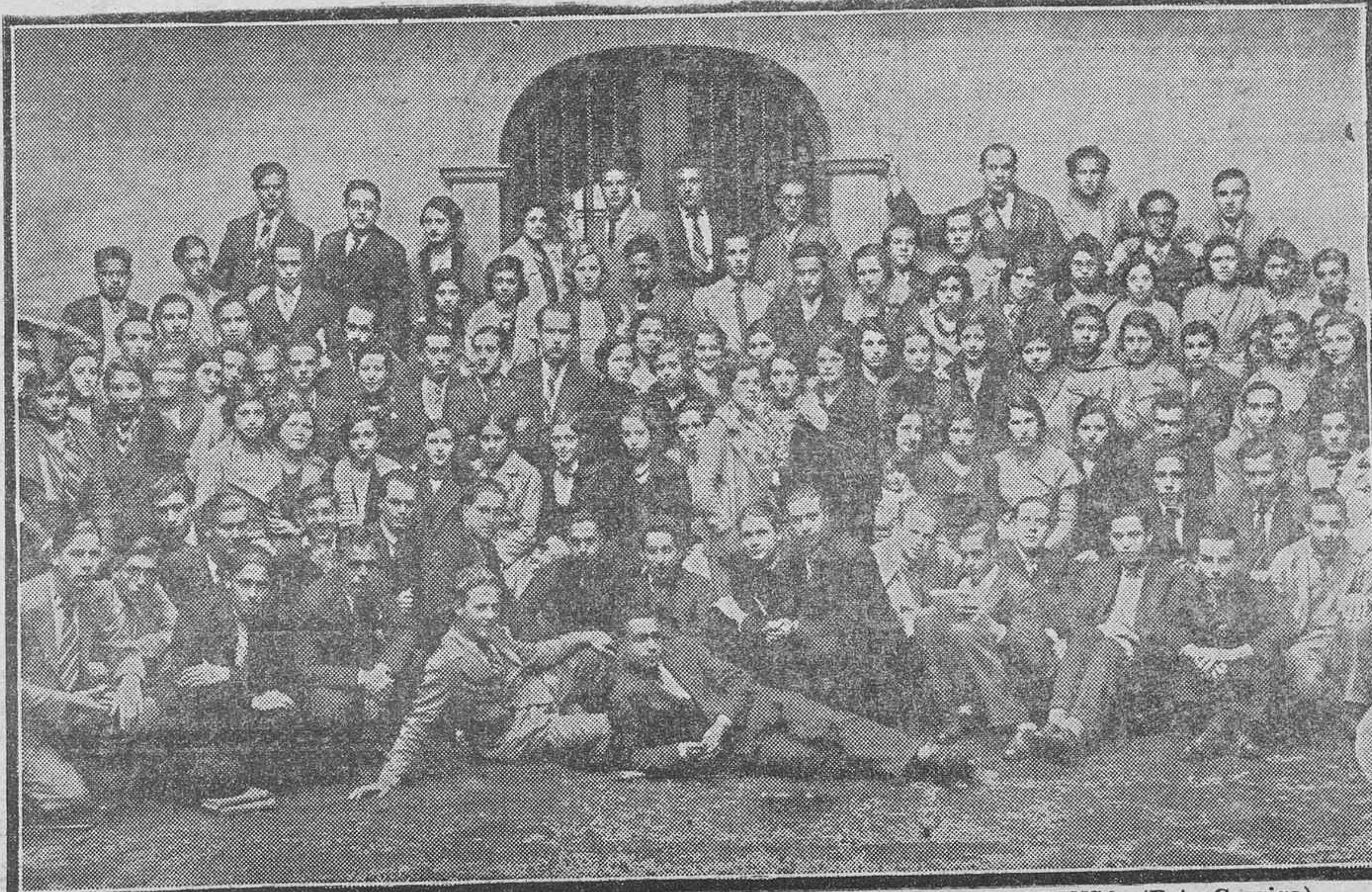
Los alumnos normalistas se reúnen en el patio para esta fotografía de LA PRENSA. (Foto Garriga).