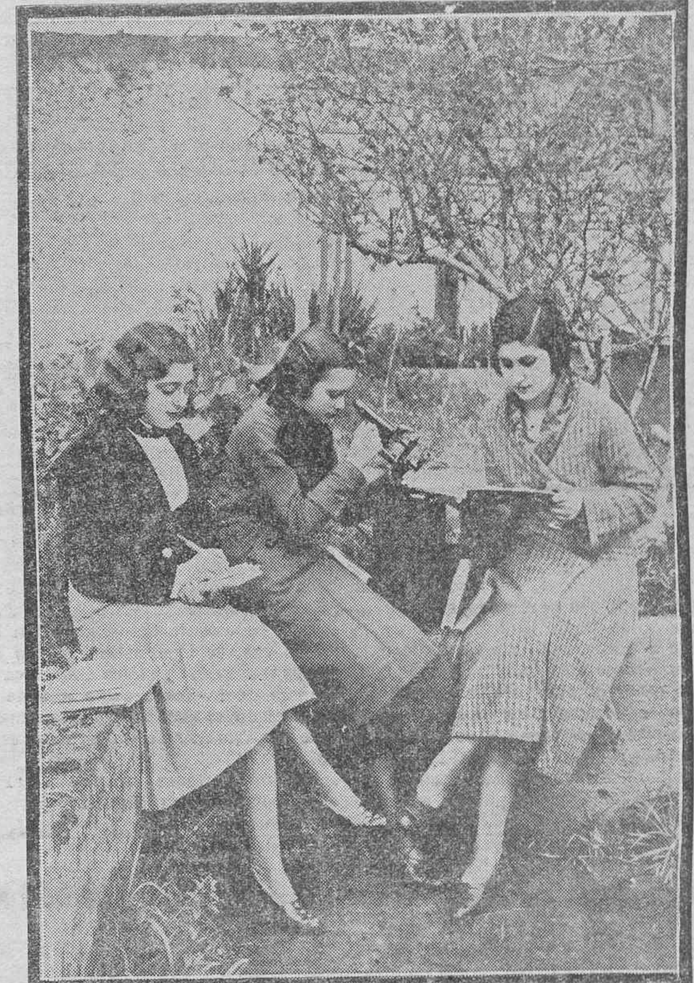
Las tres compañeras se han reunido amigablemente, para trabajar. Estudia la una; otra resuelve un problema. Y la de enmedio, con el microscopio, está dedicada a la investigación. Para lograr un puesto en el porvenir, se necesita trabajar mucho.

habrá una fórmula que solucione las dificultades.