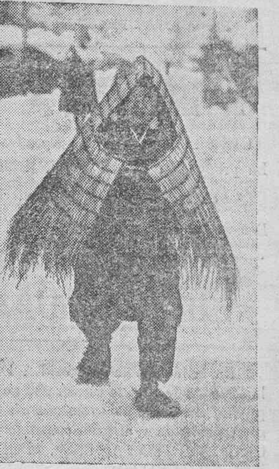
En el Japón, los vecinos de los poblados de clima riguroso han ideado estas cubiertas para protegerse de la lluvia y de la nieve. Con arpillera, también, refuerzan sus zapatos.