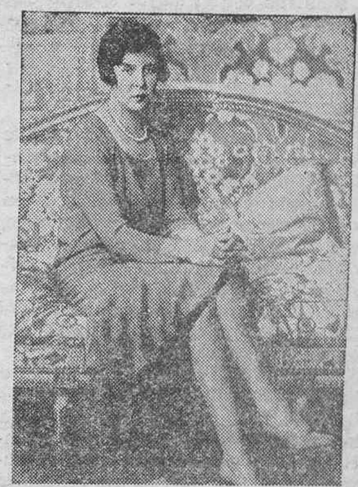
La princesa heredera de Mónaco que ha perdido todos sus derechos de sucesión al trono. La princesa prefiere casarse en breve con un conocido abogado y ante el amor renuncia a sus privilegios.