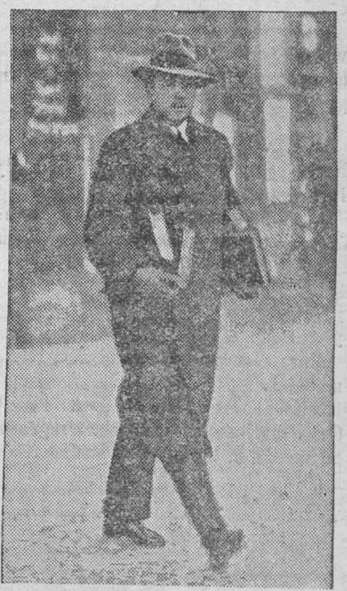
El archiduque Otto, heredero de la derrumbada corona de Austria, se encuentra en Berlín terminando sus estudios en la Universidad.