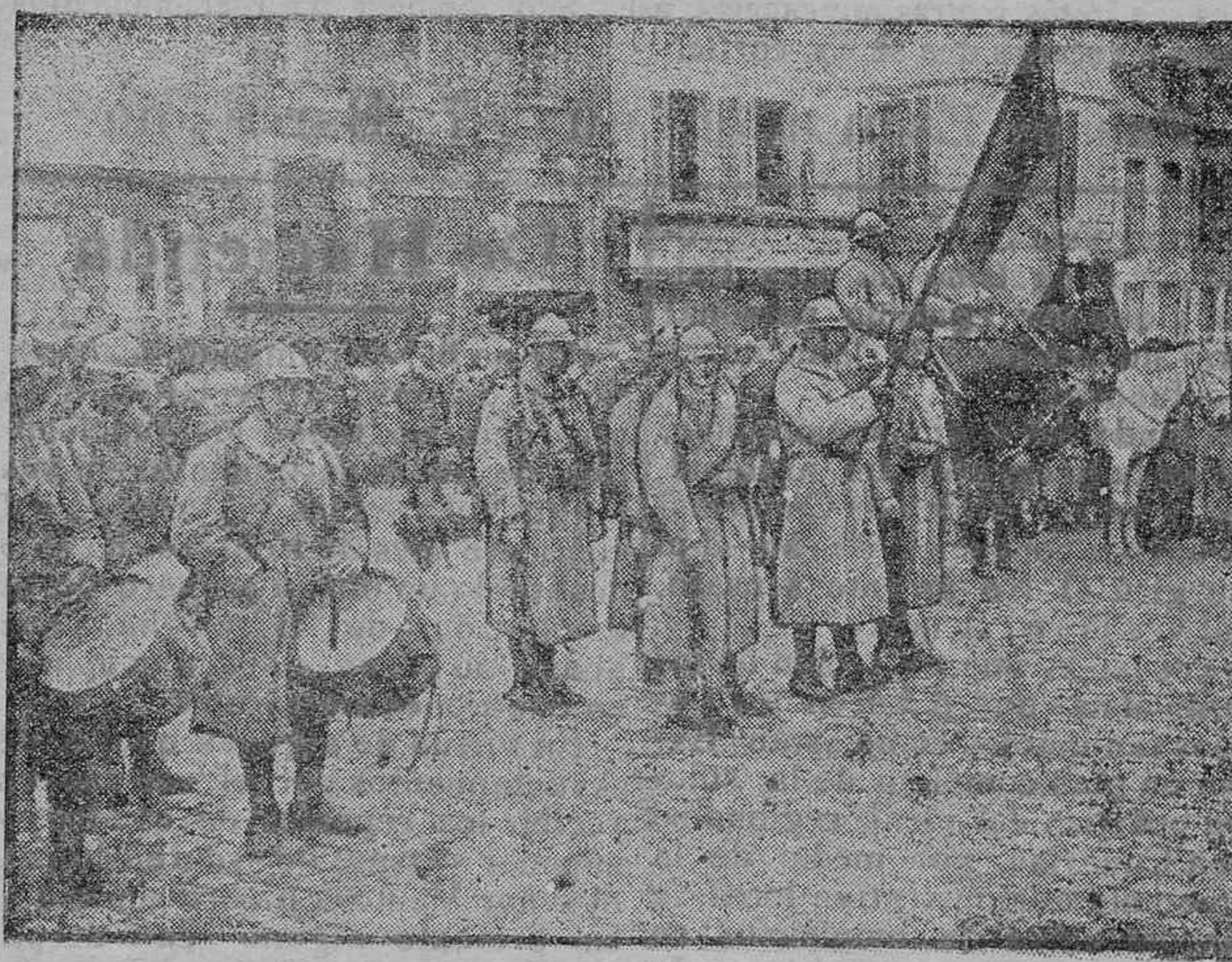
ESPERANDO AL GENERAL EN JEFE

SE VENDE una motocicleta inglesa con coche lateral.—Darán razón en esta imprenta.