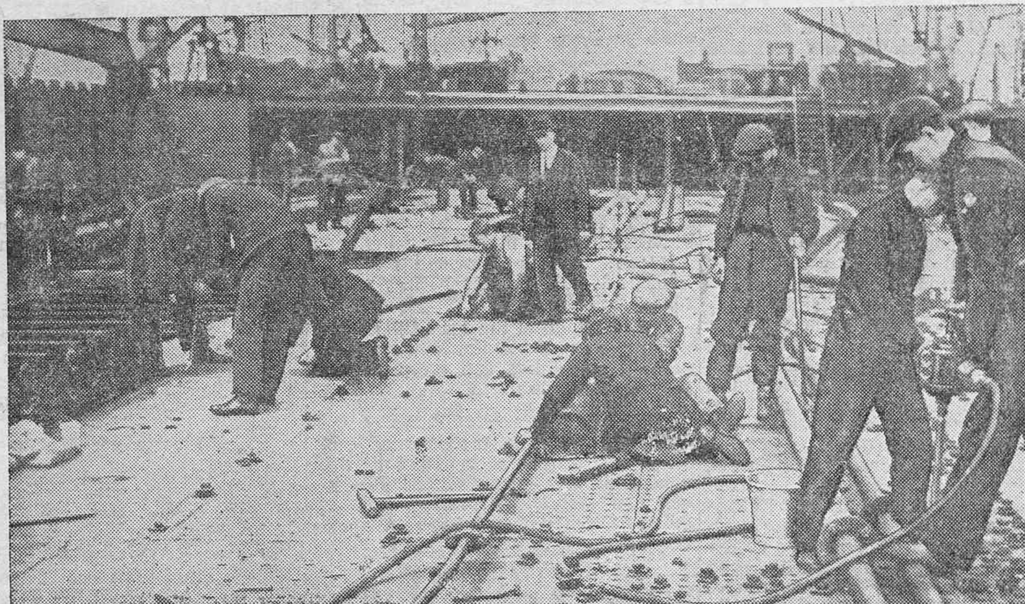
Las construcciones navales han adquirido, últimamente en Inglaterra un acelerado ritmo. Véase un detalle de los trabajos en los astilleros de Clydebank, donde se están construyendo trasatlánticos hasta de 75.000 toneladas.