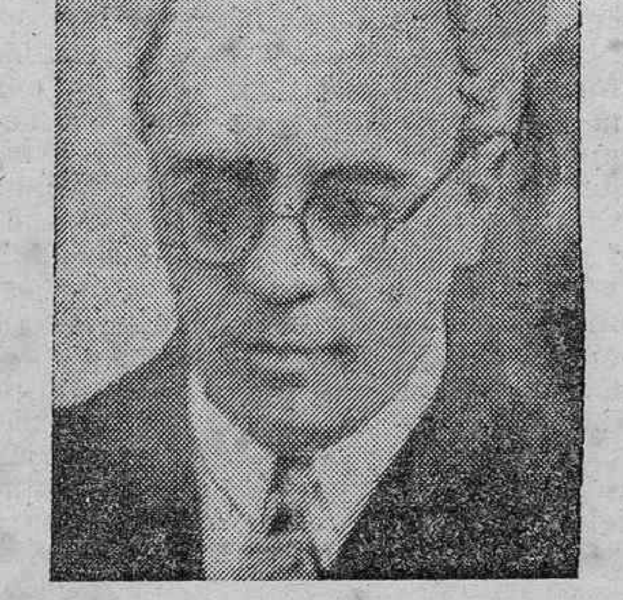
El señor Sarraut, ministro del Interior, que ha regresado a París, reuniendo inmediatamente a los jefes de departamentos y prefectos de Policía para adoptar medidas relacionadas con la próxima huelga general.

dores del movimiento han aprovechado los decretos para organizar una campaña de fuerza contra el acuerdo franco-alemán.