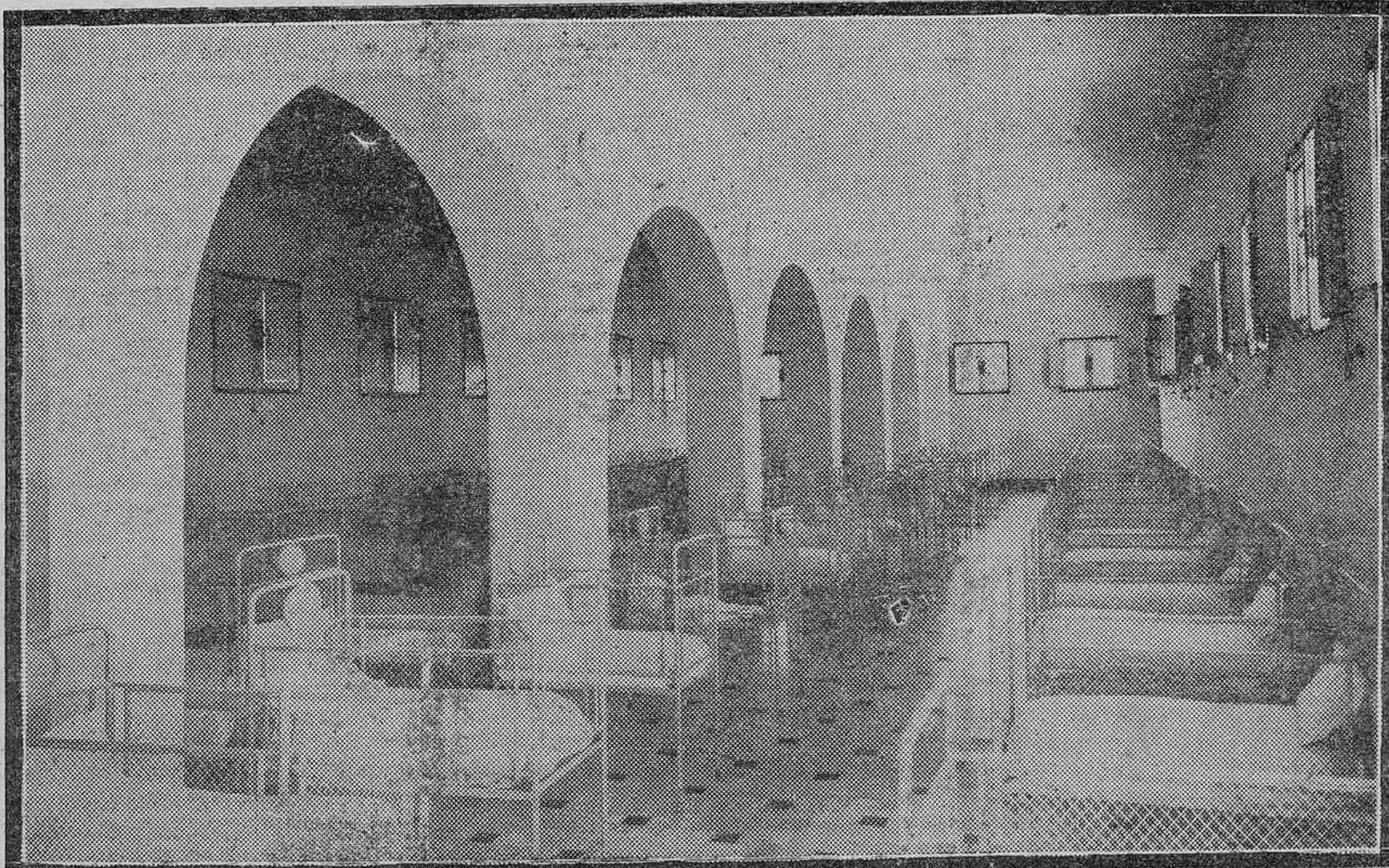
ASPECTO DE UNO DE LOS DORMITORIOS PARA NIÑOS.

afanes, dan ganas de gritar a los obreros que alzan y blanquean los muros prometedores: