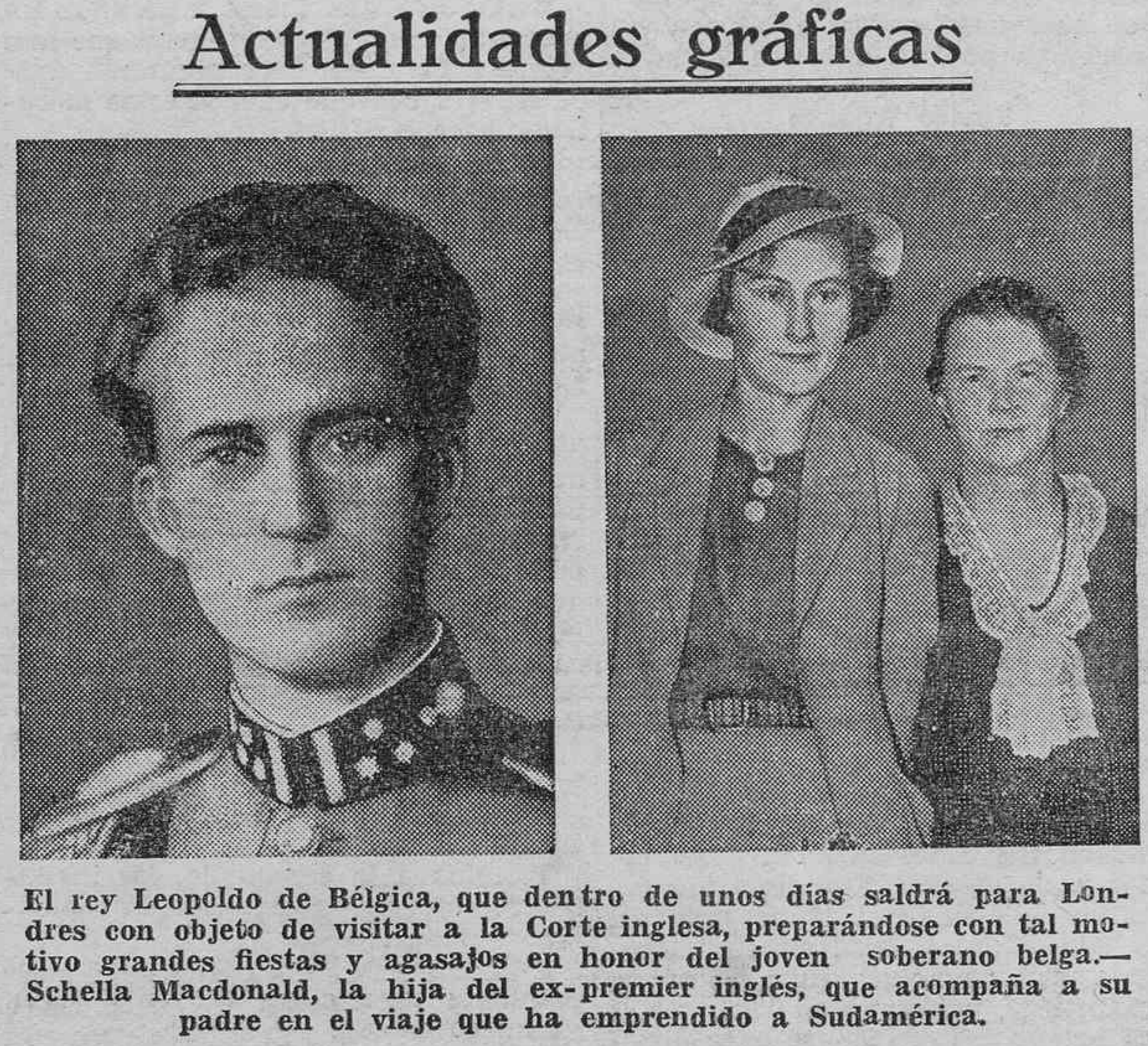
El rey Leopoldo de Bélgica, que dentro de unos días saldrá para Londres con objeto de visitar a la Corte inglesa, preparándose con tal motivo grandes fiestas y agasajos en honor del joven soberano belga.—Schella Macdonald, la hija del ex-premier inglés, que acompaña a su padre en el viaje que ha emprendido a Sudamérica.

Versos del día LA EXPOSICION DE LA CAZA, EN BERLIN : En Berlín se ha inaugurado, junto a una moderna plaza, una Gran Exposición Internacional de Caza. Frente al salón del certamen, según la radio, figura un bello ciervo dorado, de siete metros de altura. Se admira allí las policromas banderas enarboladas, de las treinta y dos naciones que allí están representadas. Se exhiben en el salón, más bonitos o más feos, muchos útiles de caza, vestuarios, armas, trofeos. Mil objetos diferentes pueden admirarse allí para la caza del ciervo, la liebre o el jabalí. Yo tengo un dilecto amigo que adora la cacería, pero que en ella fracasa por su mala puntería. A esa Exposición de Caza él iría con fruición... ¡Salir de caza con él sí que es una exposición! NIJOTA