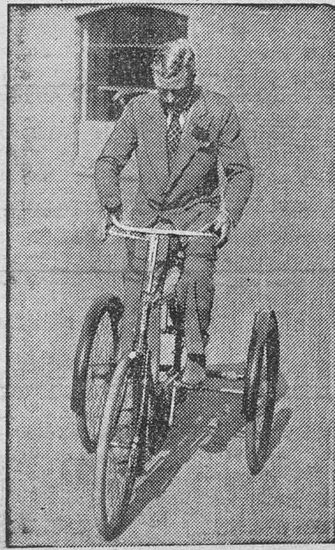
El ex-rey Eduardo VIII, hoy señor de Windsor, entregado a sus aficiones deportivas.—La princesa Margarita Rosa, hija de los nuevos reyes de Inglaterra.—Basil Zaharoff, el conocido hombre de negocios que tan importante papel desempeñó durante la guerra europea, fallecido recientemente.