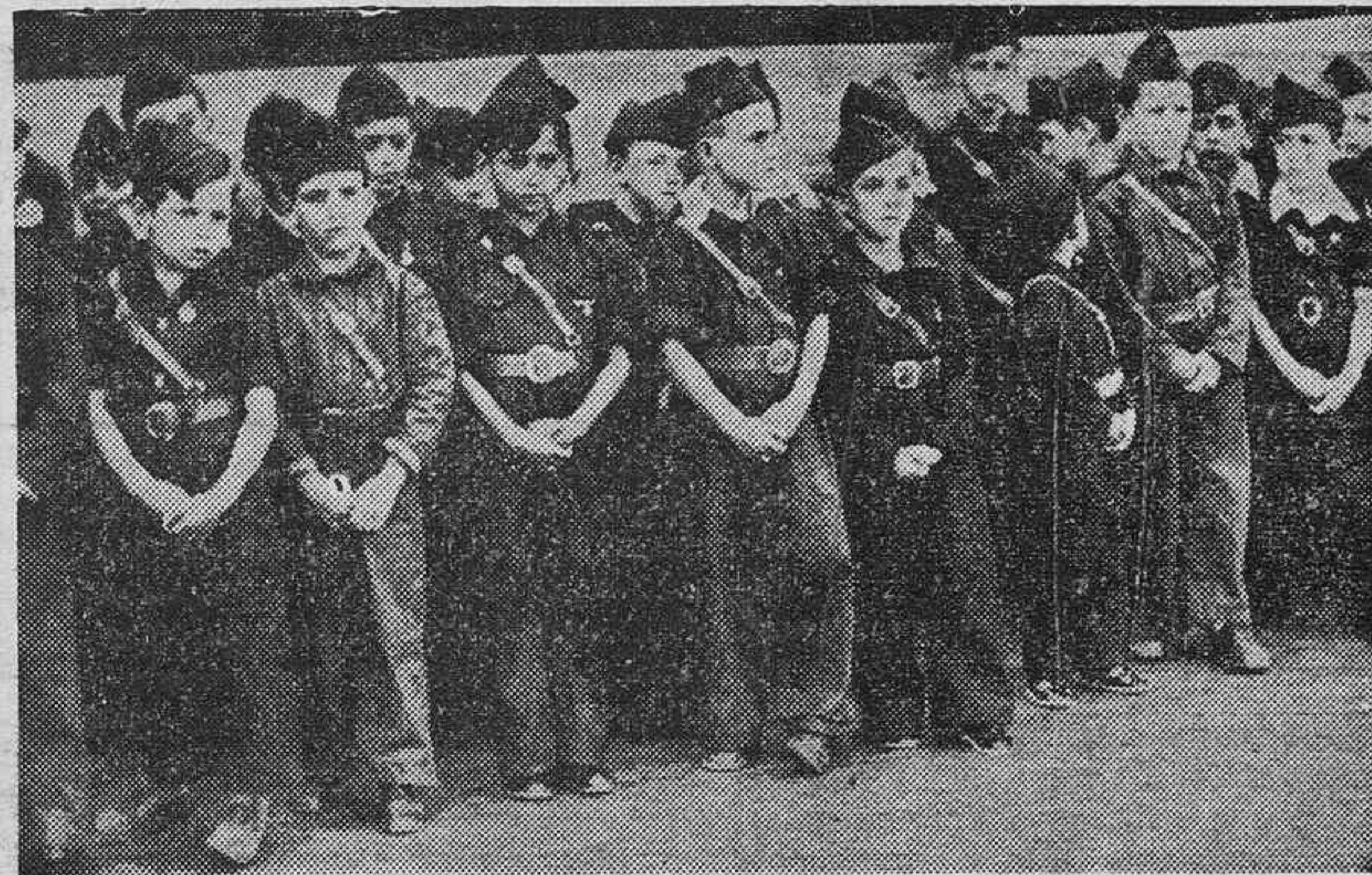
Un grupo de pequeños "ballilas" tenerifeños.

Reunida bajo presidencia Gobernador civil magna Asamblea con nutridas representaciones todas Corporaciones, entidades, sindicatos, asociaciones carácter económico agrícola comercial industrial y fuerzas vivas país, para tratar sobre crédito agrícola solicitado con arreglo proyecto confeccionado y remitido ese Centro por nuestro ilustre Comandante general este Archipiélago Excelentísimo señor don Angel Dolla Lahoz, dicha Asamblea, reconociendo la trascendental importancia y beneficios incalculables que aprobación dicho proyecto reportaría nuestra riqueza agrícola, que atraviesa momentos difíciles amenazando ruina inminente caso no obtenerse auxilio solicitado, por absoluta unanimidad acordó telegrafiar Vuecencia firmando todas representaciones asistentes aludida Asamblea recabando respetuosamente referida aprobación proyecto crédito única forma evitar perjuicios irreparables indicados. Propio tiempo acordó expresar vuecencia ver gran satisfacción acertadísima labor viene realizando en beneficio país Excelentísimo señor General Dolla, a quien visitó totalidad asistentes Asamblea para testimoniarle agradecimiento país comunicándole restantes acuerdos adoptados con ruego elevarlos superior aprobación. Saludándole respetuosamente."