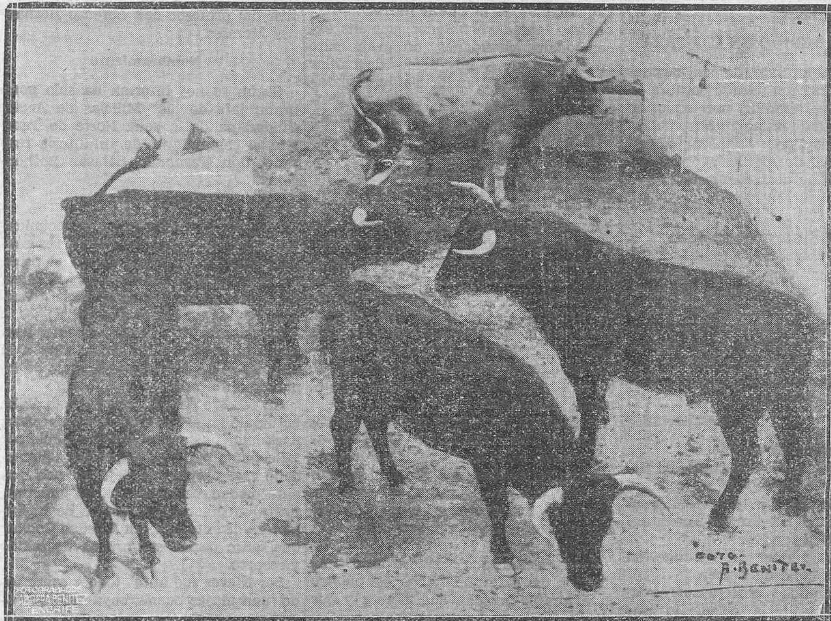
Los cinco magníficos novillos que se lidiarán mañana en la plaza de toros.

Hemos tenido oportunidad de hablar breves momentos con el organizador de la corrida que a beneficio del Ejército y Falange Española habrá de celebrarse el próximo domingo, día 22. Desde el primer día en que se le confió la organización de este espectáculo taurino tuvimos intención de hacerles algunas preguntas para conocer sus impresiones respecto al mismo.