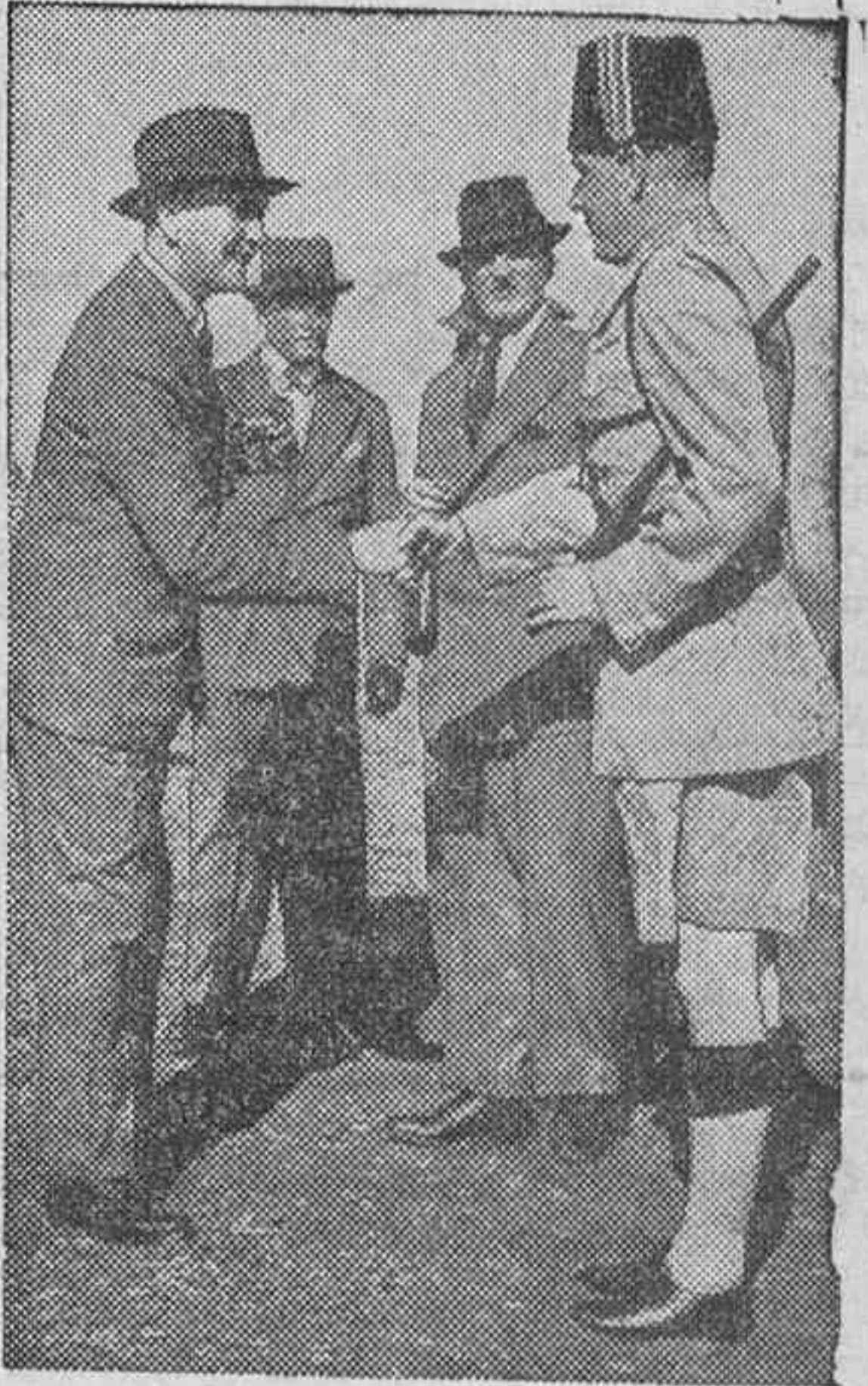
El general Dill, encargado del mando superior de las tropas inglesas en Palestina, a su llegada a Haifa, donde le recibe la policía.