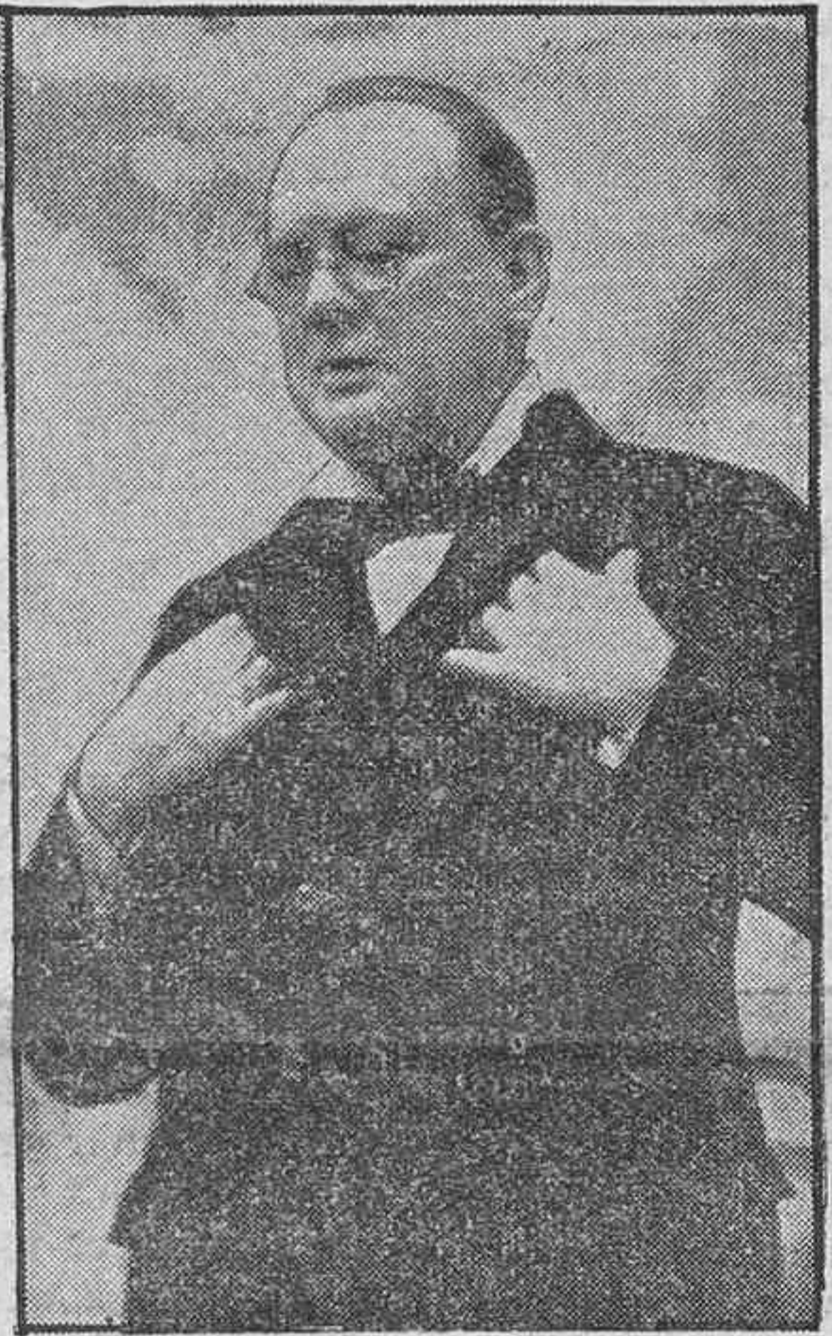
Mr. Winston Churchill