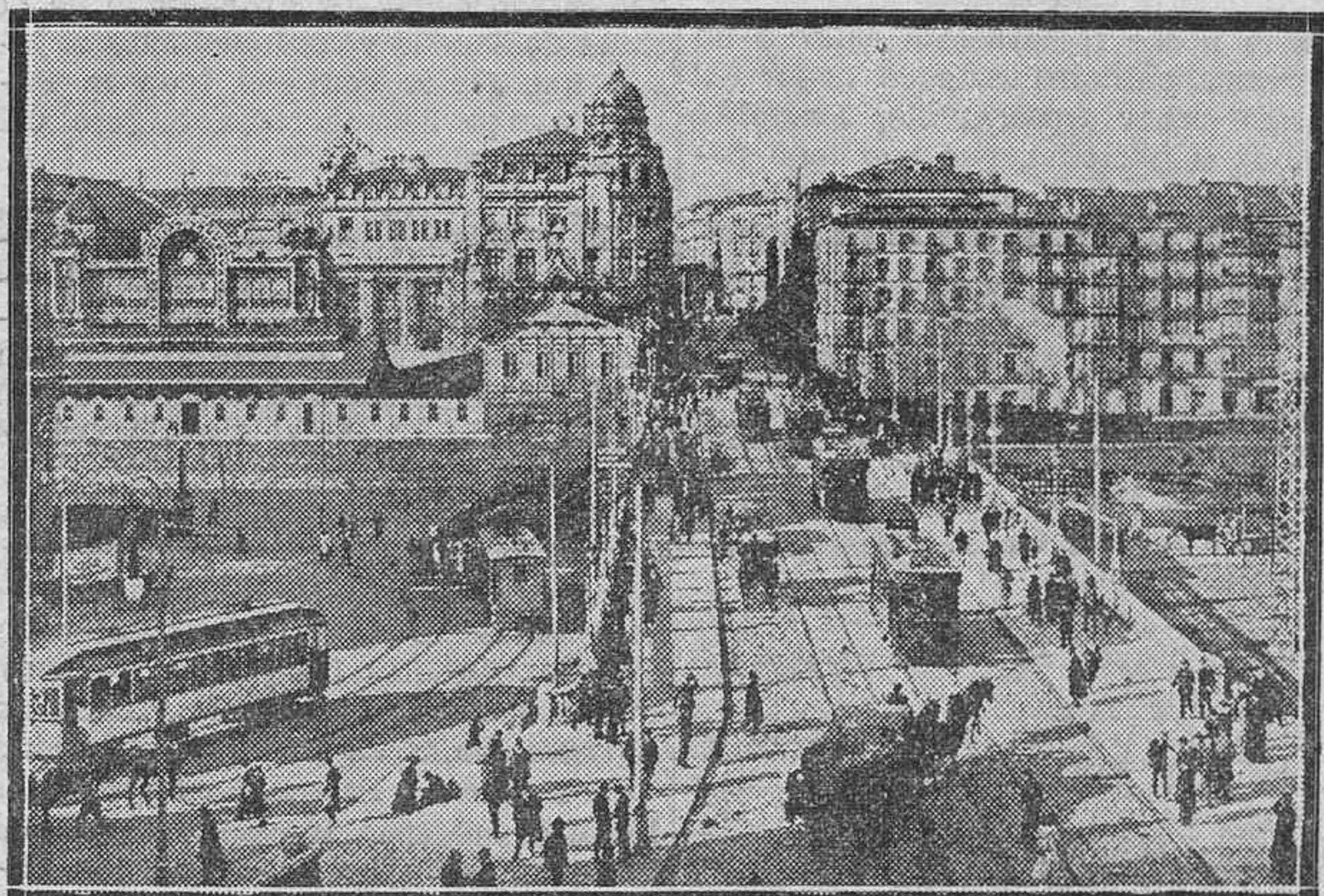
MADRID Y BILBAO.—Las dos poblaciones contra las cuales se dirige ahora, principalmente, la ofensiva del Ejército nacional.