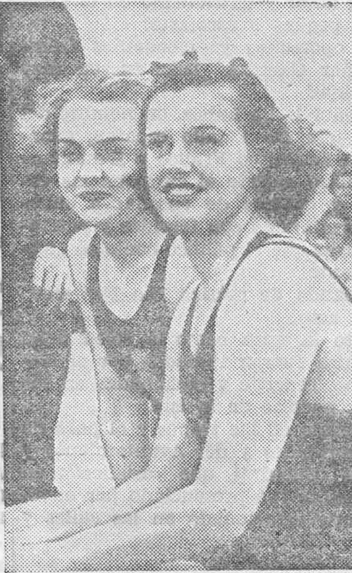
Las nadadoras norteamericanas Elishabeth Kompan y Eleanora Holm, destacadas campeonas de natación.