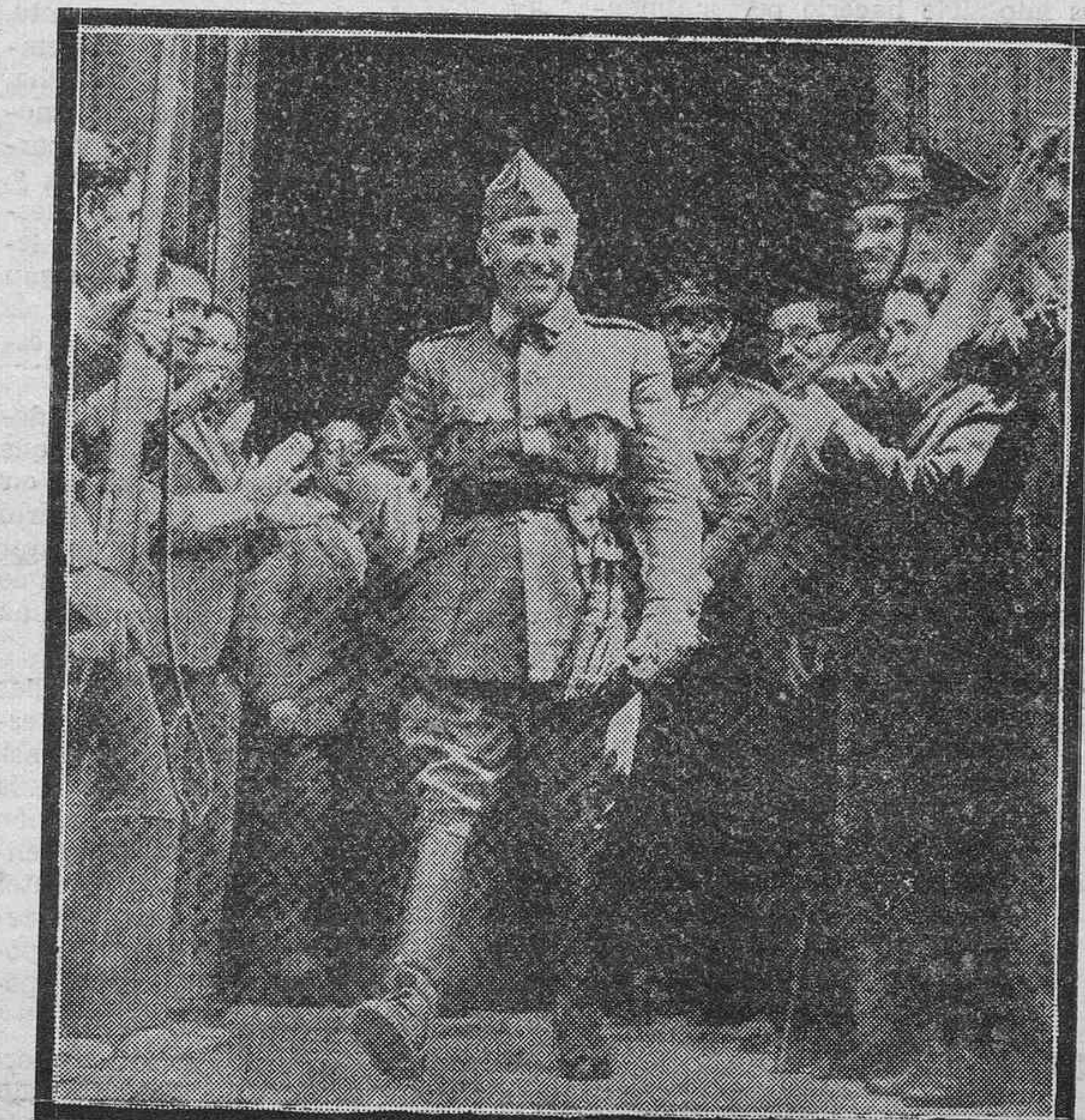
EL GENERAL FRANCO, AL QUE LA JUNTA NACIONAL DE BURGOS HIZO AYER ENTREGA, SOLEMNEMENTE, DE LOS ALTOS PODERES DEL ESTADO.

Artículo primero.—La práctica viene demostrando cuanta es la falta de un acto en el horario de las Plazas, Cuerpos igual o similar al tradicional de "Oración", a partir del cual terminaba el día militar, se implantaban los especiales servicios de noche y cesaban los honores por las guardias; toque de corneta o clarín que también tradicionalmente tenía encaje después o simultáneamente del de segunda comida de la tropa. En virtud de lo expuesto, ordeno que se restablezca en su tradicional significación y efectos el toque de Oración, cuya hora fijará como los de Diana y Retreta, la Plaza en todo tiempo, y a partir de cuyo toque, que será escuchado por la tropa en firmes y con absoluto silencio, se montarán los es-