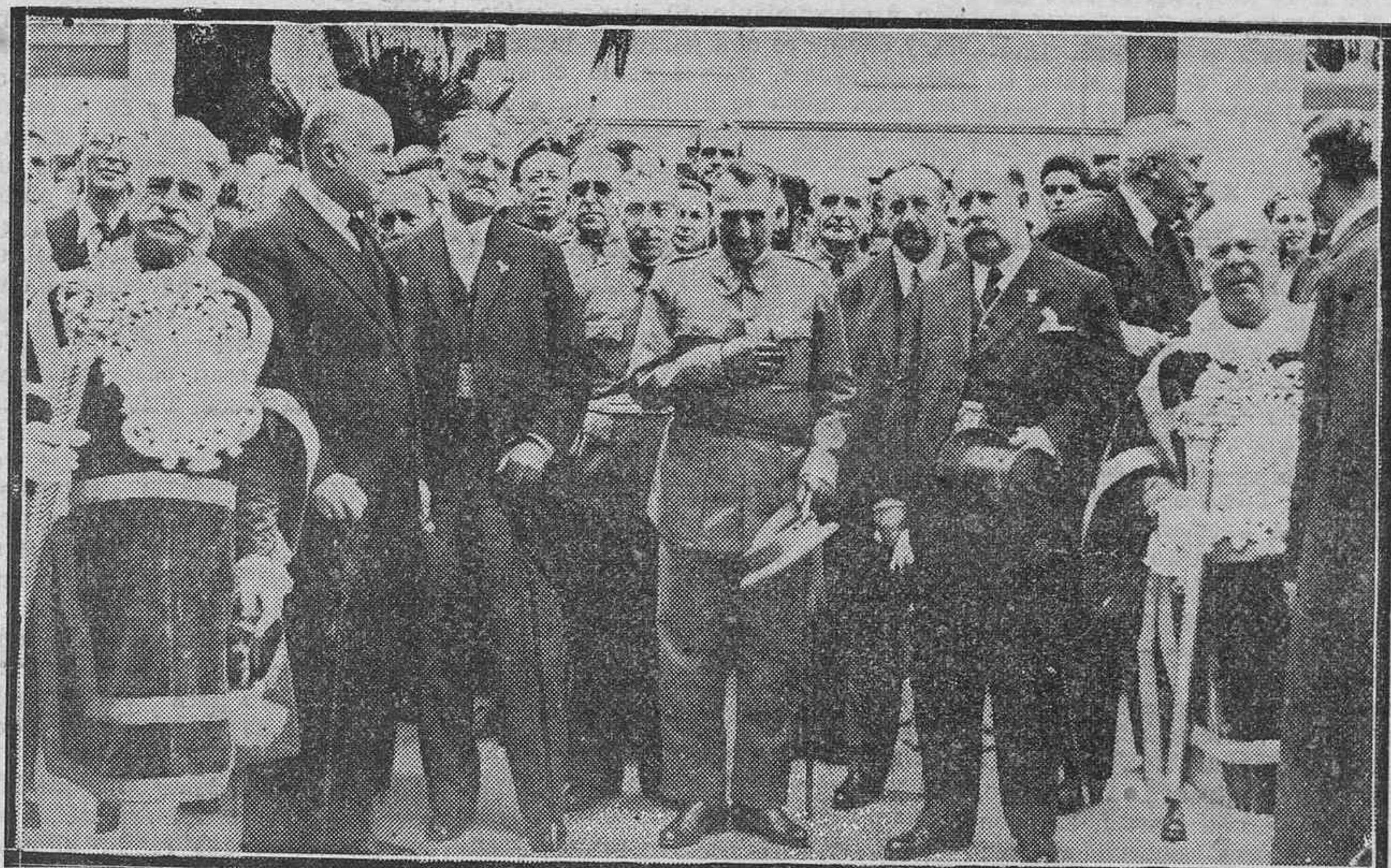
LA APERTURA DEL CURSO ESCOLAR.—El general Dolla con las primeras autoridades que asistieron al acto de ayer.

Situado frente a la bahía y habitaciones con ventilación directa. Pensión completa, desde 5 a 6 pesetas.