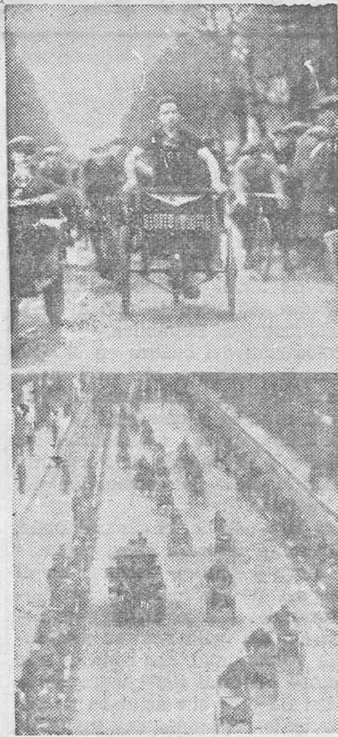
Dos detalles de una carrera de triciclos de reparto, celebrada en Paris, donde se efectúan con mucha frecuencia con gran cantidad de público.