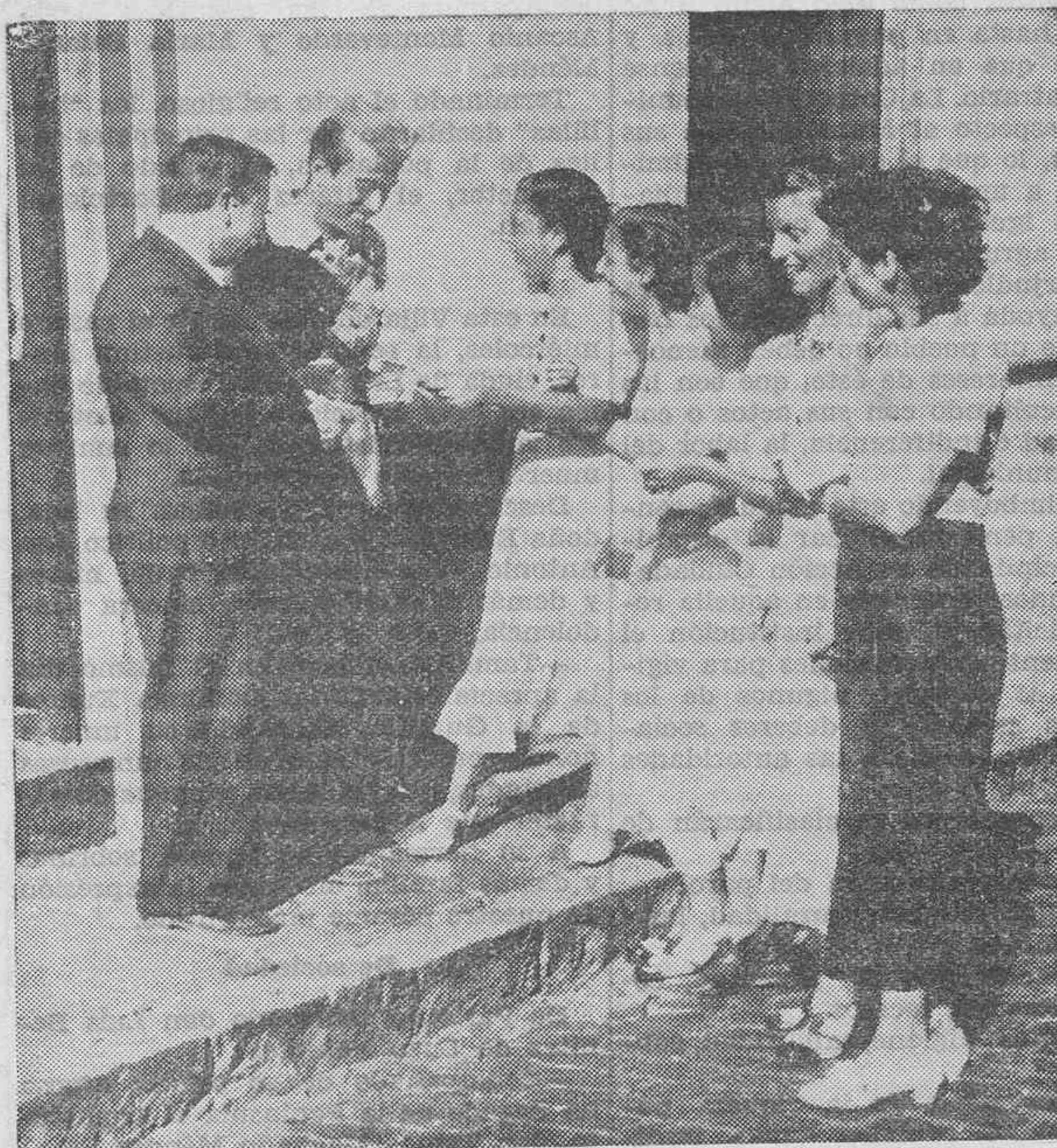
Grupos de risueñas señoritas recorren la ciudad con blocks de entradas en la mano. ¿Quiere usted una? Y aunque usted no sepa ni por dónde "cae" el Stadium... la compra. El elemento femenino, en superioridad numérica, sabe "atacar" eficazmente, acompañando a la acción encantadora sonrisas.—(Foto Benítez).

El Osasuna acepta el reto lanzado por el Pequeño Bilbao, para contender el próximo domingo, día 20, en el campo del Salamanca. Dicho partido empezará a las 9 y media. El Osasuna se alineará con todos sus titulares.