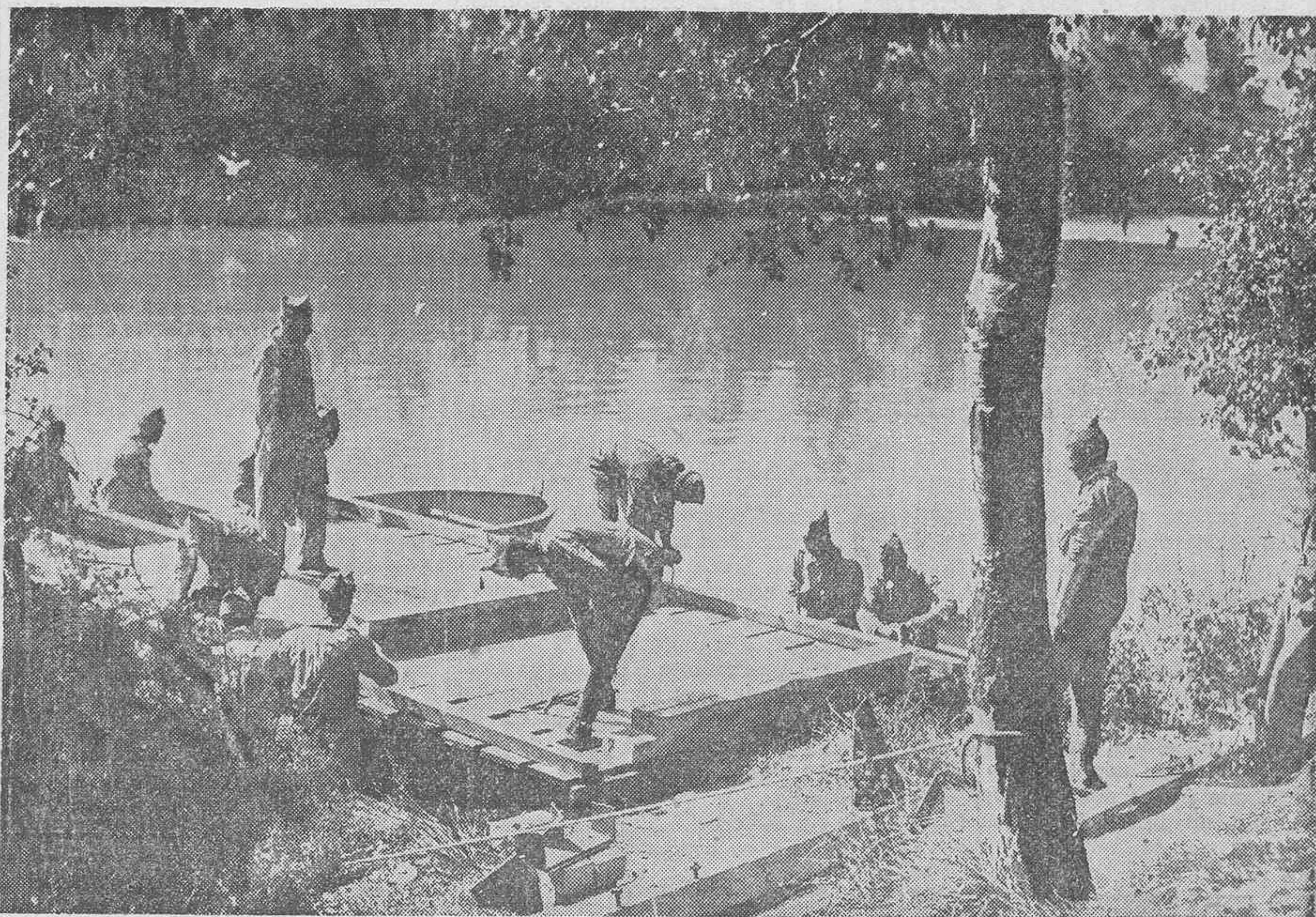
INGENIEROS MILITARES CONSTRUYENDO PUENTES PARA EL PAÑO DE UN RIO.

sabe adaptarse en cada momento y en cada país a las circunstancias.