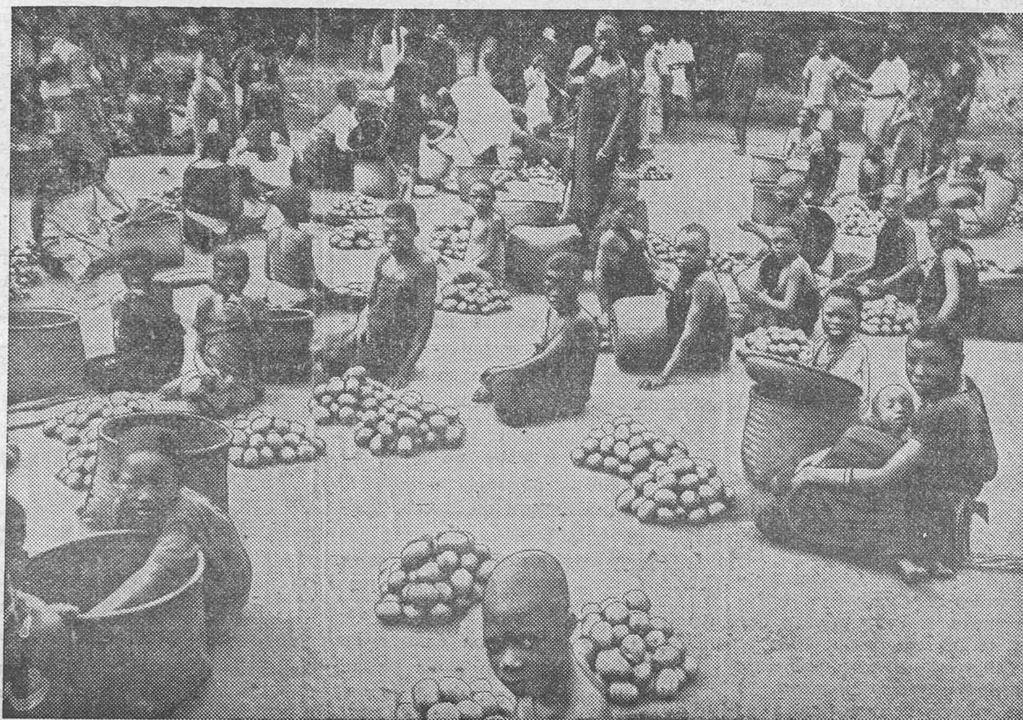
EN EL AFRICA CENTRAL.—Uno de los típicos "zocos" del poblado de Zambo, con sus curiosos puestos de frutas de la selva.