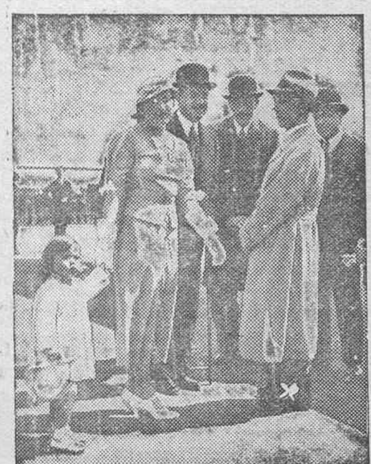
El ministro alemán, doctor Goebbels, (x), que ha celebrado en Venecia una importante entrevista con el jefe del Gobierno italiano.