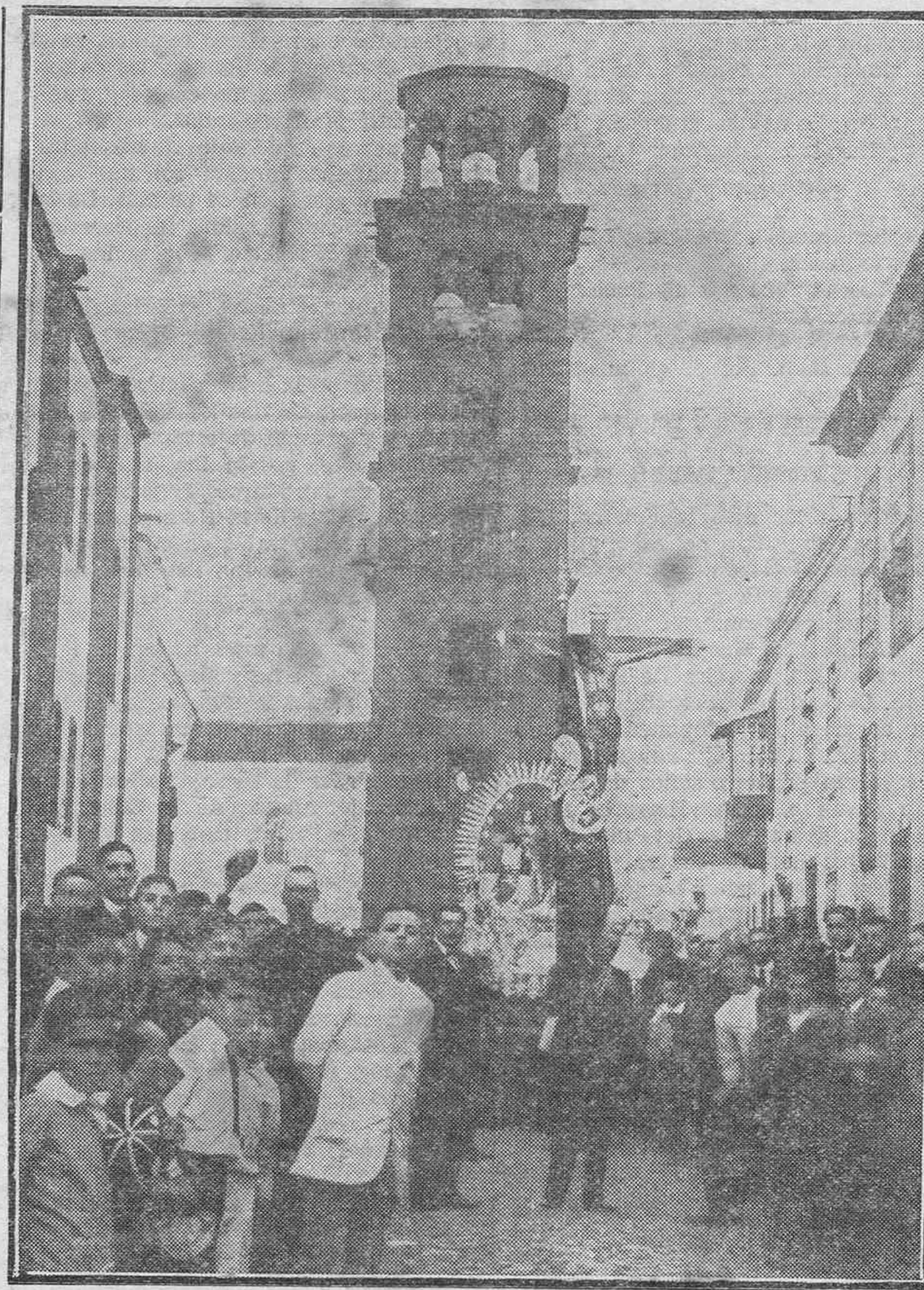
La famosa procesión de la madrugada del viernes

La procesión del martes a la tarde era la procesión de la aristocracia y del lujo. La "crema" de la ciudad derrochaba galas femeninas para el tradicional sermón de "Las lágrimas de San Pedro". No pocas lágrimas costó a más de una bella damita el retraso de la costurera en la terminación del historiado traje. Los tímidos pretendientes, colocados junto a las columnas del templo, contemplaban embobados a la muchacha de sus preferencias, que parecía otra, gracias a la vistosidad del último figurín. Mientras el predicador hablaba de las negaciones de San Pedro después de cantar el gallo, las chicas modestas pensaban que si ellas hubieran podido