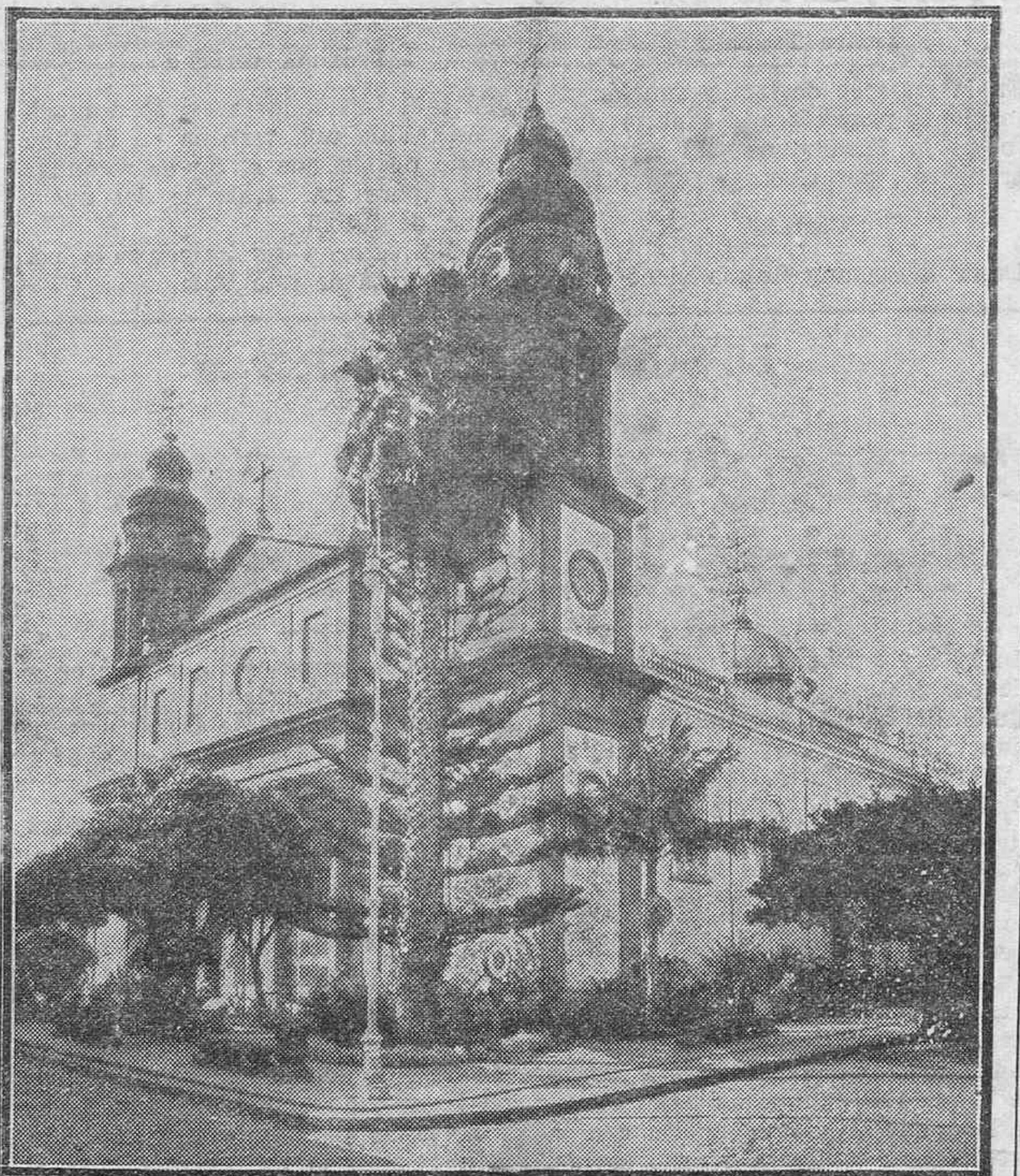
El templo catedral, donde se celebran los cultos más solemnes.

—María—le dice a su mujer—, ese es el que toca la matraca.