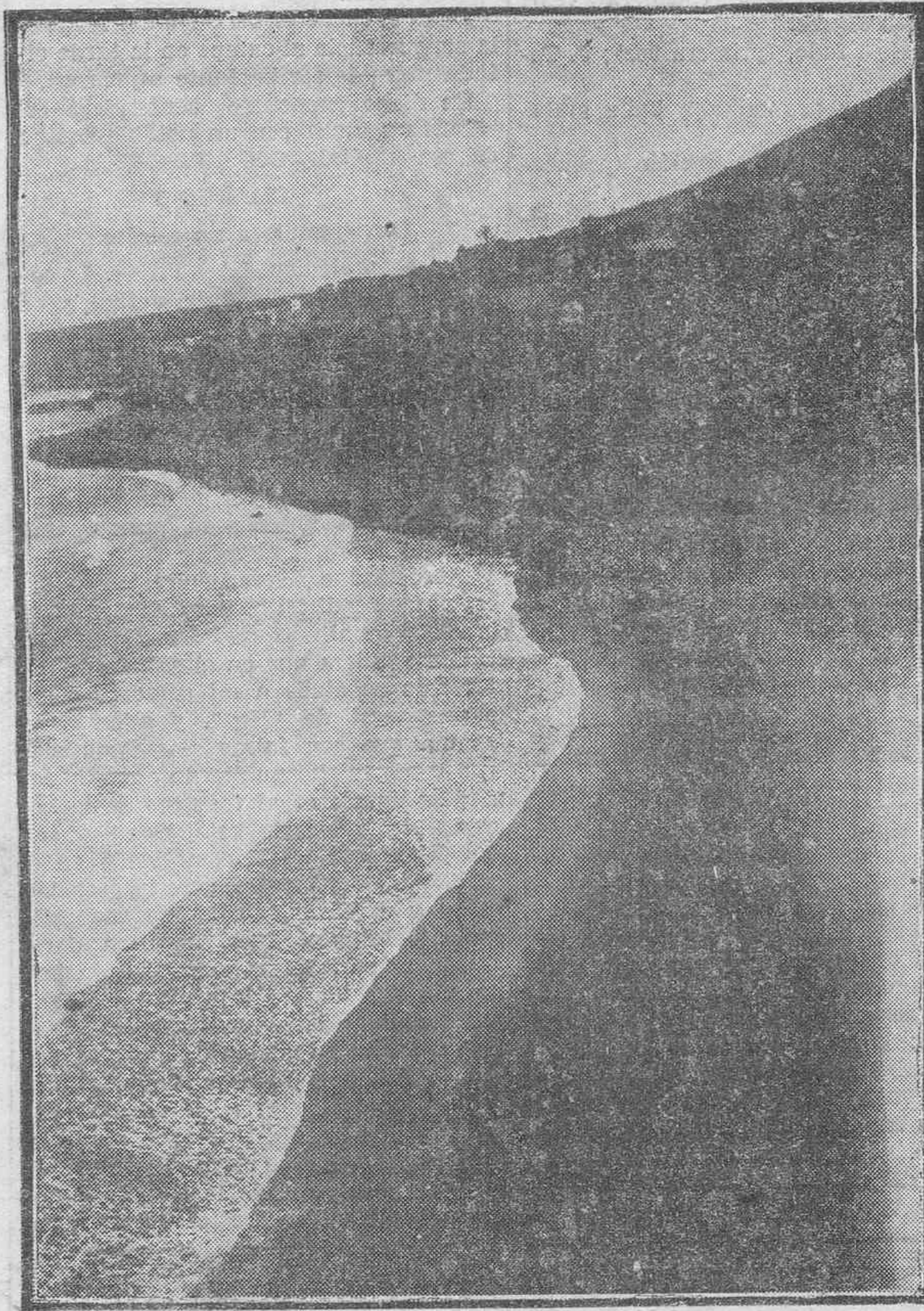
La playa del Arenal, situada entre Bajamar y la Punta del Hidalgo, donde se proyecta construir una rampa de acceso, según propuesta que ha hecho el señor Rodríguez López a la Junta de Carreteras. Con esta mejora, la citada playa del Arenal, que reúne excelentes condiciones para los bañistas, se convertirá en un lugar de esparcimiento veraniego, que seguramente ha de verse muy concurrido.