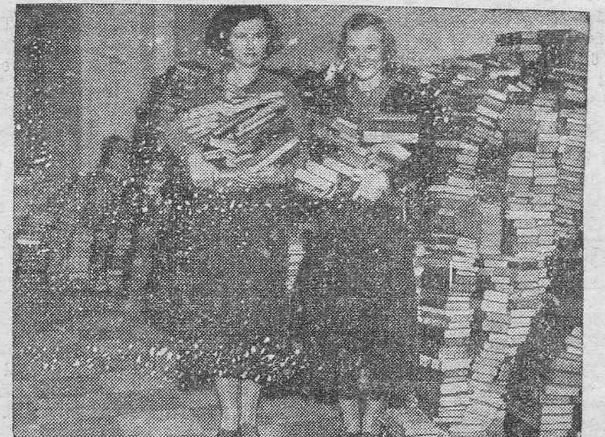
LIBROS PARA LOS DESOCUPADOS.—Un comité inglés se propone obtener un millón de libros para obreros parados. Ya ha recibido 25.000 libros.