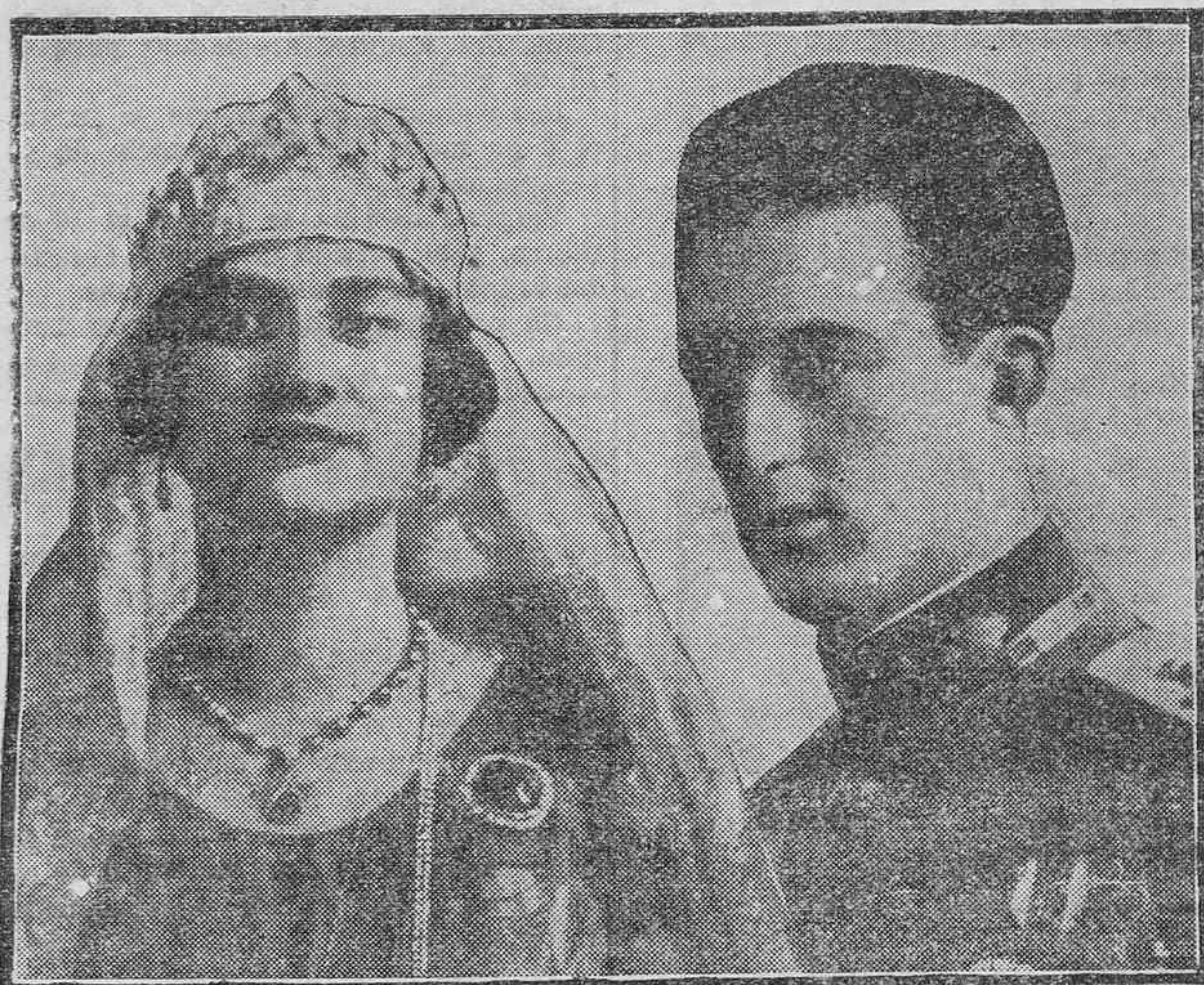
LOS NUEVOS REYES DE BELGICA

Empieza expresando la gran emoción y el enorme sentimiento que le produjera la trágica muerte de su padre; añade que no se le ocultan las