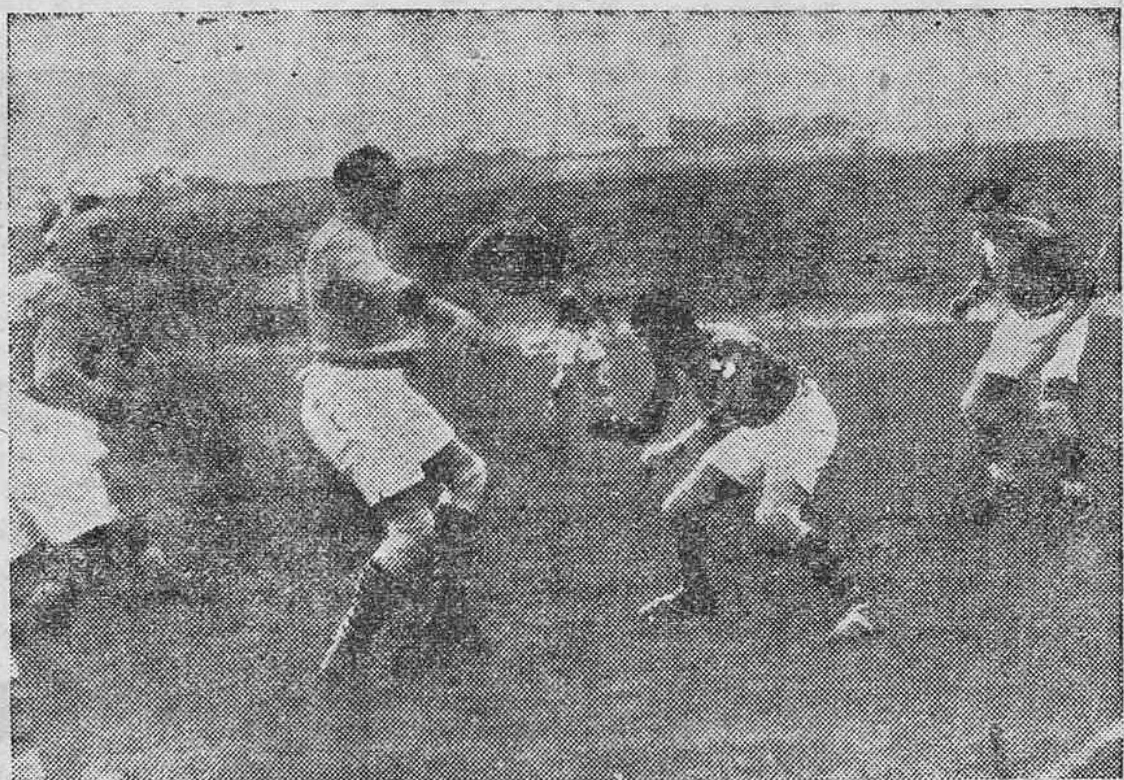
Interesante detalle de un partido de rugby celebrado últimamente en el Parque de los Príncipes de París.