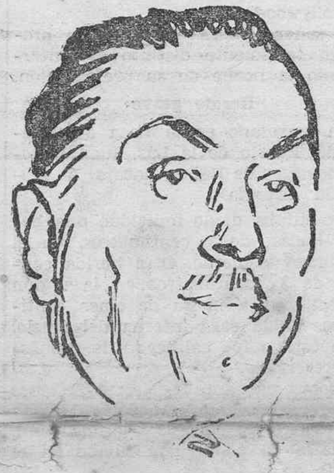
El ex-ministro de la Guerra, señor Martínez Barrio, que ayer tomó posesión de la cartera de Gobernación.

El caso del señor Calvo Sotelo fué objeto de un interesante debate en el Congreso con motivo de la proposición de las derechas para que pueda ejercer inmediatamente su cargo de diputado. Como saben nuestros lectores, el señor Calvo Sotelo obtuvo tres actas en las últimas elecciones, pero como sobre él pesa una sanción impuesta por un tribunal parlamentario se ha planteado la cuestión de su incapacidad, que defienden tenazmente las izquierdas frente al criterio del bloque de derechas, favorable a la admisión de dicho diputado.