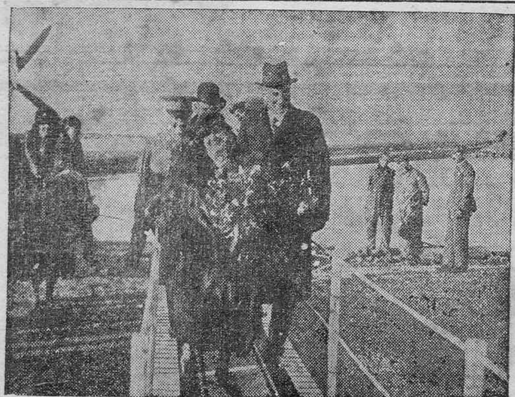
El ministro de Negocios Extranjeros de Inglaterra, John Simón, al desembarcar de un hidroplano en Ostia para asistir a la Conferencia con Mussolini

Creo que se habrán ustedes dado cuenta de lo que es un «vivero», cosa necesaria para que comprendan lo que trato de decir. Pues bien, ya que lo saben, añadiré que el pescado de «vivero» se alimenta, durante el tiempo que permanece cautivo en esa especie de jaulones sumergidos en las aguas de la bahía, de aquellas materias que llegan al alcance de sus bocas, siendo tan dignos de elogio por su voracidad como por el poco cuidado con que miran la selección de tales manjares. Pero es el caso que las aguas de la bahía no siempre contienen o llevan un lado para otro materias inodoras, sino que frecuentemente se mezclan con líquidos o sólidos de pronunciado olor y sabor, de algunos de los cuales mejor es no hablar. Puede, no obstante, hacerse mención del aceite, grasas, etcétera, que los buques y embarcaciones menores expulsan por sus conductos de desagüe, cuando se dedican, en el interior de la bahía, a esas operaciones de limpieza que frecuentemente se ven obligados a realizar. Parece que tales materias son muy del agrado de los peces de «vivero» que se dan de ellas verdaderos atracones, sin advertir, en su culpable improvisación, que luego, en el