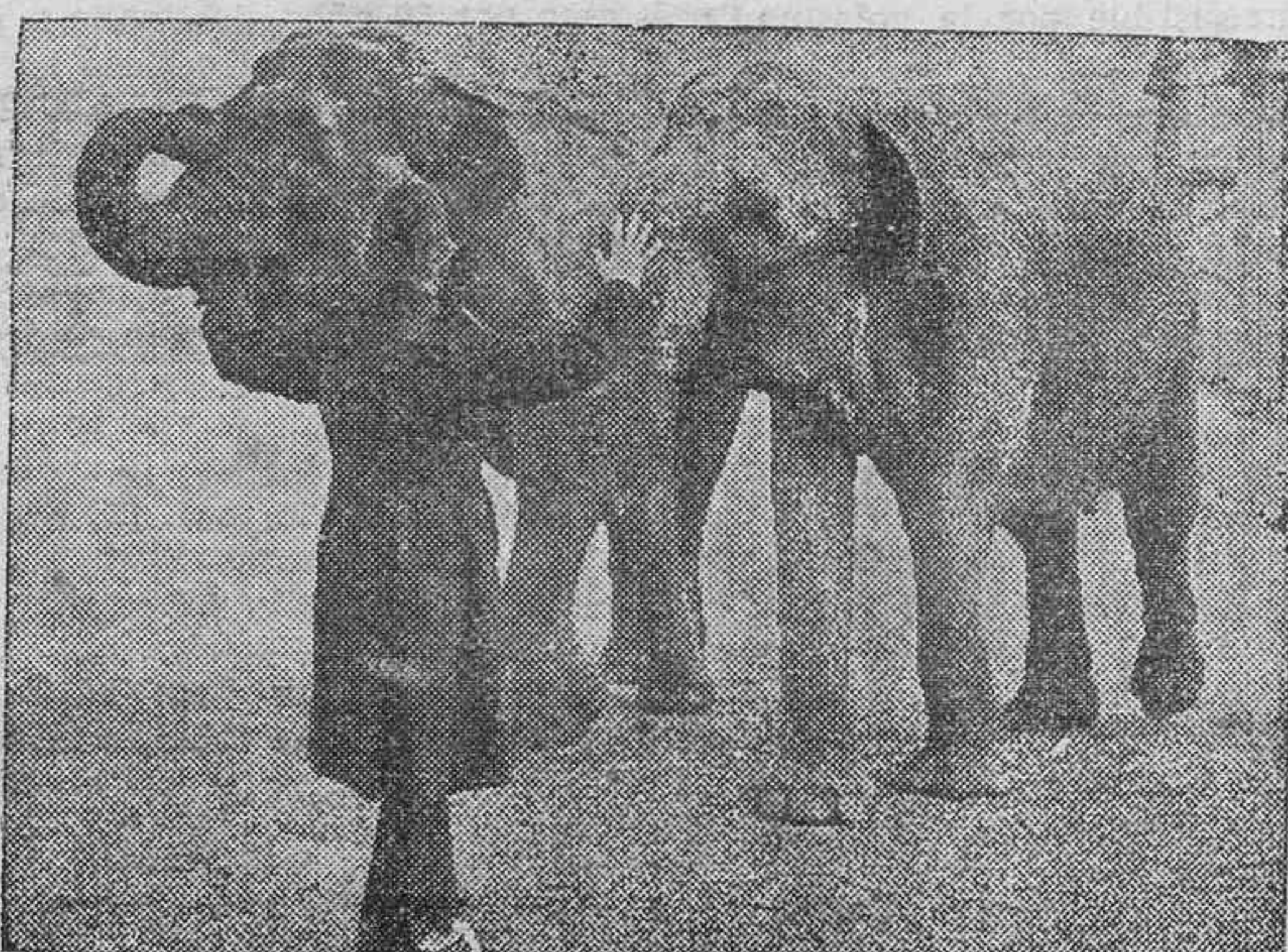
Dos elefantes del circo del Cristal Palace, de Londres, contenidos por un guardia de la circulación por infringir los reglamentos municipales