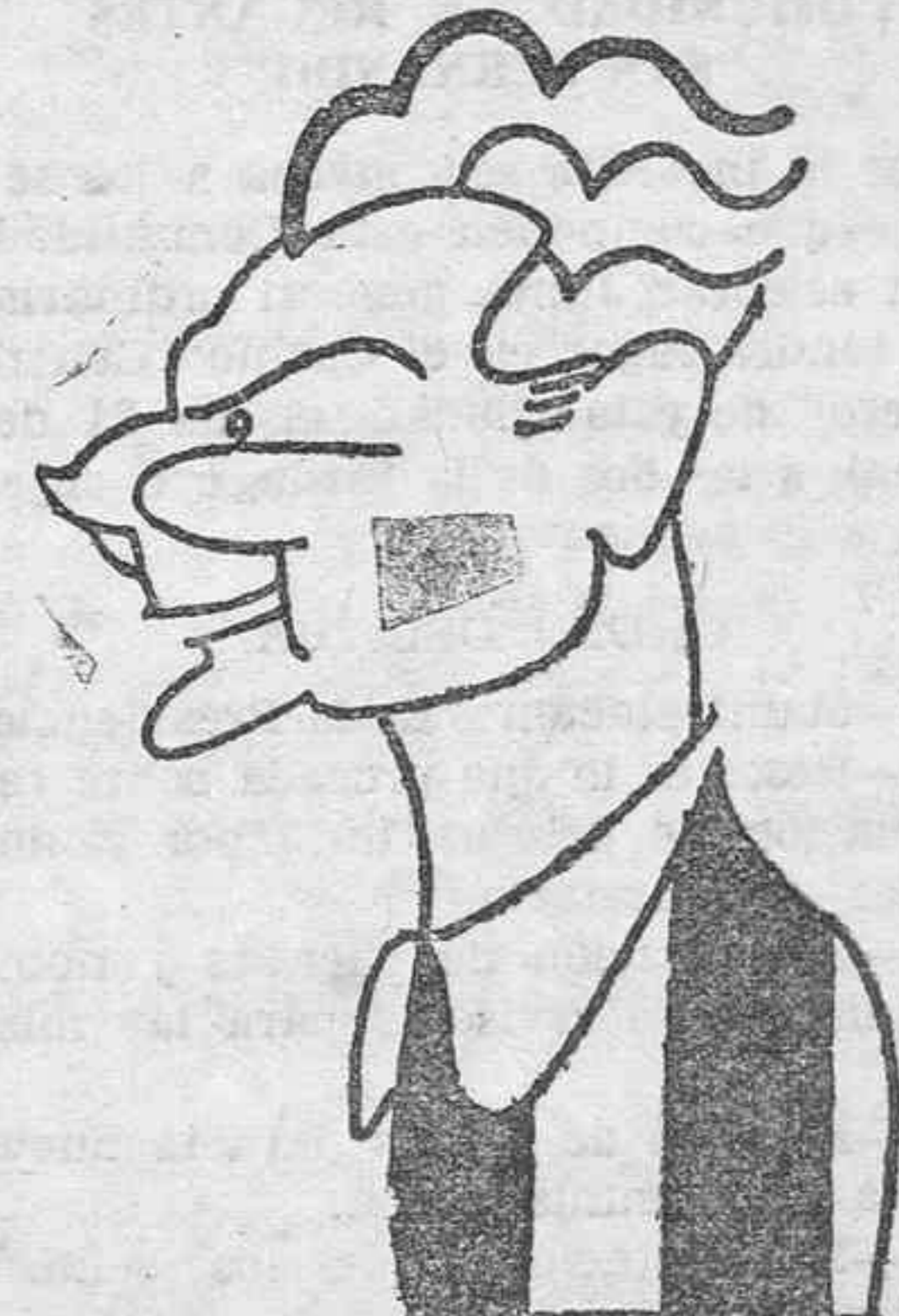
Loyola, medio del Español y uno de los puntales más firmes de este equipo.

En la primera vuelta triunfaron los iruneses pero hoy cambiará la cosa y el Athletic se adjudicará los pun-