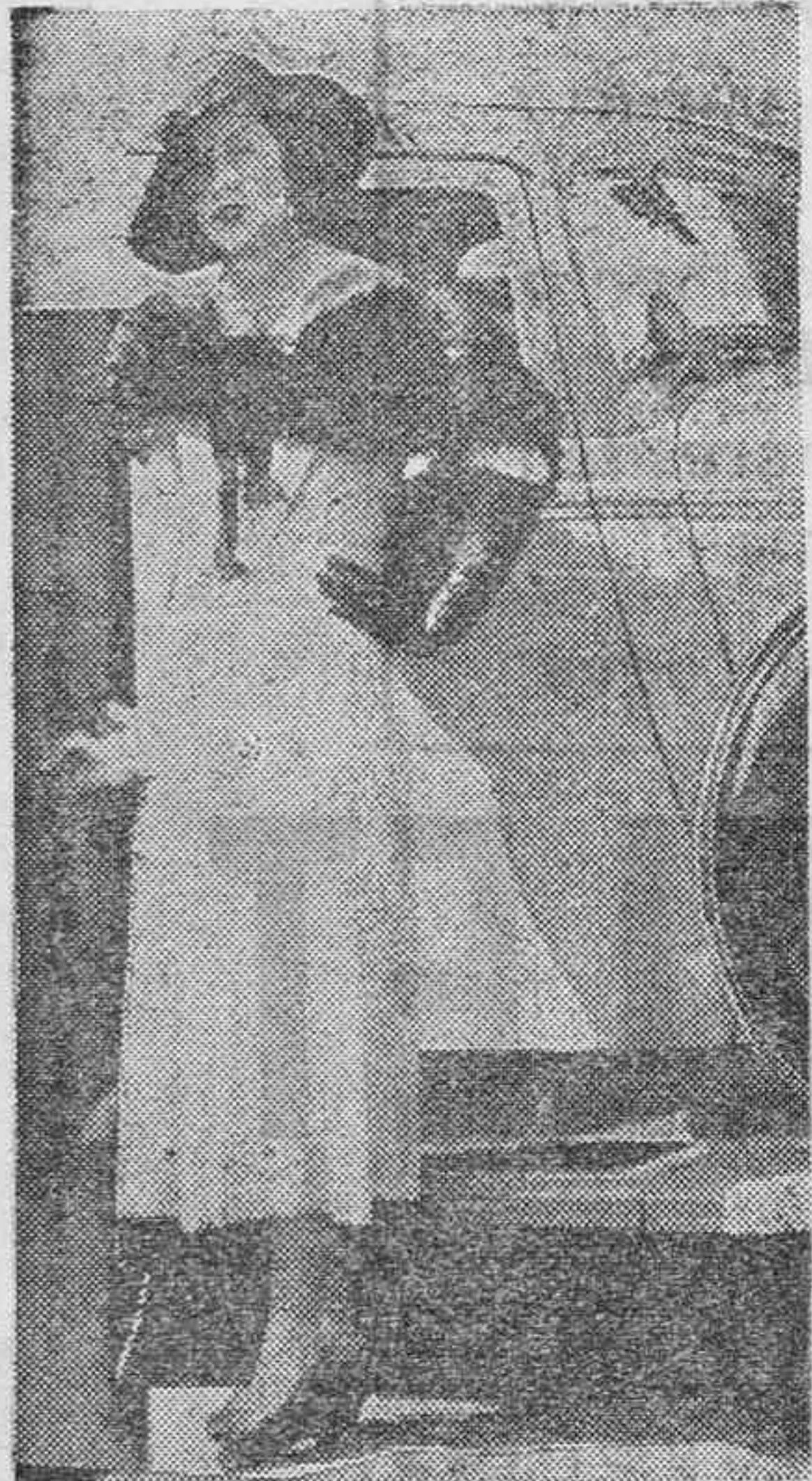
La esposa de Stavisky, que obtuvo el premio de elegancia en el concurso de Cannes

La mayor parte de la Prensa francesa ha publicado esta carta, que de ser auténtica desaparecerá por completo la suposición de que Stavisky no murió por su voluntad.