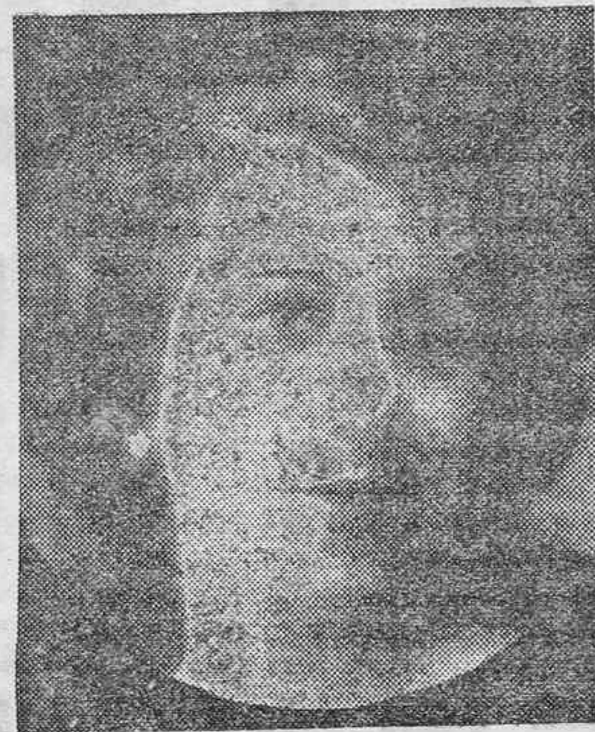
La hija de Stavisky

carño que siento por ti. Tú has sido siempre la guía de mi vida, y por esta razón, yo "considero un deber mío desaparecer". Tú sabes de cuánto cariño he rodeado yo a nuestros pequeños. Contengo el deseo de dejarles