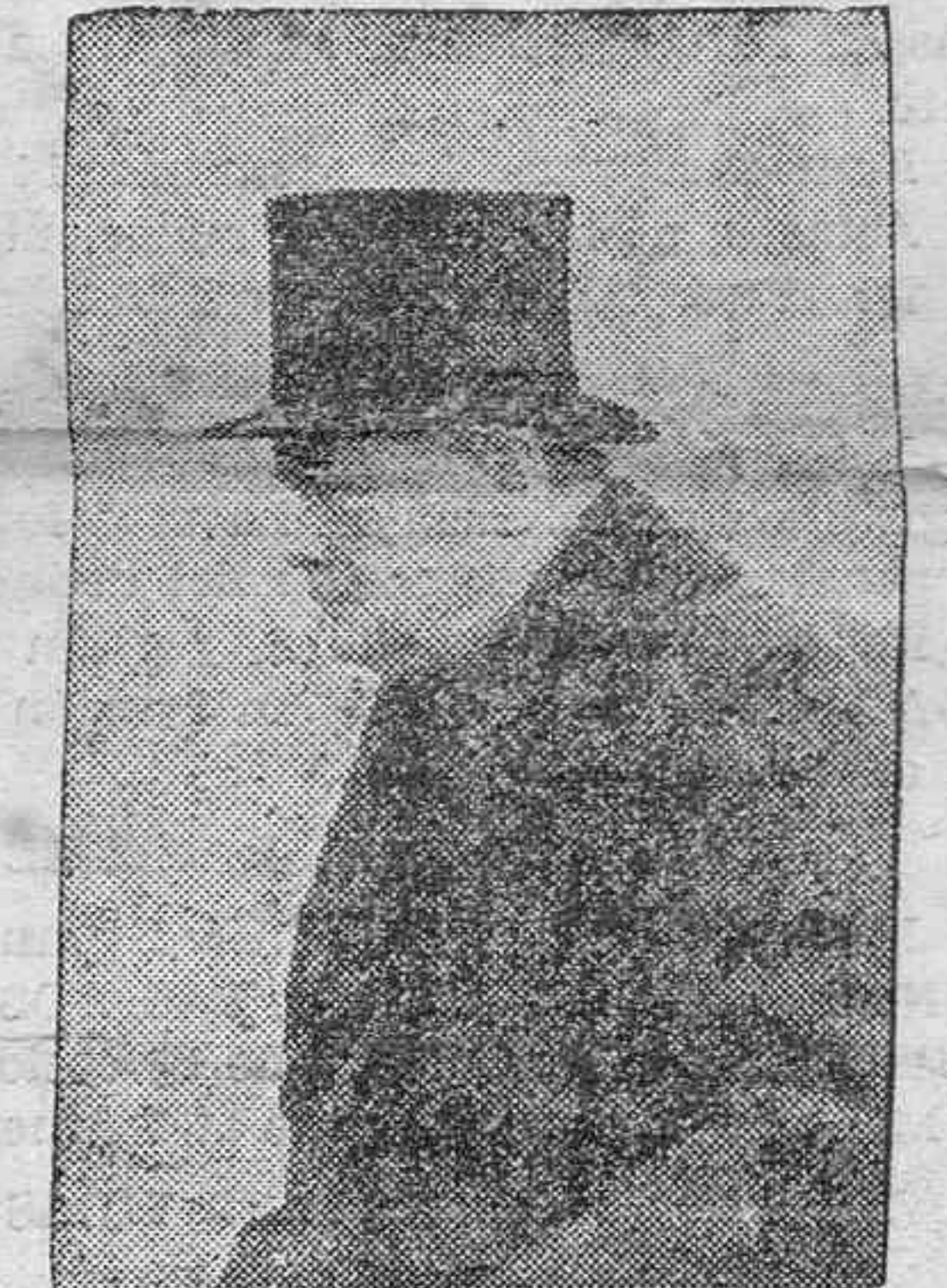
Winston Churchill, el gran político conservador inglés y literato, se ha refugiado otra vez en su retiro, en las afueras de Londres, para entregarse a la escritura del segundo volumen de su biografía de Marlborough—el famoso Mamburá de las gestas y cantos populares—. La vida de este hombre, que tanta popularidad ha conquistado en la política y en las letras, es verdaderamente original. Se levanta a las ocho de la mañana. A las diez ya se encuentra, con mono y paleta, trabajando con los albañiles que construyen la represa de su finca de Chartwell. Es un albañil bastante bueno, como lo demuestra la casita que se ha hecho él mismo. Desde las diez de la mañana a las cuatro de la tarde, trabaja de albañil o de excavador. Desde las cuatro a las siete y media, dicta a su secretario, labor que interrumpe para cenar y reanuda con frecuencia más tarde, hasta la una de la madrugada. Mr. Churchill dicta alrededor de 2.000 palabras por día. El secretario las escribe y él las corrige muy a la ligera, enviándolas enseguida al editor.