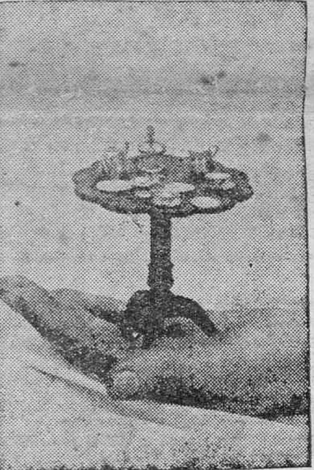
En la Exposición de Artes y Obras Manuales de Londres figura esta pequeña mesa con servicio de té, que llama la atención de los visitantes por la habilidad que revelan sus autores.