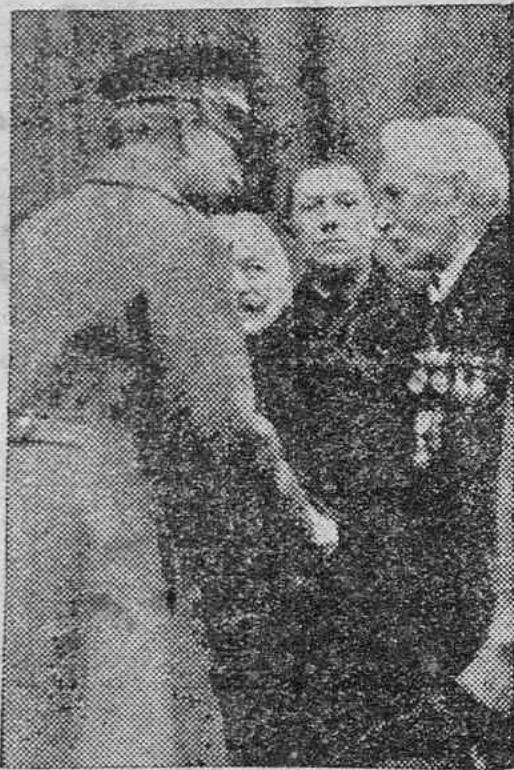
El rey Alberto de Bélgica conversando con un antiguo criado de su padre, el rey Leopoldo.