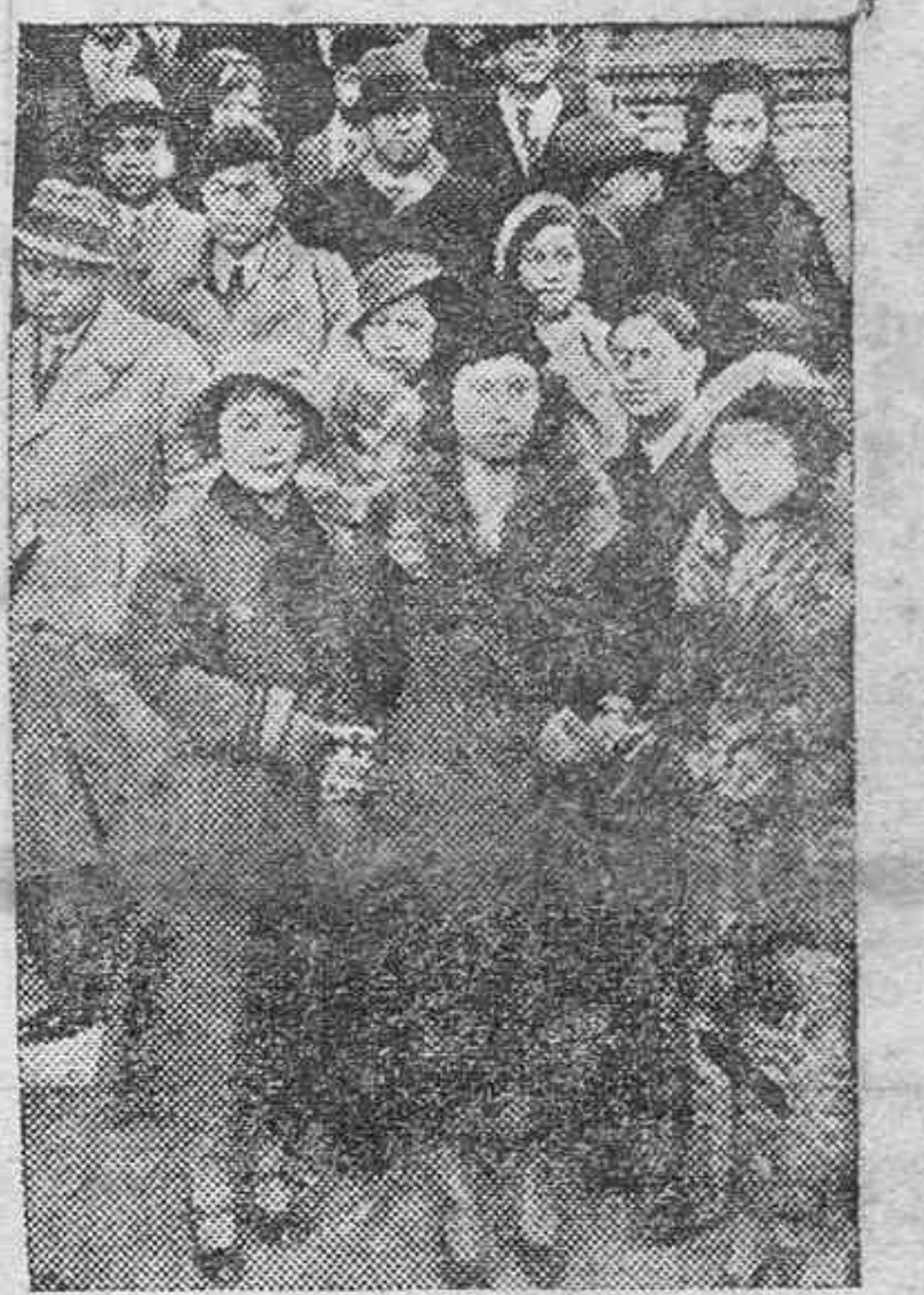
Grupo de estudiantes orientales de Medicina, que actualmente recorren varias capitales de Europa.