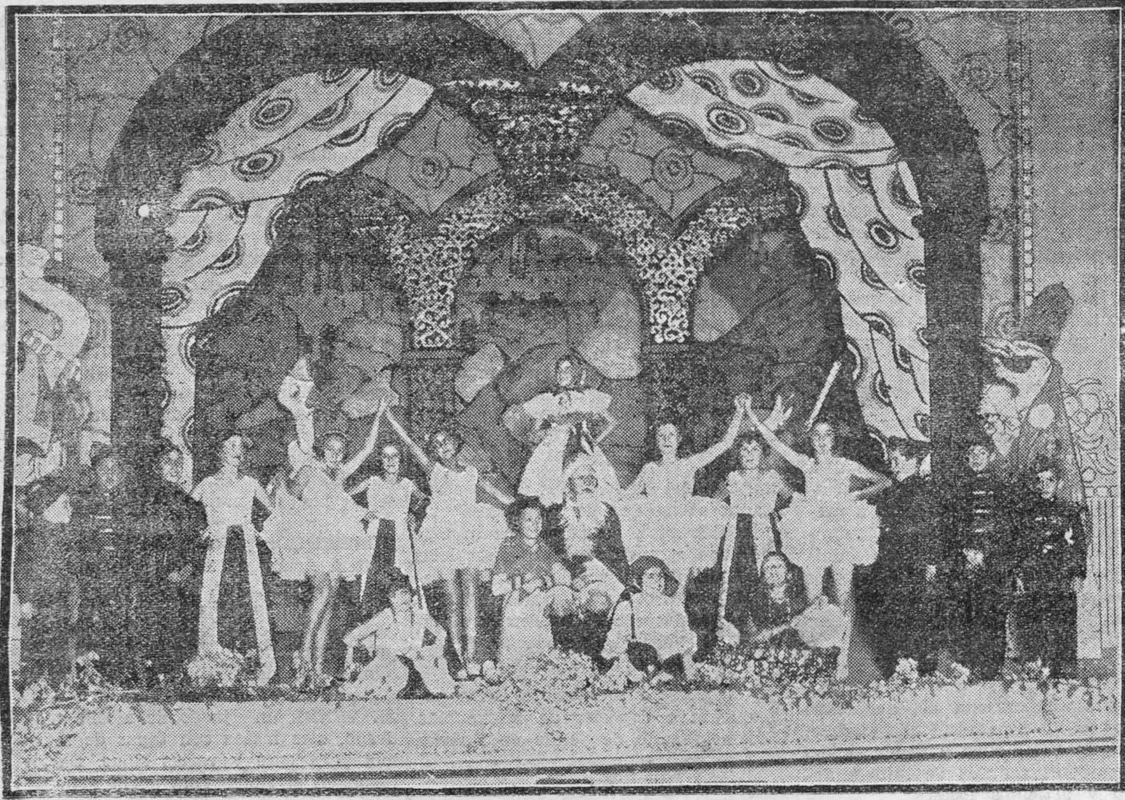
"El país de los juguetes", zarzuela de Diez del Corral, con un cuadro de José Rial; uno de los números más salientes del festival del Asilo Victoria que se celebrará esta tarde en el Teatro Guimerá.