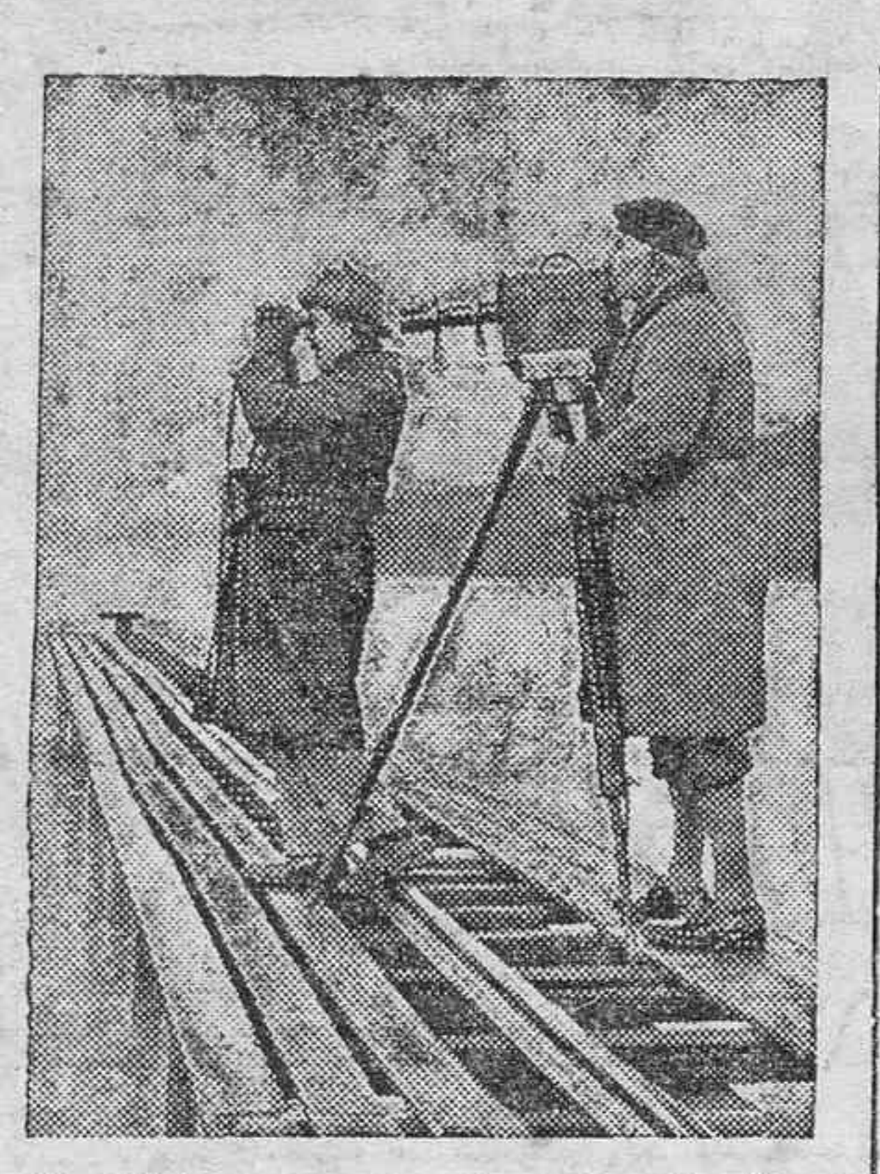
El célebre cazador de fieras inglés, Mr. Wetherell, esperando el momento de poder fotografiar en su cámara al monstruo marino del lago Loch Ness, en Escocia. Mr. Wetherell, lleva ya varias semanas aguardando inútilmente la aparición del monstruo.

Como ya saben nuestros lectores, el lago Neff, de Escocia, siempre tan ignorado, a pesar de su considerable extensión, está conquistando el primer puesto de la actualidad, no sólo en la prensa inglesa, sino en la prensa mundial. En este "loch" escocés donde lo más que se encuentran los pescadores son tenecas de buen tamaño, ha aparecido hace unos días un monstruo que ha llenado de espanto a la veintena de personas que aseguran haberle visto en diferentes ocasiones. Las montañas y los lagos escoceses, envueltos en el misterio de las brumas, se prestan a ser escenarios de consejas y leyendas.