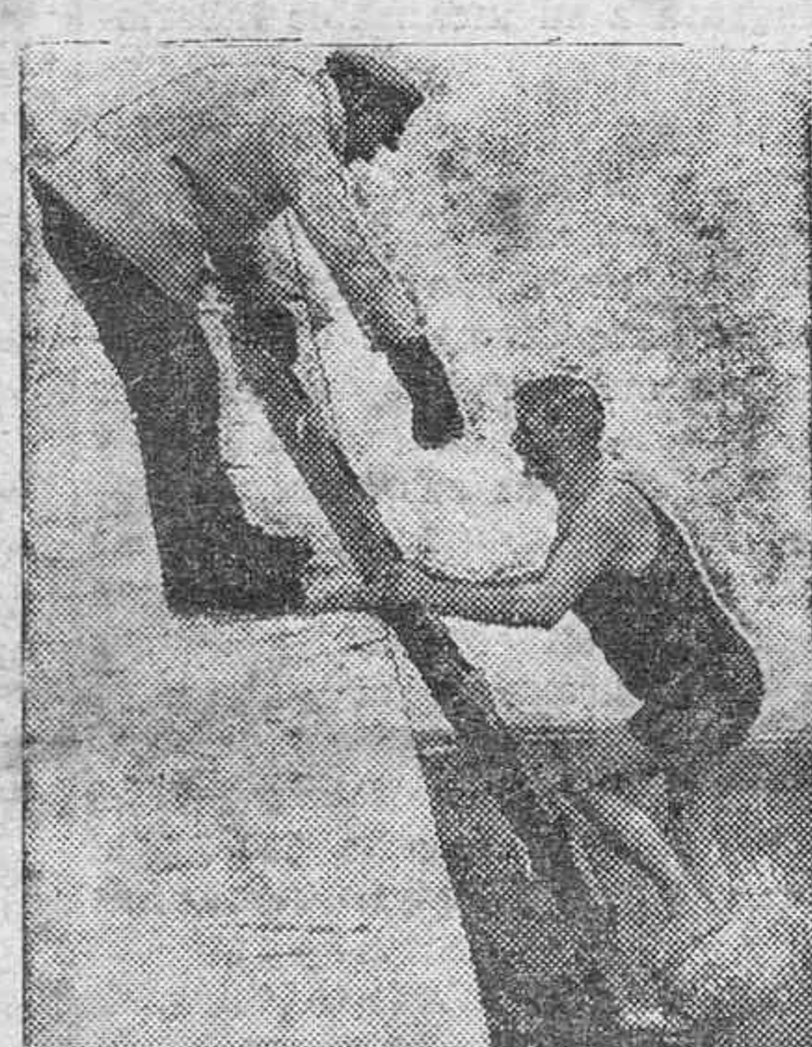
He aquí un sport que no tendrá seguramente muchos adeptos. Un bañista de invierno, que después de tomar su ducha diaria en el agua helada, abandona el baño sin experimentar la más ligera sensación de frío.