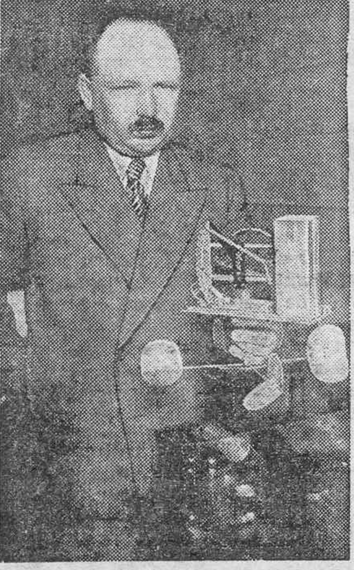
El profesor ruso, Molchanov, que prepara una nueva ascensión a la estratosfera, en el globo "Ussu", el más grande del mundo, y en el que podrá llegar a una altura de 24 mil metros, batiendo el record mundial. En la fotografía aparece el profesor ruso rodeado de los aparatos que han de servirle para sus observaciones durante el sensacional vuelo, que es esperado con gran curiosidad en el mundo científico.